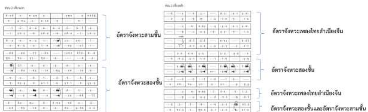
แผนภาพที่ 3 อัตราจังหวะท่อนที่ 2

3.2 ท่อนที่ 2 ประโยคแรกเป็นการใช้สำนวนกลอนที่มีอยู่ในเพลงเดี่ยวทั่วไปในลักษณะการตีเล่นมือ มีทั้งการตีแบบสวนและตีตาม จากนั้นเป็นการตีในลักษณะห้ามเสียงด้วยมือซ้ายในลักษณะการตีแบบการตีไล่เสียงจากเสียง ซอล ไปถึงเสียง มีสูงจนจบวรรคแรกในท่อนที่แปด จากนั้นใช้สำนวนกลอนทางระนาดทุ้ม โดยใช้กลวิธีการตีปิดมือเพื่อห้ามเสียงด้วยมือขวาและใช้สำนวนกลอนแบบธรรมดาที่อยู่ในเพลงเดี่ยวทั่วไปเพื่อส่งสำนวนกลอนไปในลักษณะการตีแบบคู่ 12 สลับกับการตีคู่แปด และมีการใช้มือขวาตีหลายพยางค์ติดต่อกันและใช้อัตราจังหวะสามชั้นจนถึงท่อนที่ 32 เพื่อเป็นการผ่อนแรงของผู้บรรเลงและให้เสียงที่ใช้บรรเลงนั้น มีความชัดเจนมากยิ่งขึ้น จากนั้นสร้างทำนองให้มีความกระชับมากยิ่งขึ้น โดยกำหนดให้ใช้อัตราจังหวะ 2 ชั้นเพื่อส่งทำนองเข้าสู่สำเนียงจีนในท่อนที่ 2 และเปลี่ยนการใช้จังหวะ 2 ชั้น เป็นจังหวะพิเศษในอัตราจังหวะเพลงไทยสำเนียงจีนสลับกับอัตรา 2 ชั้นจนจบเพลง