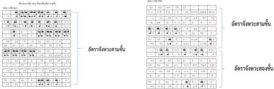
แผนภาพที่ 2 อัตราจังหวะ ท่อนที่ 1

3.2 ท่อนที่ 2 ประโยคแรกเป็นการใช้สำนวนกลอนที่มีอยู่ในเพลงเดี่ยวทั่วไปในลักษณะการตีเล่นมือ มีทั้งการตีแบบสวนและตีตาม จากนั้นเป็นการตีในลักษณะห้ามเสียงด้วยมือซ้ายในลักษณะการตีแบบการตีไล่เสียงจากเสียง ซอล ไปถึงเสียง มีสูงจนจบวรรคแรกในท่อนที่แปด จากนั้นใช้สำนวนกลอนทางระนาดทุ้ม โดยใช้กลวิธีการตีปิดมือเพื่อห้ามเสียงด้วยมือขวาและใช้สำนวนกลอนแบบธรรมดาที่อยู่ในเพลงเดี่ยวทั่วไปเพื่อส่งสำนวนกลอนไปในลักษณะการตีแบบคู่ 12 สลับกับการตีคู่แปด และมีการใช้มือขวาตีหลายพยางค์ติดต่อกันและใช้อัตราจังหวะสามชั้นจนถึงท่อนที่ 32 เพื่อเป็นการผ่อนแรงของผู้บรรเลงและให้เสียงที่ใช้บรรเลงนั้น มีความชัดเจนมากยิ่งขึ้น จากนั้นสร้างทำนองให้มีความกระชับมากยิ่งขึ้น โดยกำหนดให้ใช้อัตราจังหวะ 2 ชั้นเพื่อส่งทำนองเข้าสู่สำเนียงจีนในท่อนที่ 2 และเปลี่ยนการใช้จังหวะ 2 ชั้น เป็นจังหวะพิเศษในอัตราจังหวะเพลงไทยสำเนียงจีนสลับกับอัตรา 2 ชั้นจนจบเพลง