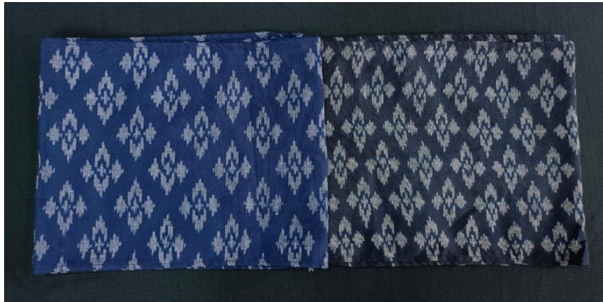
รูปภาพที่ 1 ผ้าไหมลายดอกผักต้ว

2.3 การออกแบบเครื่องแต่งกาย ผู้สร้างสรรค์ใช้ผ้าไหมลายดอกผักต้วของชุมชนบ้านลาดบุรพา ตำบลศรีสุข อำเภอกันทรวิชัย จังหวัดมหาสารคาม เป็นองค์ประกอบเครื่องแต่งกาย ดังนี้