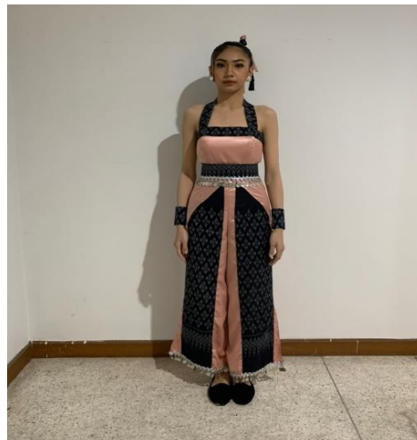
รูปภาพที่ 2-3 การแต่งกายชุดที่ 1 (ภาพซ้ายมือ) และการแต่งกายชุดที่ 2 (ภาพขวามือ)

2.4 การออกแบบกระบวนท่ารำ การแสดง ชุด ศิลปภูษาบุรพา ผู้สร้างสรรค์คิดประดิษฐ์สร้างสรรค์ขึ้นใหม่โดยยึดหลักกระบวนท่ารำบางส่วนมาจากแม่บทอีสานมาผสมผสานศิลปะการแสดงทางด้านตะวันตกแบบร่วมสมัย เช่น กระบวนท่าเต้นแบบ Modern dance