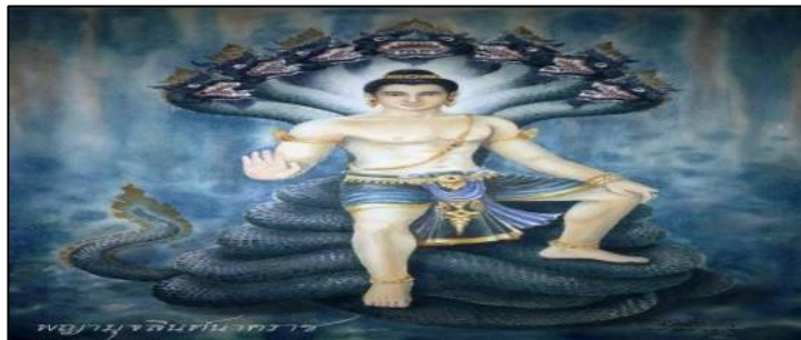
ภาพประกอบที่ 3 พญาอุษงค์นาคราช

3.3) พญาอุษงค์นาคราช: เป็นพญานาคที่มีผิวกายเป็นสีเทา มีหงอนและเศียรสีแดง มีเศียร 1 เศียร เป็นเจ้าวิสุทธิ เทวา เป็นพญานาคราชประจำองค์พระศิเวเทพหรือพระอิศวรเจ้า อยู่ในตระกูลฉัพพะยาปุตตะ