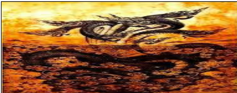
ภาพประกอบที่ 7 พญานาคดำแสนศิริจันทรานาคราช