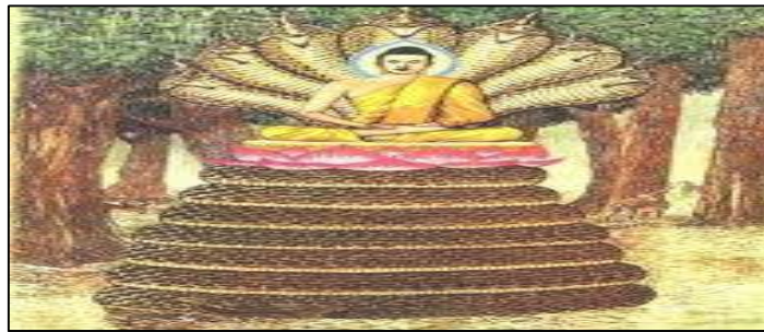
ภาพประกอบที่ 3 พญามุจลินท์นาคราช

3.2) พญามุจลินท์นาคราช: เป็นพญานาคมีอานภาพมาก อาศัยอยู่ที่สระโบกขรณี ใกล้ต้นไม้มุจลินท์ สายพันธุ์ของพญามุจลินท์นาคราช คือ พญานาค 7 เศียร ซึ่งสืบสายพันธุ์มาจากพญาศรีสัตตนาคราช (นาคาธิบดีสีสัตตนาคราช) ซึ่งเชื่อว่าเป็นกษัตริย์แห่งพญานาคที่ฝั่งลาว