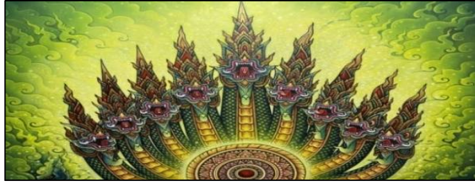
ภาพประกอบที่ 2 พญานันตนาคราช

3.2) พญามุจลินท์นาคราช: เป็นพญานาคมีอานภาพมาก อาศัยอยู่ที่สระโบกขรณี ใกล้ต้นไม้มุจลินท์ สายพันธุ์ของพญามุจลินท์นาคราช คือ พญานาค 7 เศียร ซึ่งสืบสายพันธุ์มาจากพญาศรีสัตตนาคราช (นาคาธิบดีสีสัตตนาคราช) ซึ่งเชื่อว่าเป็นกษัตริย์แห่งพญานาคที่ฝั่งลาว