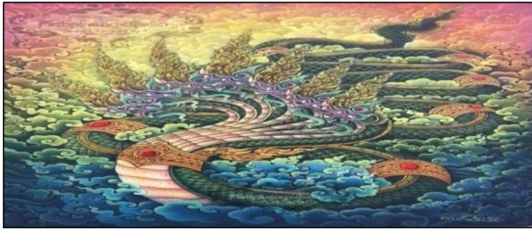
ภาพประกอบที่ 5 พญาศรีสัตตนาคราช

3.5) พญาศรีสัตตนาคราช: มีความเชื่อว่าเป็นกษัตริย์แห่งพญานาคแม่น้ำโขงด้านฝั่งลาว มีเศียร 7 เศียร เป็นตระกูลพญานาคที่มีมาแต่ครั้งพุทธกาล มีความใกล้ชิดพระพุทธรองค์และพระพุทธรศาสนา ถือว่าเป็นต้นตระกูลแห่งพญานาคทั้งหมด มีบริวาร 5,000 ตัว เป็นพญานาคที่ขอบริกาษาศิลปวัฒนธรรม และมาที่วัดพระธาตุพนมเสมอ เป็นเพื่อนกันกับพญาศรีสุทโธนาคราชที่ปกครองอยู่ทางฝั่งไทย