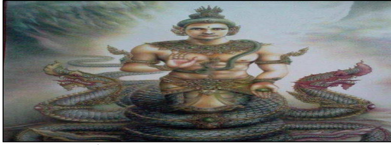
ภาพประกอบที่ 4 พญาศรีสุทโธนาคราช

3.5) พญาศรีสัตตนาคราช: มีความเชื่อว่าเป็นกษัตริย์แห่งพญานาคแม่น้ำโขงด้านฝั่งลาว มีเศียร 7 เศียร เป็นตระกูลพญานาคที่มีมาแต่ครั้งพุทธกาล มีความใกล้ชิดพระพุทธรองค์และพระพุทธรศาสนา ถือว่าเป็นต้นตระกูลแห่งพญานาคทั้งหมด มีบริวาร 5,000 ตัว เป็นพญานาคที่ขอบริกาษาศิลปวัฒนธรรม และมาที่วัดพระธาตุพนมเสมอ เป็นเพื่อนกันกับพญาศรีสุทโธนาคราชที่ปกครองอยู่ทางฝั่งไทย