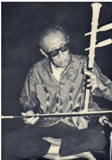
ภาพที่ 1 หลวงไพเราะเสียงซอ (อุ้น ดุริยะชีวิน)

หลวงไพเราะเสียงซอ (อุ้น ดุริยะชีวิน) ภูมิลำเนาเดิมอยู่อำเภอเสนา จังหวัดพระนครศรีอยุธยา เกิดเมื่อวันที่ 23 พฤศจิกายน พ.ศ. 2435 บิดา ชื่อ นายพยอม มารดา ชื่อ นางเทียบ มีบุตรชาย 8 คน และบุตรสาว 5 คน หลวงไพเราะเสียงซอ (อุ้น ดุริยะชีวิน) เริ่มเรียนซอด้วงจากบิดาซึ่งเป็นคนสี่ซอด้วงในวงแอ้ว ได้เข้ารับราชการเนื่องจากมีฝีมือที่ยอดเยี่ยมในการสี่ซอทั้งซอด้วง ซออู้และซอสามสาย ได้รับพระราชทานบรรดาศักดิ์เป็นขุนดนตรีบรรเลง และหลวงไพเราะเสียงซอตามลำดับ ได้รับพระราชทานนามสกุล “ดุริยะชีวิน” จากพระบาทสมเด็จพระมงกุฎเกล้าเจ้าอยู่หัวลำดับที่ 2107 พระราชทานเมื่อวันที่ 23 มีนาคม พ.ศ. 2457