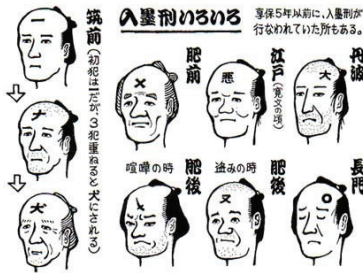
ภาพที่ 5 การสักเพื่อการลงโทษเรียงลำดับจากเบาไปหนัก

ผู้ที่กระทำผิดจะถูกสักที่หน้าผากเป็นรูปสัญลักษณ์ x/- เป็นต้น เมื่อกระทำผิดซ้ำจะถูกสักเพิ่มทีละขีด พร้อมทั้งรับโทษสถานอื่นเพิ่มเติมด้วย เมื่อถูกสักครบ 3 ครั้งจะถูกประหารชีวิต รอยสักมีลวดลายแตกต่างกันไปตามแต่ละภูมิภาค นอกเหนือจากการสักที่หน้าผากแล้ว ยังมีการสักที่บริเวณแขนซ้ายเป็นเส้นแนวยาว 2-3 เส้นอีกด้วย