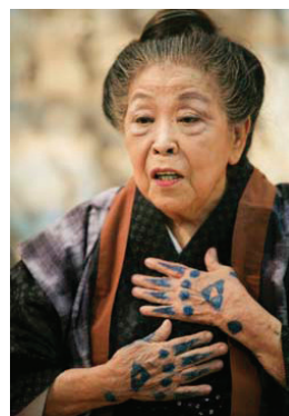
ภาพที่ 3 รอยสักบนหลังมือของหญิงชาวโอกินาว่า

เด็กผู้หญิงจะเริ่มสักที่นิ้วกลาง เมื่ออายุประมาณ 7 ปี และจะสักเพิ่มที่บริเวณหลังมือ ข้อมือ แขน และเอว เมื่ออายุครบ 15-16 ปี โดยมีวัตถุประสงค์เพื่อบ่งบอกการเปลี่ยนสถานะจากเด็กเป็นหญิงสาวผู้บริสุทธิ์ หลังจากแต่งงาน จะสักอีกครั้งในช่วงก่อนและหลังคลอดบุตร ณ ช่วงอายุ 24-25 ปี เพื่อบ่งบอกการเปลี่ยนแปลงสถานภาพจากภรรยาเป็นมารดา ในช่วงปฏิรูปประเทศ รัฐบาลเมจิได้ออกกฎหมายห้ามสัก ยังผลให้วัฒนธรรมการสักก็ค่อย ๆ เลือนหายไป รัฐบาลบังคับใช้กฎหมายกับประชาชนในเกาะอะมะมิ (Amami Islands) 7 ปีค.ศ. 1871 และปีค.ศ. 1899 สำหรับเกาะริวกิว ปัจจุบันวัฒนธรรมการสักของชาวเกาะ ได้เลือนหายไปจากสังคมญี่ปุ่น เหลือเพียงร่องรอยของอดีตที่ปรากฏบนภาพถ่าย (Takashima Sei 2003: 18)