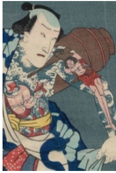
ภาพที่ 6 ภาพวาดอุคิโยะที่ปรากฏรอยสักบนเรือนร่างของบุรุษเพศ

เผยรอยสักของตนในที่สาธารณะ กล่าวกันว่ายุคเอโดะเป็นยุคที่รอยสักได้รับความนิยมสูงสุด ลวดลายตลอดจนเทคนิคการสักได้รับการพัฒนาอย่างต่อเนื่อง ค่านิยม วัฒนธรรม ความเชื่อของคนในยุคนี้สะท้อนผ่านรอยสักที่เป็นเอกลักษณ์ ดังจะเห็นได้จากภาพวาดอุคิโยะ