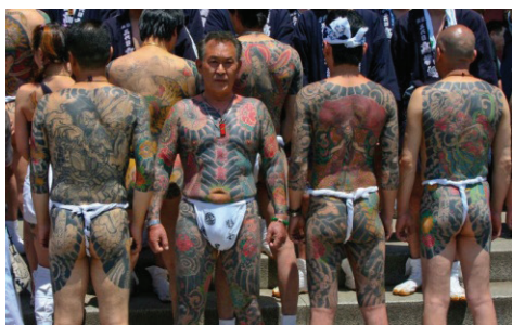
ภาพที่ 7 รอยสักรูปแบบต่างๆ ที่ปรากฏบนร่างกายของสมาชิกกลุ่มยาคุซ่า

นอกเหนือจาก 4 ชนชั้นที่กล่าวมาข้างต้น ยังมีกลุ่มชนชั้นล่างที่เรียกว่า “เอะตะ”(Eta) และ “ฮินิง”(Hinini) 16 นักพนันและพ่อค้าเร่ถูกจัดอยู่ในกลุ่มนี้ เมื่อมีงานวัด งานเทศกาลต่างๆ พ่อค้าเร่จะตั้งแผงลอยขายของ ขายอาหาร และเกมการละเล่น เช่น ปาเป้า ขว้างห่วง ซ้อนปลาทอง เป็นต้น กลุ่มพ่อค้าเร่จะรวมกลุ่มกันเพื่ออำนวยความสะดวกแก่สมาชิกในการแบ่งสรรพื้นที่และให้ความคุ้มครองพ่อค้าแม่ค้าตามงานเทศกาล สมาชิกต้องจ่ายค่าเช่าที่ และค่าคุ้มครองด้วย จากกลุ่มพ่อค้าเร่ ต่อมาได้พัฒนากลายเป็นกลุ่มอาชญากรขนาดใหญ่เรียกว่า “ยาคุซ่า”