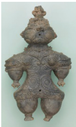
ภาพที่ 2 ตุ๊กตาดินเผาที่มีรอยสักบนใบหน้าและลำตัว