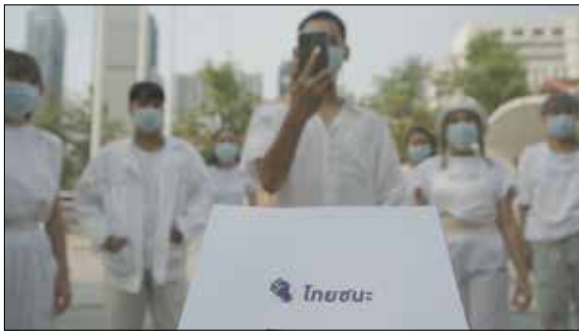
ภาพที่ 2 การออกแบบลีลาการเคลื่อนไหวหัวข้อฐานวิถีชีวิตใหม่