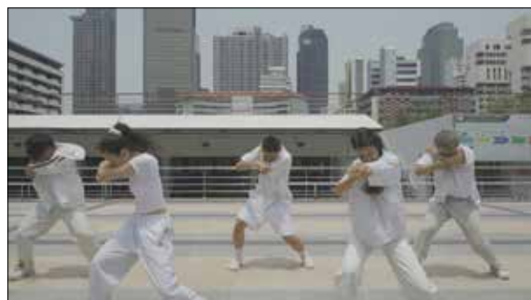
ภาพที่ 1 การออกแบบลีลาการเคลื่อนไหวหัวข้อวิธีการป้องกันตนเองจากโรคติดเชื้อไวรัสโคโรนาสายพันธุ์ใหม่

จากนั้นผู้วิจัยนำเครื่องมือที่ใช้ในการวิจัยไปตรวจสอบประสิทธิภาพหาความเที่ยงตรง และได้มีการแนะนำให้ปรับปรุงแก้ไขตามพิจารณาของผู้ทรงคุณวุฒิโดยมีคะแนนค่าเฉลี่ยจากผู้ทรงคุณวุฒิ จำนวน 3 ท่าน สรุปได้ว่าผู้ทรงคุณวุฒิมีความคิดเห็นว่าองค์ประกอบ และความเหมาะสมของสื่อความรู้ในการเผยแพร่วิธีการป้องกันตนเองจากโรคติดเชื้อไวรัสโคโรนาสายพันธุ์ใหม่และฐานวิถีชีวิตใหม่ด้วยนาฏศิลป์สร้างสรรค์ สำหรับเจเนอเรชันซีในโซเชียลมีเดีย มีความสอดคล้องกับวัตถุประสงค์ จากนั้นนำแบบประเมินและนำผลที่ได้มาดำเนินการปรับปรุงแก้ไขอีกครั้งให้สมบูรณ์เพื่อประสิทธิภาพของเครื่องมือที่ใช้ในการทดลองจริง