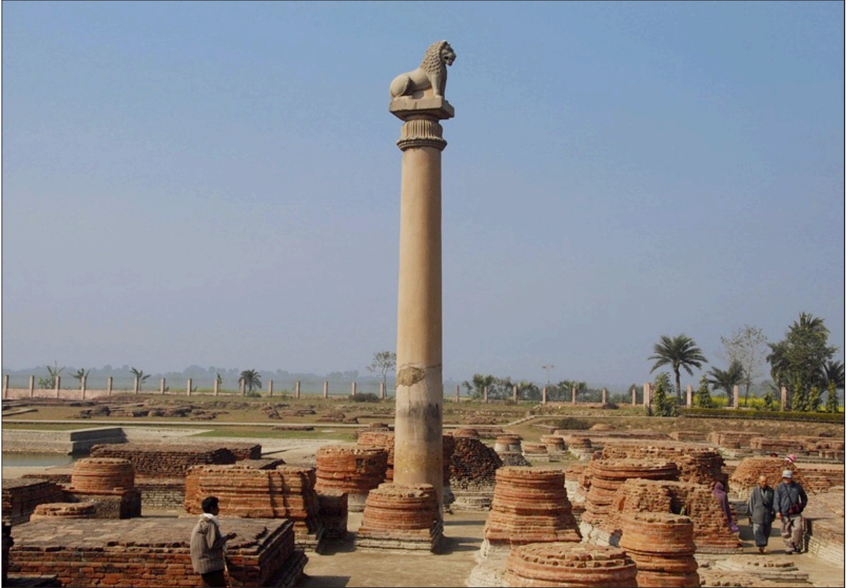
ภาพที่ 4 เสาหินทรายแดงสร้างในยุคพระเจ้าอโศกมหาราชเพื่อถวายเป็นพุทธบูชา เมืองไพศาลี ประเทศอินเดีย เมื่อวันที่ 16 ตุลาคม 2559

5) แบบปาละ (พุทธศตวรรษที่ 14-18) ถิ่นกำเนิดในแคว้นอ่าวเบงกอล ในสมัยราชวงศ์ปาละ อันเป็นศิลปะรุ่นสุดท้ายของพระพุทธศาสนาในประเทศอินเดีย มีลักษณะศิลปะของศาสนาพราหมณ์-ฮินดู ผสมผสานอยู่ (พระราชธรรมนิเทศ (ระแบบ ฐิตญาโณ), 2536 : 95)