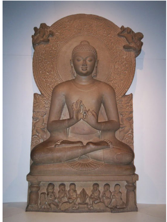
ภาพที่ 2 พุทธศิลป์สมัยคุปตะ แกะจากหินทรายแดง ปางแสดงปฐมเทศนา เมืองพาราณสี ประเทศอินเดีย ที่มา : ภาพถ่ายโดยผู้เขียน เมื่อวันที่ 12 ธันวาคม 2559

อย่างแท้จริง เต็มไปด้วยความวิริยะ อุตสาหะ และกรรมวิธีการสร้างอย่างยอดเยี่ยม