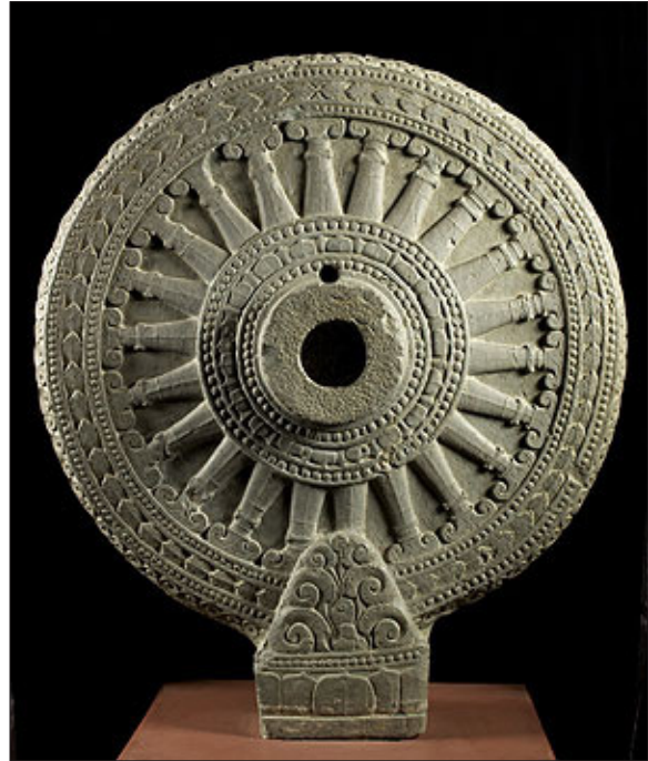
ภาพที่ 1 กงล้อธรรมจักรแกะจากหินทรายแดง ปัจจุบันเก็บไว้ใน พิพิธภัณฑ์เมืองโกลกาต้า ประเทศอินเดีย ที่มา : ภาพถ่ายโดยผู้เขียน เมื่อวันที่ 25 พฤศจิกายน 2559