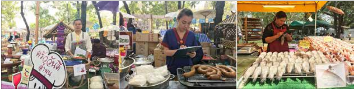
ภาพที่ 2 ภาพจากการเก็บข้อมูลแบบสอบถามและสัมภาษณ์คนท้องถิ่น เมื่อวันที่ 20-21 มกราคม 2561

แตกต่างกันและโดดเด่น อีกทั้งยังแสดงถึงความแท้ ซึ่งเป็นแนวคิดและทฤษฎีที่สำคัญที่มีความเชื่อมโยงเกี่ยวกับการท่องเที่ยวเชิงอาหาร