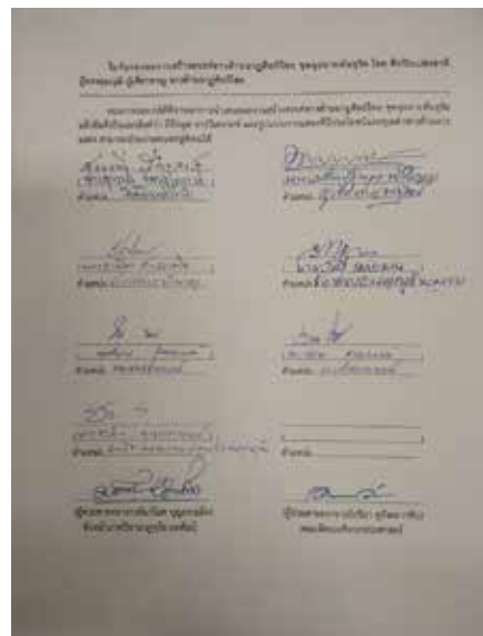
ภาพที่ 6 ภาพใบรับรอง ผลงานวิจัยนาฏศิลป์ไทยสร้างสรรค์ ชุดดูฉายพันธุรัต

จากผลการประเมิน ศิลปินแห่งชาติ ผู้ทรงคุณวุฒิ และผู้เชี่ยวชาญ ทั้ง 7 ท่าน จึงออกไปรับรองผลงาน สร้างสรรค์นาฏศิลป์ไทยสร้างสรรค์ ชุด ดูฉายพันธุรัต ให้สามารถนำออกแสดงเผยแพร่ได้