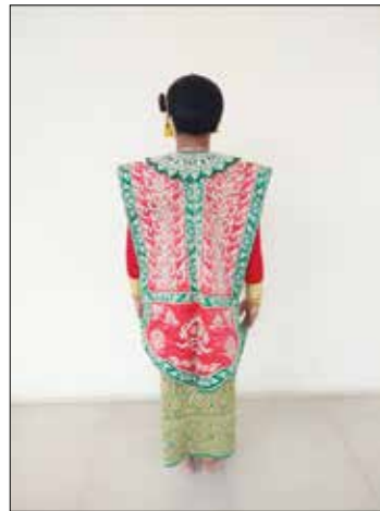
ภาพที่ 2 ภาพเครื่องแต่งกายนางพันธุรัต ( ด้านหน้า ด้านหลัง )