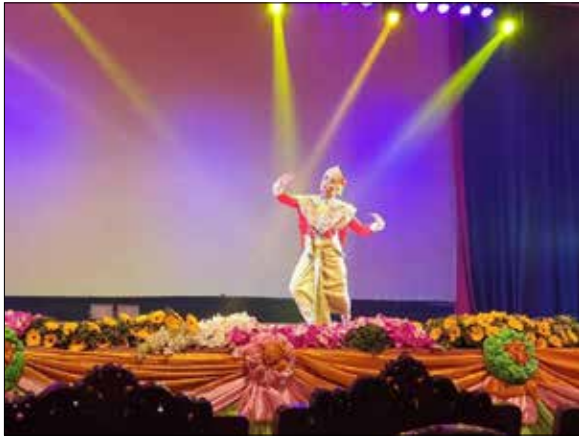
ภาพที่ 7 ภาพการนำเสนอในรูปแบบการแสดง ผลงานวิจัยนาฏศิลป์ไทยสร้างสรรค์ชุด อยุธยาพันธุรัต ในโครงการการนำเสนอผลงานวิจัยระดับชาติด้านศิลปะการแสดงครั้งที่ 2

วันที่ 28 กุมภาพันธ์ 2562