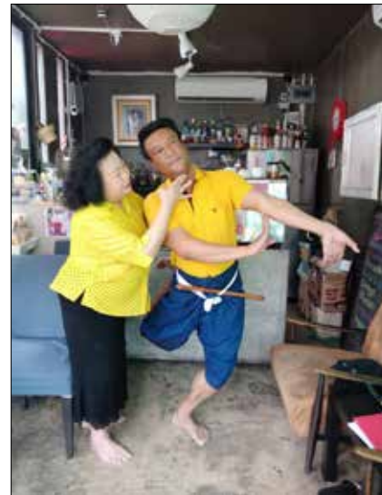
ภาพที่ 7 ภาพปรับท่ารำในเพลงแม่ศรี คำร้องที่ว่า “นารี” วันที่ 15 ตุลาคม 2561

2. แบบประเมินความคิดเห็นต่อผลงานสร้างสรรค์ ทางด้านนาฏศิลป์ไทยสร้างสรรค์ ชุด ดูฉายพันธุรัต ได้ค่า เฉลี่ยความพึงพอใจในระดับมากที่สุด ( \bar{x} = 5 )