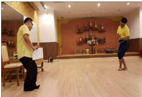
ภาพที่ 6 ภาพปรับท่ารำในเพลงดูฉาย คำร้องที่ว่า “เกรงเจ้า” ที่มา : ถ่ายภาพโดยผู้วิจัย, วันที่ 4 ตุลาคม 2561

1. ท่ารำในคำร้องดูฉาย เนื้อร้องที่ว่า “เกรงเจ้า” ปรับท่ารำโดย นายชวลิต สุนทรานนท์ นักวิชาการละคร ดนตรีทรงคุณวุฒิ (ปรับท่ารำวันที่ 4 ตุลาคม 2561)