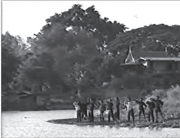
ความสัมพันธ์ระหว่างคุณค่าทางศิลปะและการเข้าถึงปรัชญา จิตวิทยา และธรรมชาติ ในการแสดง “สามมิติ” (2533) บันทึกการแสดง ณ บริเวณจุดเชื่อมแม่น้ำเจ้าพระยาและแม่น้ำป่าสัก จังหวัดพระนครศรีอยุธยา

7. มีความสัมพันธ์ระหว่างนาฏศิลป์กับวงการ ทางศิลปะที่ต้องการการฝึกฝนและระเบียบวินัย