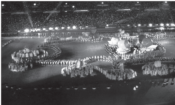
การสื่อสารความหมาย บริบทต่างๆ ในกระบวนการออกแบบ แนวความคิด การรับรู้ของชิ้นงาน ผู้ออกแบบ นักแสดง และผู้ชม ในพิธีเปิดมหกรรมกีฬาเอเชียนเกมส์ ครั้งที่ 13 ปี พ.ศ.2541 ณ กรุงเทพมหานคร

3. เข้าใจวิถีทางของการสร้างสรรค์และการสื่อสาร ความหมาย บริบทต่างๆ ในกระบวนการออกแบบแนว ความคิด การรับรู้ของชิ้นงาน ผู้ออกแบบ นักแสดง และ ผู้ชม