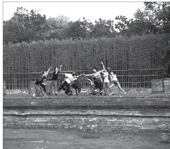
การทดลองเพื่อวางแผนการออกแบบการแสดง ณ พื้นที่จริง ณ วัดอู่ก้าง เวียงกุมกาม อำเภอสารภี จังหวัดเชียงใหม่

Performance) ของศาสตราจารย์ ดร.นราพงษ์ จรัสศรี ใน แง่ของสถาปัตยกรรมการใช้พื้นที่ (Space) ซึ่งการวิเคราะห์ ทางวิชาการนั้นมีความสัมพันธ์กับสังคมและปัจจัยทาง กายภาพ วัฒนธรรม ซึ่งประกอบด้วยสภาพภูมิประเทศ ภูมิอากาศ ลักษณะพื้นผิวดิน ประชากร เพศ การศึกษา ภาษา ศาสนา ระบบการปกครอง ซึ่งใช้ค้นคว้าเพื่อรับรู้และเป็น ประสบการณ์พร้อมก็นำมาบูรณาการทางนาฏศิลป์ในชั้น ตอนการวางแผน ค้นคว้า ออกแบบ ทดลอง ปฏิบัติการแสดง อีกทั้งสัมพันธ์กับพื้นที่ที่นักออกแบบ นักแสดง และผู้ชม การแสดงเผชิญหรือประสบในช่วงเวลาผลิตผลงานทางนาฏศิลป์