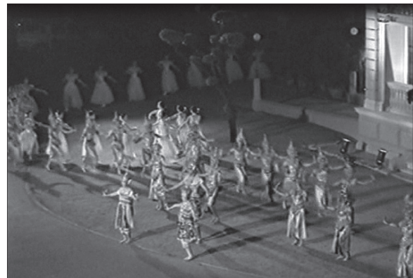
การผสมนาฏยศิลป์ไทยและนาฏยศิลป์ตะวันตก สามารถด้วยความกลมกลืน ในการแสดงแสงเสียงประกอบจินตภาพ “วังลดาวัลย์” (2548) ณ สำนักงานทรัพย์สินส่วนพระมหากษัตริย์ กรุงเทพมหานคร

5. มีความเข้าใจและอธิบายด้วยเหตุผลอย่างมี ชั้นเชิงและซ่อนเงื่อนในความหลากหลายของวัฒนธรรมและ ประวัติศาสตร์และถูกตีความประดิษฐ์เป็นนวัตกรรมของ การเคลื่อนไหวใหม่ที่สร้างสรรค์ในทางนาฏยศิลป์