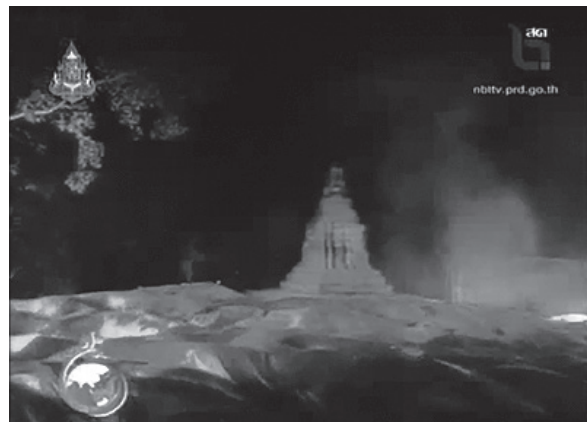
ภาพที่ 1 “เวียงกุมกาม: เมื่อน้ำเอาชนกะษัตริย์ผู้ไม่แพ้ใคร” (2556)