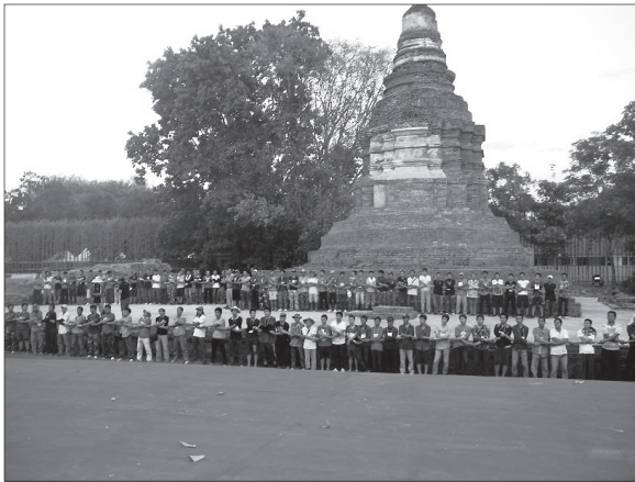
การจัดแถวนักแสดง ณ สถานที่จริง จากการฝึกซ้อมที่วัดอโง้ว เวียงกุมกาม อำเภอสารภี จังหวัดเชียงใหม่

7. มีความสัมพันธ์ระหว่างนาฏศิลป์กับวงการ ทางศิลปะที่ต้องการการฝึกฝนและระเบียบวินัย