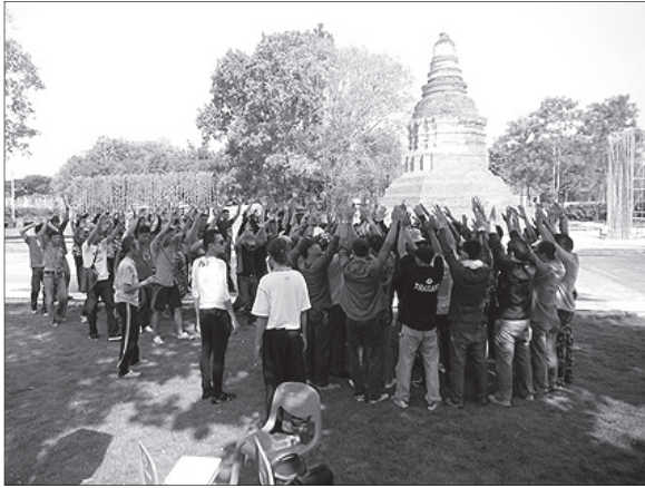
การปฏิบัติการแข่งขัน อ.สารภี จ.เชียงใหม่ เพื่อทำความเข้าใจในกระบวนการและโครงสร้างศิลปะการแสดง ทางนาฏยศิลป์ให้เหมาะสมแก่พื้นที่แสดง ณ วัดอ้อก้าง เวียงกุมกาม อำเภอสารภี จังหวัดเชียงใหม่

2. ลึกซึ้ง เข้าใจในการออกแบบพื้นฐาน กระบวนการและโครงสร้างศิลปะการแสดงทางนาฏยศิลป์ อย่างมีประสิทธิภาพในวิชาชีพ