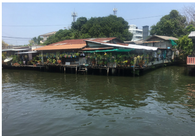
ภาพที่ 2 ชุมชนริมคลองบางหลวงย่านบ้านศิลปิน (2)

ตั้งแต่ปี พ.ศ. 2552 คลองบางหลวงเริ่มเป็นที่รู้จัก กลายเป็นแหล่งท่องเที่ยวที่ได้รับความนิยม โดยพื้นฐานแล้วชุมชนริมคลองบางหลวงเป็นสถานที่สำหรับให้คนในท้องถิ่นที่อาศัยบริเวณริมน้ำใช้เป็นที่พักผ่อนหย่อนใจและนักท่องเที่ยวจากภายนอกชุมชนทั้งชาวไทยและชาวต่างประเทศ ซึ่งเกิดจากในบริเวณชุมชนริมคลองบางหลวง มีสิ่งต่าง ๆ ที่สามารถดึงดูดความสนใจได้ ทำให้มีนักท่องเที่ยวมาเยี่ยมชมเยือนชุมชนคือ บ้านศิลปิน วัดกำแพง และวัดคูหาสวรรค์ ซึ่งเป็นวัดโบราณสมัยกรุงศรีอยุธยา รวมทั้งตลาดน้ำคลองบางหลวง โดยสามารถเดินทางมายังชุมชนได้ทั้งทางรถและทางเรือสะดวกต่อการเดินทาง นอกจากนี้ยังมีสิ่งอำนวยความสะดวกต่าง ๆ ทั้งร้านอาหาร ห้องน้ำสะอาด ร้านขายของที่ระลึก แหล่งแสดงผลงานศิลปะ และมีการแสดงหุ่นละครเล็กที่เป็นรายการเด่นของสถานที่แห่งนี้ (พัชรินภรณ์ โยธาภักดี และชัยสิทธิ์ ด้านกิตติกุล, 2562: 795)