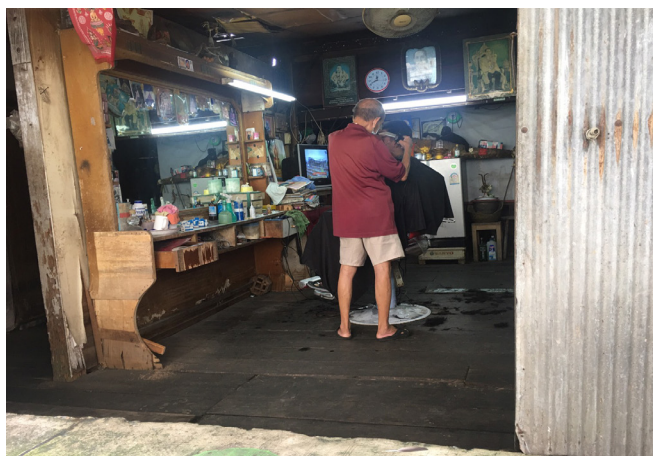
ภาพที่ 5 กิจกรรมในชีวิตประจำวันของผู้สูงอายุในชุมชน (3)

กิจกรรมเพื่อสร้างกระบวนการเรียนรู้อย่างมีส่วนร่วมของชุมชน