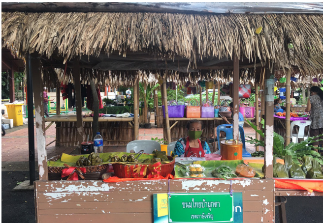
ภาพที่ 4 กิจกรรมในชีวิตประจำวันของผู้สูงอายุในชุมชน (2)