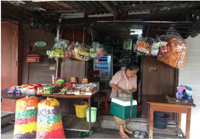
ภาพที่ 3 กิจกรรมในชีวิตประจำวันของผู้สูงอายุในชุมชน (1)