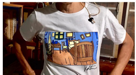
ภาพที่ 6 วาดเสื้อสร้างรายได้