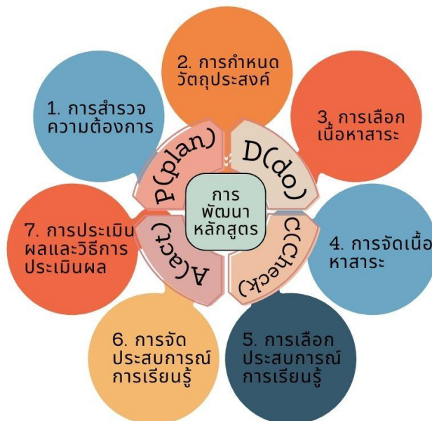
ภาพที่ 2 องค์ความรู้ใหม่

องค์ความรู้ใหม่จากการวิจัยเรื่องการพัฒนาหลักสูตรการเรียนรู้ของโรงเรียนบ้านปางแม่ลอบสังกัดสำนักงานเขตพื้นที่การศึกษาประถมศึกษาลำพูนเขต 1 ตามขั้นตอนการพัฒนาหลักสูตรการเรียนรู้ตามแนวคิด Tabla 7 ขั้นตอน ได้แก่ การสำรวจความต้องการ การกำหนดวัตถุประสงค์ การเลือกเนื้อหาสาระ การจัดเนื้อหาสาระ การเลือกประสบการณ์การเรียนรู้ การจัดประสบการณ์การเรียนรู้ การประเมินผลและวิธีการประเมินผล (วิจัย วงษ์ใหญ่, 2554) ในแต่ละขั้นตอนใช้กระบวนการ PDCA ซึ่งเป็นเครื่องมือที่ใช้เพื่อปรับปรุงกระบวนการทำงานอย่างเป็นระบบ