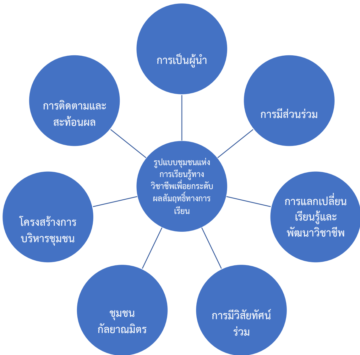
แผนภาพที่ 1 รูปแบบชุมชนแห่งการเรียนรู้ทางวิชาชีพเพื่อยกระดับผลสัมฤทธิ์ทางการเรียนของผู้เรียน

จากภาพที่ 1 สามารถอธิบายได้ว่า การเป็นผู้นำคือผู้บริหารส่งเสริมและพัฒนาภาวะผู้นำทางวิชาการ ภาวะผู้นำการเปลี่ยนแปลง และมีภาวะการเป็นผู้นำในทีม การมีส่วนร่วมคือผู้บริหารและครูร่วมกันสร้างข้อตกลง และแนวปฏิบัติของชุมชนแห่งการเรียนรู้ทางวิชาชีพ ร่วมวิเคราะห์ประเด็นการเรียนรู้ให้ความรู้และแบ่งปันข้อมูล การแลกเปลี่ยนเรียนรู้และพัฒนาวิชาชีพคือการเรียนรู้เพื่อพัฒนาวิชาชีพด้วยบริบทชุมชนแห่งการเรียนรู้โดยมีการพัฒนาความรู้ ความสามารถ และ ความเชี่ยวชาญเฉพาะทาง การมีวิสัยทัศน์ร่วมคือการร่วมกันกำหนดวิสัยทัศน์ พันธกิจ ค่านิยม นโยบาย เป้าหมาย ภาพอนาคตความสำเร็จ ชุมชนกัลยาณมิตร คือ การมีศรัทธาร่วมกันพัฒนา วิชาชีพครูและปฏิบัติตนตาม จรรยาบรรณวิชาชีพ โครงสร้างการบริหารชุมชนคือโครงสร้างที่สนับสนุนการ ก่อให้เกิดและการคงอยู่ของชุมชนแห่งการเรียนรู้ทางวิชาชีพ เน้นรูปแบบที่มงานเป็นหลัก เน้นความคล่องตัวในการ ดำเนินการ การติดตามและสะท้อนผล ประกอบด้วย รวบรวมผลการจัดกิจกรรมการเรียนรู้ ตรวจสอบทบทวนการ ปฏิบัติงานที่มีผลต่อการเรียนรู้ สนทนาแลกเปลี่ยนเรียนรู้ สะท้อนผลการจัดการเรียนรู้ และให้ข้อมูลย้อนกลับ เกี่ยวกับการจัดการเรียนรู้