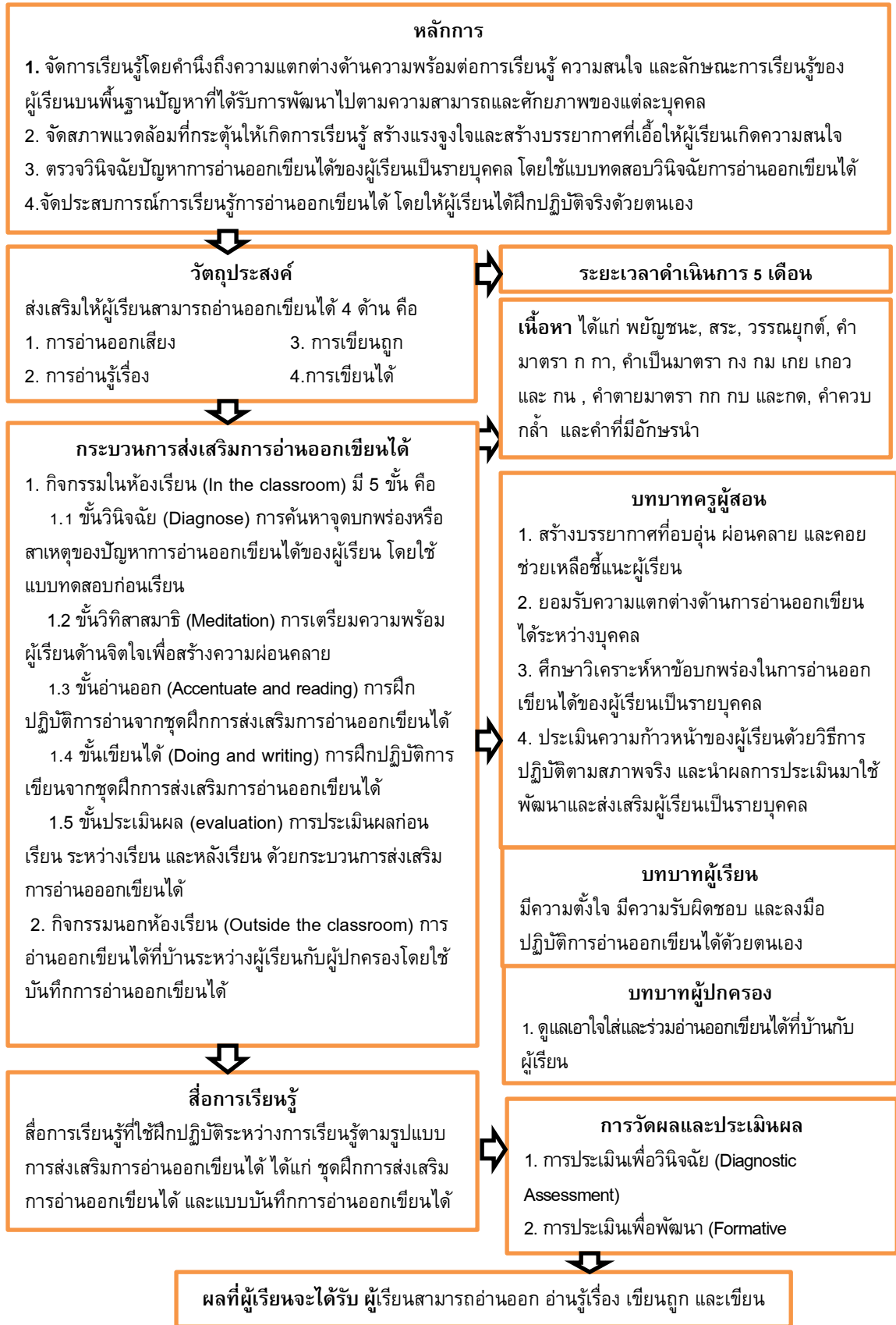
ภาพ 1 รูปแบบการส่งเสริมการอ่านออกเขียนได้ กลุ่มสาระการเรียนรู้ภาษาไทย ระดับชั้นประถมศึกษาปีที่ 1