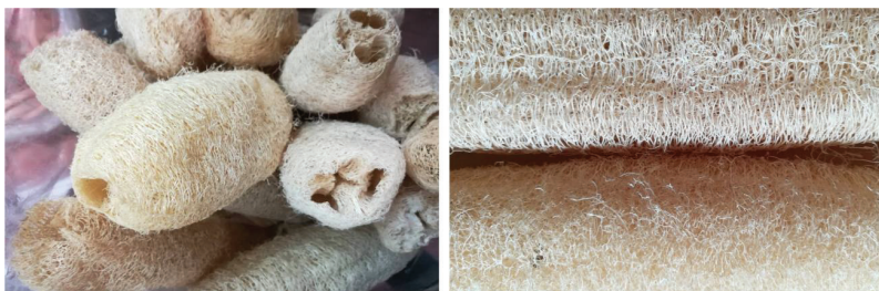
ภาพที่ 1 ไยบวบหอม

จากเหตุผลข้างต้นทำให้เห็นได้ว่าการพัฒนาคอนกรีตบล็อกจากไยบวบหอม สามารถประยุกต์นำไยบวบหอมมาช่วยเพิ่มประโยชน์และประสิทธิภาพของวัสดุประกอบอาคาร หรือใช้ทดแทนวัสดุผสมของคอนกรีตบล็อก พร้อมทั้งสร้างความมั่นคงของผลผลิตต่างๆ ของภาคการเกษตร