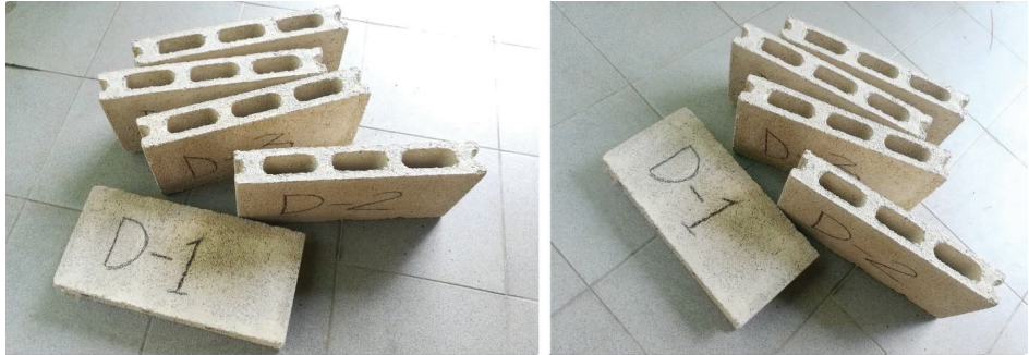
ภาพที่ 5 คอนกรีตบล็อกจากใยบัวหอมรูปทรงมาตรฐาน

การผลิตคอนกรีตบล็อกรูปทรงมาตรฐานด้วยเครื่องอัด ซึ่งผลการผลิตสามารถผลิตขึ้นรูปได้จริงตามมาตรฐานอุตสาหกรรม มอก.58 - 2533 ซึ่งงานวิจัยคอนกรีตบล็อกจากใยบัวหอมทำการผลิตขนาด 70 x 190 x 390 มิลลิเมตร มิติพิทัก 4/5 x 2 x 4 โดยมีผลการผลิตคอนกรีตบล็อกจากใยบัวหอมดังนี้