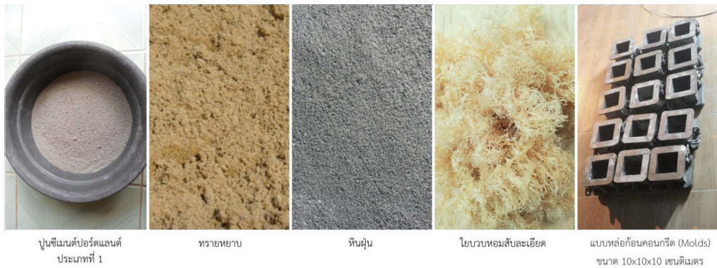
ภาพที่ 2 วัสดุดิบในการผลิตก้อนคอนกรีตบล็อกจากใยบัวหอม

5. สรุปผลการวิจัย โดยทำการวิเคราะห์ผลถึงคุณสมบัติเชิงกายภาพ คุณสมบัติเชิงกล ของคอนกรีตบล็อกจากใยบัวหอม ตามมาตรฐานอุตสาหกรรม (มอก.58 – 2533)