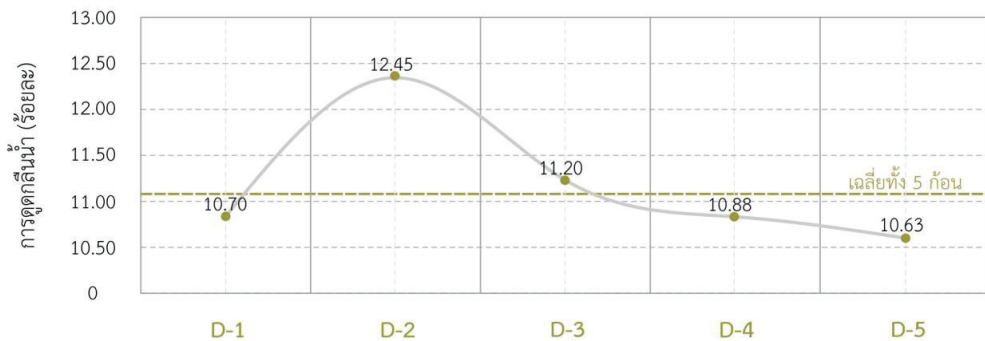
ภาพที่ 6 ผลการทดสอบการดูดกลืนน้ำร้อยละของก้อนคอนกรีตบล็อกจากใยบัวหอม