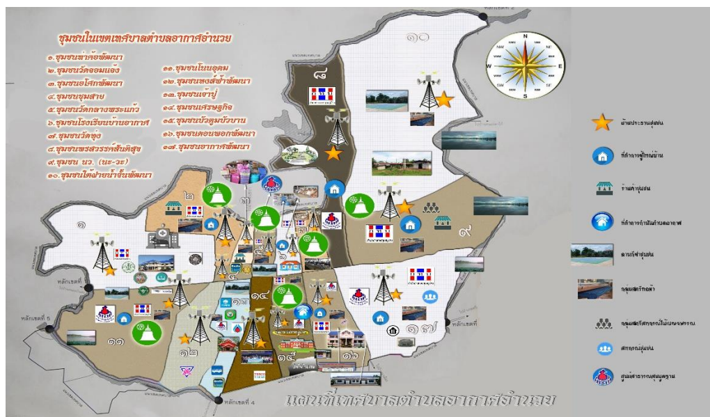
ภาพที่ 1 แผนที่แสดงขอบเขตพื้นที่เทศบาลตำบลอากาศอำนวย

วัฒนธรรมกลองเลง มีบทบาทในวิถีชีวิตและเป็นอัตลักษณ์ชุมชนท้องถิ่นที่ดึงดูดใจของกลุ่มชาติพันธุ์ชาวไทย้อาเภออากาศอำนวย โดยเฉพาะเขตเทศบาลตำบลอากาศอำนวย ซึ่งเป็นพื้นที่รวมศูนย์ศิลปวัฒนธรรมของชุมชนท้องถิ่นในอำเภออากาศอำนวย เขตการปกครองท้องที่ครอบคลุม 17 ชุมชน สะท้อนผ่านประเพณีพิธีกรรมฮีตสิบสองครองสิบสี่และกิจกรรมการจัดแสดงมาอย่างช้านาน ขณะเดียวกันในระบบโรงเรียนหรือสถาบันการศึกษายังให้ความสำคัญ “กลองเลง” ฐานะเป็นเครื่องดนตรีหนึ่ง ที่เป็นทุนทางวัฒนธรรมถูกนำมาพัฒนาเป็นหลักสูตรท้องถิ่นสอดแทรกเนื้อหาในแต่ละรายวิชา ของครูผู้สอน เพื่อให้นักเรียนได้เรียนรู้รากเหง้าทางวัฒนธรรมบรรพบุรุษของตัวเอง ทั้งในฐานะดนตรี พิธีกรรมและงานรื่นเริงจากอดีตสู่ปัจจุบัน ตลอดจนทั้งความต้องการพัฒนาแนวทางเพื่อการพัฒนาต่อยอด รูปแบบนวัตกรรมทางสังคมเชิงพื้นที่สร้างกระบวนการเรียนรู้อย่างเป็นรูปธรรมที่ยั่งยืนของชุมชนท้องถิ่นต่อไป