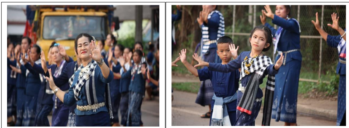
ภาพที่ 8-9 การสืบทอดทำราระหว่างรุ่นต่อรุ่น

แนวทางการพัฒนาจากประเด็นทั้งหมดอาจมีส่วนช่วยในการพัฒนาศักยภาพด้านการจัดการท่องเที่ยวโดยชุมชน ต่อยอดในมิติต่าง ๆ เพื่อพัฒนาเศรษฐกิจรากฐานของชุมชนได้ เช่น แหล่งเรียนรู้ทางวัฒนธรรม การบริการเส้นทางการท่องเที่ยวทางวัฒนธรรมและทรัพยากรธรรมชาติและสิ่งแวดล้อมที่น่า สนใจ การบริการที่พัก เป็นต้น