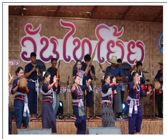
ภาพที่ 4-5 กิจกรรมงานวันไทย้อย วันที่ 9 พฤษภาคม 2562