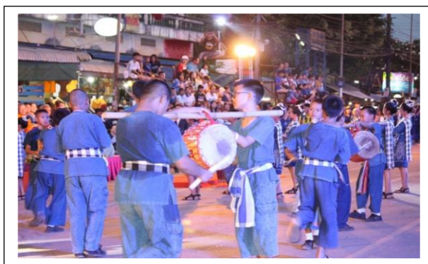
ภาพที่ 2-3 ลักษณะการหามและตีกลองเลง วันที่ 9 พฤษภาคม 2562