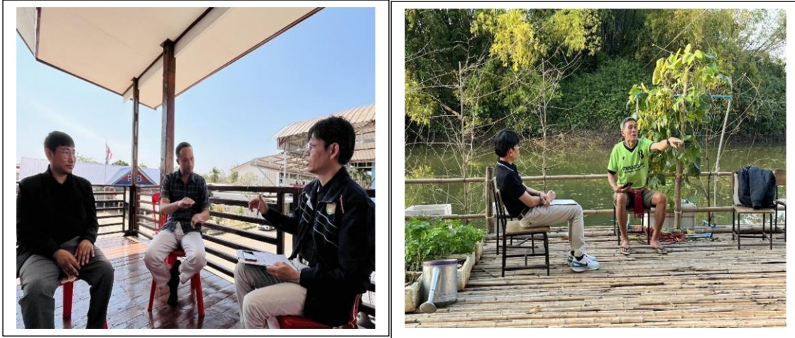
ภาพที่ 6-7 การลงพื้นที่สัมภาษณ์ภาคสนาม วันที่ 21 มกราคม 2569