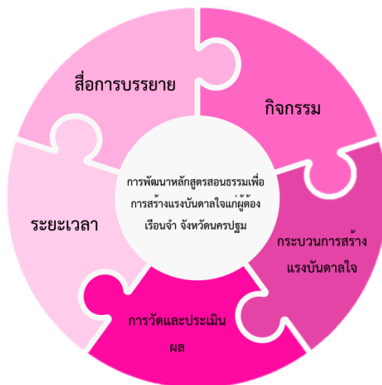
แผนภาพที่ ๒ แนวทางการพัฒนาหลักสูตรการสอนธรรมเพื่อสร้างแรงบันดาลใจแก่ผู้ต้องขังเรือนจำ จังหวัดนครปฐม

3.การพัฒนาวิทยากรสอนธรรมเพื่อสร้างแรงบันดาลใจของผู้ต้องขังในเรือนจำจังหวัดนครปฐมพบว่า วิทยากรสอนธรรมจะต้องมีลักษณะโดยแบ่งเป็นประเด็นต่าง ๆ คือ 1) หลักแนวคิดวิทยากรสอนธรรมการเป็นวิทยากรจึงต้องมีหลักของความรู้ หลักของบุคลิกภาพ หลักกระบวนการคิด สร้างสรรค์ คิด