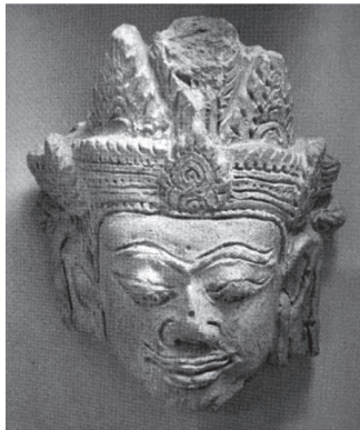
ภาพที่ 9 เศียรดินเผาศิลปะหริภุญชัย ในพิพิธภัณฑสถานเชียงใหม่และลำพูน

ศิลปะหริภุญชัย (พุทธศตวรรษที่ 17-18) ดังที่นักวิชาการได้ตั้งประเด็นปัญหามาก่อนแล้วว่า พระพุทธรูปทรงเครื่องในศิลปะหริภุญชัยอาจเกี่ยวข้องกับศิลปะพุกามหรือศิลปะขอมสมัยบายัน (เชษฐ ติงส์ญชลี, 2558, หน้า 178) ซึ่งพบพระพุทธรูปและเศียรดินเผาอยู่ 2 กลุ่มที่มีลักษณะแตกต่างกันอย่างชัดเจน กลุ่มแรกพระพุทธรูปทรงเครื่องที่วัดท่ากาน จ.เชียงใหม่ ทรงเทริดชนกเป็นตาบขนาดเล็กจำนวนมากกว่า 5 แผ่น มีสันตรงกลาง ไล่ขนาดจากใหญ่ไปเล็ก มีระบบตาบแทรก และไม่มีกรงช้อนที่กะบังหน้า ปลายกุดทลงอนตัววัดขึ้นที่พระอังสา ใกล้เคียงกับศิลปะขอมสมัยบายัน แต่ทว่าสร้อยคอมีลักษณะเป็นพื้นเมือง ส่วนกลุ่มที่สอง มีประติมากรรมที่สำคัญ คือ เศียรดินเผาในพิพิธภัณฑสถานเชียงใหม่และลำพูน มีการช้อนกระบังหน้าประดับตาบสามเหลี่ยมบนเทริดชนกที่มีแผ่นตาบจำนวน 5 แผ่น ใช้กรงช้อนแบบ “3 แผ่นหน้า 2 แผ่นหลัง” คล้ายกับศิลปะพุกาม ดังนั้นจึงสันนิษฐานได้ว่า พระพุทธรูปทรงเครื่องในศิลปะ หริภุญชัย เกี่ยวข้องทั้งศิลปะบายันและศิลปะพุกาม