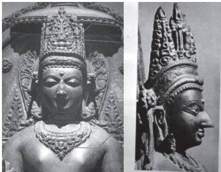
ภาพที่ 4 พระพุทธรูปทรงเครื่องศิลปะปาละ

ประเทศอินเดีย สืบมาจากสมัยราชวงศ์คุปตะ (พุทธศตวรรษที่ 9-13) เป็นสมัยที่อารยธรรมอินเดียเจริญถึงขีดสุดในทุกด้าน (เชษฐ ติงส์ญชลี, 2558, หน้า 154) ต่อมาในศิลปะกัศมีร์ (พุทธศตวรรษที่ 13-15) ซึ่งเป็นศิลปะอินเดียสกุลแรกที่ปรากฏการทรงมงกุฎให้กับพระพุทธรูป ทั้งสองมียุทธิพลต่อการสร้างพระพุทธรูปทรงเครื่องในสมัยปาละตอนปลายราวพุทธศตวรรษที่ 17-18 ซึ่งเป็นลักษณะสำคัญของศิลปะปาละตอนปลาย เนื่องจากไม่พบการทรงเครื่องของพระพุทธรูปมาก่อนในศิลปะปาละตอนต้นและตอนกลาง พระพุทธรูปทรงเครื่องแบบปาละนี้เป็นต้นแบบที่มีอิทธิพลต่อพระพุทธรูปทรงเครื่องในศิลปะแบบอื่นเป็นอย่างมาก ในบทความนี้ส่วนใหญ่จึงใช้ลักษณะเครื่องทรงของปาละเปรียบเทียบกับเครื่องทรงของศิลปะอื่น ๆ