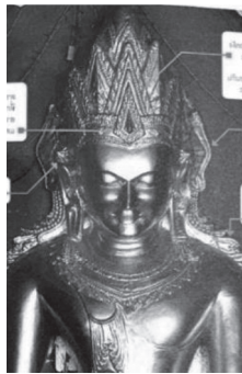
ภาพที่ 5 พระพุทธรูปทรงเครื่องศิลปะพุกาม

3) แนวความคิดเรื่องพระอาทิตย์ พุทธเจ้าที่พบในคติความเชื่อของพุทธศาสนามหายานบางกลุ่ม โดยเชื่อว่าอาทิตย์เป็นพระพุทธรูปองค์แรกกำเนิดขึ้นพร้อมกับโลก อยู่ในโลกช่วงนิรันดร์ เป็นพระผู้สร้างสรรพสิ่งในโลกและเป็นแหล่งกำเนิดของพระพุทธรูปเจ้าทั้งหลาย พระอาทิตย์จะแสดงเป็นพระพุทธรูปทรงเครื่องซึ่งมีเครื่องทรงอย่างพระโพธิสัตว์ หรือเครื่องอาภรณ์อย่างกษัตริย์