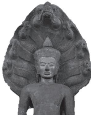
ภาพที่ 6 พระพุทธรูปทรงเครื่องศิลปะนครวัด

คติการสร้างในศิลปะพุกาม ได้แก่ 1) คติเรื่องพระชมพูบดี หมายถึง “พระพุทธรูปเจ้าทรงثمانพระมหาชมพู” ที่ปรากฏอยู่ในมหาชมพูบดีสูตรว่า พระมหาชมพู เป็นพระมหากษัตริย์ที่มีบุญญาธิการและมีอุทยานาภามาก ไม่ยอมรับ นับถือพุทธศาสนา พระพุทธรูปเจ้าจึงเนรมิตพระองค์เป็นอย่างพระมหาจักรพรรดิ ทรงแสดงธรรมโปรดจนพระมหาชมพูลดทิฐิมานะ หันมายอมรับนับถือพระพุทธ ศาสนา 2) คติเรื่องจักรวาทิน 3) คติเรื่องพระศรีอาริยมตไตรย (พระอนาคตพุทธ) มีการสร้างงานศิลปกรรมพระศรีอาริยมตไตรยเป็นรูปบุคคล โดยพระองค์จะมี 2 หรือ 4 พระกร มักจะทรงเครื่องแบบกษัตริย์ แต่บางครั้งก็แสดงเป็นเหมือนนักบวช เปล้าผมเป็นชฎามงกุฏและหุ้มหนังกาง