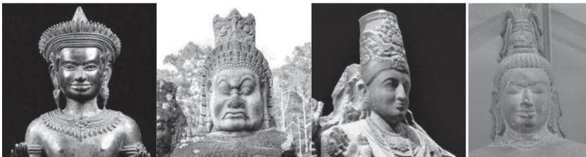
ภาพที่ 1 ศิราภรณ์เทวดา ศิราภรณ์อสูร กิริฎมงกุฎ ชฎามงกุฎ ตามลำดับ

ในอดีตสันนิษฐานว่า ผู้คนต่างไฝ่หมยวเนื่องจากการตัดผมถือเป็นเรื่อง ยากลำบาก หากไม่ผูก มัดเกล้าให้เป็นระเบียบเรียบร้อยก็จะรกรุงรัง ทว่าการเก็บ ผมขึ้นไปแบบปกติจะดูไม่สวย ไม่โดดเด่นกว่าคนอื่น ๆ จึงคิดค้นหาสิ่งของมา ประดับตกแต่งศีรษะและร่างกาย เครื่องประดับจึงแบ่งเป็น 2 ประเภท คือ ศิราภรณ์ (เครื่องประดับศีรษะ) และถนิมพิมพาภรณ์ (เครื่องประดับกาย) เครื่องประดับเหล่านี้ นอกจากใช้ประดับเพื่อความสวยงามแล้ว ยังเป็นการบ่งบอกถึงบุคลิกของผู้สวมใส่ รวมไปถึงจนถึงสถานภาพทางสังคม ฐานะ และความเชื่อในศาสนาอีกด้วย