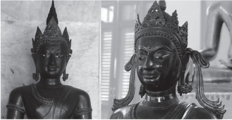
ภาพที่ 10 พระพุทธรูปทรงเครื่องศิลปะล้านนาทั้ง 2 องค์

ศิลปะล้านนา (พุทธศตวรรษที่ 21) ได้มีการค้นพบพระพุทธรูปทรงเทริด ชนนิกจำนวน 2 องค์ ศักดิ์ชัย สายสิงห์ (2554, หน้า 91) ได้กล่าวไว้ใน พระพุทธรูป รูปสำคัญและพุทธศิลป์ในดินแดนไทย ความว่า