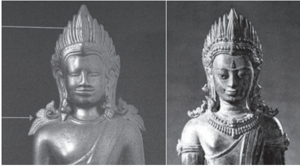
ภาพที่ 7 พระพุทธรูปทรงเครื่องศิลปะขอม

ศิลปะนครวัด ที่พบจำนวนมากที่สุด คือ พระพุทธรูปทรงเครื่องนาคปรก อารมณ์มักประกอบด้วยกระบังหน้าประดับไปด้วยแถบลายกระจังขนาดเล็กเท่ากัน เหลื่อมซ้อนกันจำนวนมาก รัตเกล้ารูปกรวยสูงสวมอยู่เหนือพระเกศาถักถูกนำมาใช้แทนอนุษณีษะของพระพุทธรเจ้า และทรงกมลแหลมแบบขอม