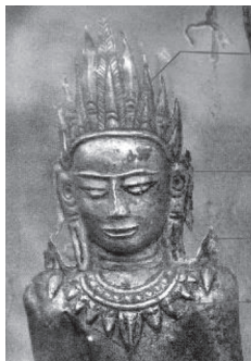
ภาพที่ 8 พระพุทธรูปทรงเครื่องศิลปะหริภุญชัย ที่วัดท่ากาน จ.เชียงใหม่

ประเทศไทย พระพุทธรูปทรงเครื่องพบอยู่ในศิลปะหลายแบบ ได้แก่ ศิลปะหริภุญชัย ศิลปะศรีวิชัย ศิลปะลพบุรีและศิลปะล้านนา