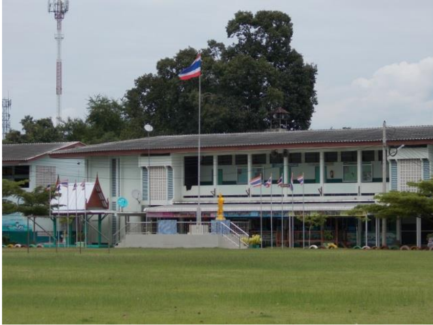
ภาพประกอบ ๕ โรงเรียนชุมชนวัดเสด็จ (คุณ ศรีประเสริฐอุบลัมภ์)