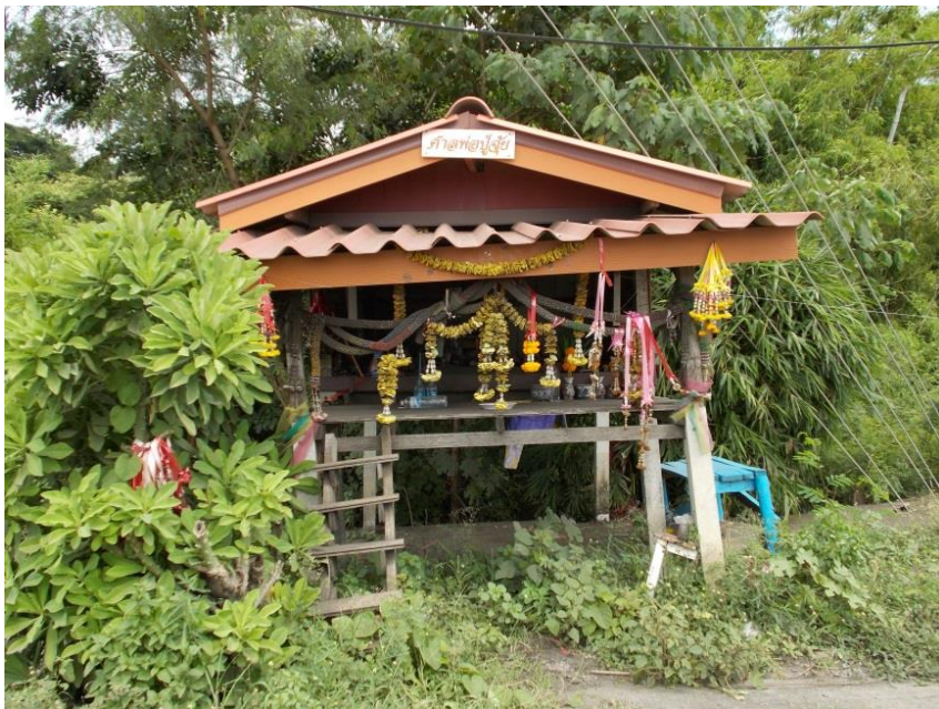
ภาพประกอบ ๖ ศาลพ่อปู่จู้ย

บริเวณหมู่ ๔ ตำบลคลองสะแก เป็นที่ตั้งของศาลพ่อปู่จู้ย ที่ชาวคลองสะแกนับถือมาตั้งแต่สมัยโบราณ เวลาจะมีงานมงคล เช่น งานแต่งงาน งานบวช ก็ต้องไปบนบานท่านให้การจัดงานเป็นไปอย่างราบรื่น ชาวชุมชนสามารถบนบานท่านได้ทุกอย่าง ไม่ว่าจะขอให้หายเจ็บไข้ ขอให้บุตรหลานสอบได้ที่เรียน เมื่อสมความปรารถนาแล้วนำพวงมาลัย ดอกไม้สด น้ำแดง และไข่ต้มมาแก้บนท่าน (ทองสุก ชัยมานิตย์, ๒๕๖๑, ๒๒ ธันวาคม)