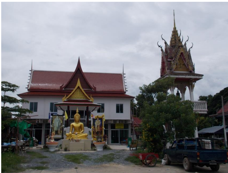
ภาพประกอบ ๔ วัดเสด็จ

ตั้งอยู่ในหมู่ที่ ๕ ตำบลคลองสะแก เมื่อ ๖๐ ปีก่อน วัดเสด็จเป็นฐานอิฐเก่าๆและเป็นวัดร้าง ต่อมาภายหลัง หลวงตาเหรียญ มาเป็นผู้บุกเบิกวัดเสด็จ ปัจจุบันมีโรงเรียนชุมชนวัดเสด็จ (คุณ ศรีประเสริฐอุปถัมภ์) เริ่มก่อตั้งเมื่อวันที่ ๔ พฤษภาคม ๒๕๒๐ เป็นโรงเรียนประชาบาล โดยเจ้าอาวาสอนุญาตให้ใช้ศาลาการเปรียญวัดเสด็จเป็นสถานที่เรียนชั่วคราว ระยะเวลาแรกเปิดสอนถึงระดับชั้นประถมศึกษาปีที่ ๔ โดยยืมครูจากโรงเรียนต่างๆในอำเภอนครหลวงมาช่วยสอน ปัจจุบันโรงเรียนขยายตัวขึ้นมาก เปิดสอนตั้งแต่ระดับชั้นอนุบาลถึงระดับชั้นมัธยมศึกษาตอนต้น (สนิท สะแกคุ่ม, ๒๕๖๑, ๒๒ ธันวาคม)