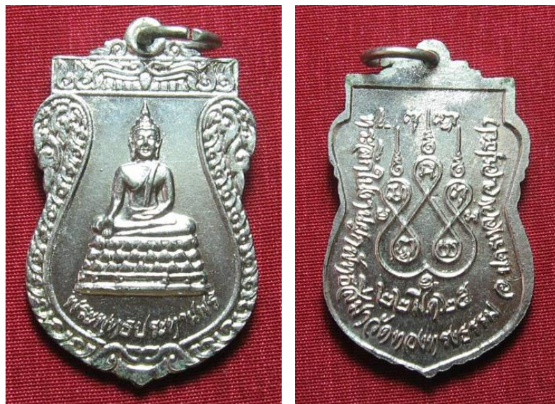
ภาพประกอบ ๒ เหรียญพระพุทธรูประทานพร ที่ระลึกในงานผูกพัทธสีมา วัดทองทรงธรรม ๒๕๒๕