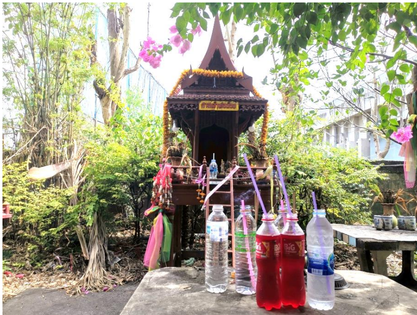
ภาพประกอบ ๗ ศาลเจ้าพ่อน้อย

บริเวณหมู่ ๑ ตำบลคลองสะแก เป็นที่ตั้งของศาลเจ้าพ่อน้อย ที่มีชื่อเสียงในเรื่องการบนบานขอให้รอดพ้นจากการเกณฑ์ทหาร สมัยก่อนเด็กหนุ่มที่ไม่ต้องการเป็นทหาร จะเข้าไปสวดมนต์ นั่งสมาธิ แล้วปูเสื่อนอนค้างกันที่บริเวณศาลของท่าน พอถึงรุ่งเช้าก็พากันเดินไปยังอำเภอนครหลวง ออกเดินเจ็ดโมง ไปถึงสี่โมง ใช้เวลาราว ๓ ชั่วโมง ส่วนของแก้บนคือกล้วย ๑ กะพ้อม หรืออาจแก้บนด้วยการจ้างกลองยาวไปเล่นตรงศาลท่าน ในปัจจุบันศาลเจ้าพ่อน้อยอยู่ในที่ดินของโรงงานผลิตแร่ ซึ่งล้อมรั้วไว้ โดยชาวบ้านสามารถขออนุญาตจากฝ่ายรักษาความปลอดภัยของโรงงานเพื่อเข้าไปกราบไหว้ได้ แต่ไม่อนุญาตให้นำกลองยาวมาแสดงและไม่อนุญาตให้ค้างคืน (วันเพ็ญ สะแกคุ่ม, ๒๕๖๑, ๒๒ ธันวาคม)