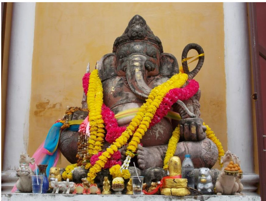
ภาพประกอบ ๙ พระพิฆเนศปางกู่กรุง ปราสาทนครหลวง