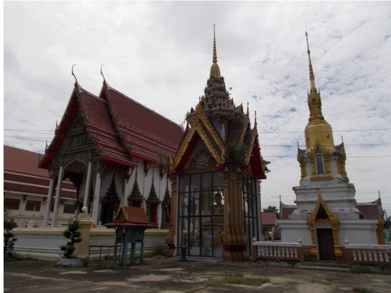
ภาพประกอบ ๑ วัดทองทรงธรรม