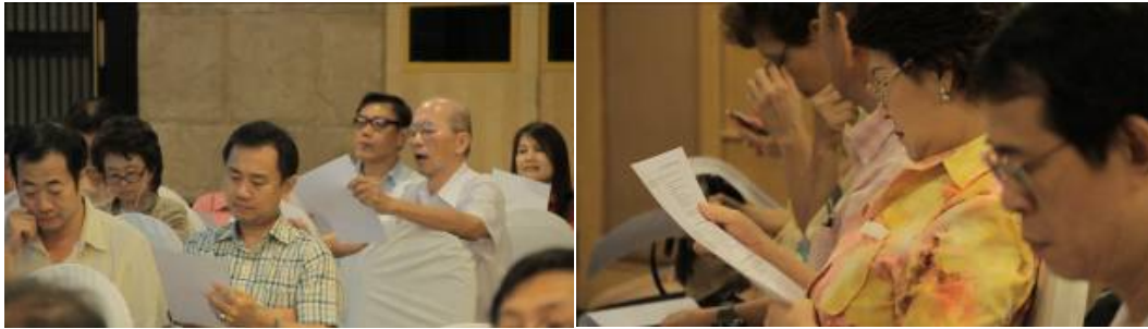
รูปที่ 5 ภาพแสดงการพิจารณาเอกสารแสดงแนวคิดข้อดี-ข้อเสีย แนวคิดการพัฒนาพื้นที่ ชุมชนทั้ง 3 แนวคิดของผู้เข้าร่วมประชุม