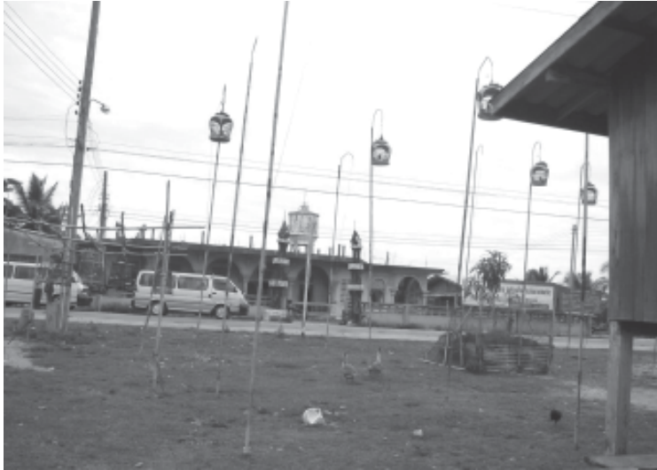
รูปที่ 2 ถนนประลองเสียงชั้นของนกเขาชาที่บางปลาหมอ จังหวัดปทุมธานี