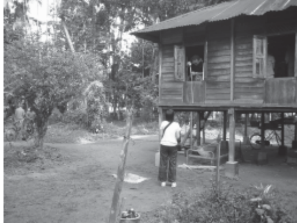
รูปที่ 5 พื้นทรายอัดแน่นโดยรอบบริเวณบ้านที่น้ำผิวดินซึมผ่านได้สะดวก

ในการอยู่อาศัย [11] ซึ่งล้วนแล้วแต่สอดคล้องกับหลักของการอยู่อาศัยแบบเคารพต่อธรรมชาติ อิทธิพลของวัฒนธรรมเหล่านี้จึงเป็นเหตุผลที่ทำให้ผู้ต้องการปลูกสร้างเรือนจะหักร้างทางพงเป็นบริเวณจำกัดแต่พอเพียง (รูปที่ 4) โดยตัดต้นไม้เท่าที่จำเป็น รักษาต้นไม้ใหญ่ในพื้นที่เอาไว้ สร้างเรือนในที่สูงที่เป็นโคกหรือเนิน และหลีกเลี่ยงการสร้างเรือนคร่อมทางน้ำ แต่จากการสำรวจพบว่า ในปัจจุบันความเชื่อเหล่านี้ โดยเฉพาะในด้านการวางผังบริเวณตัวเรือนและในระดับหมู่บ้านได้ลดน้อยลง ไม่มีใครยึดถือ เนื่องจากสภาพแวดล้อมและวิถีการดำเนินชีวิตที่เปลี่ยนแปลงไป ผู้คนมุ่งเน้นการพัฒนาสภาพที่อยู่อาศัยให้ดีขึ้นตามหลักสมัยใหม่โดยหน้าบ้านจะหันหน้าไปยังถนนที่ตัดผ่านเป็นหลัก