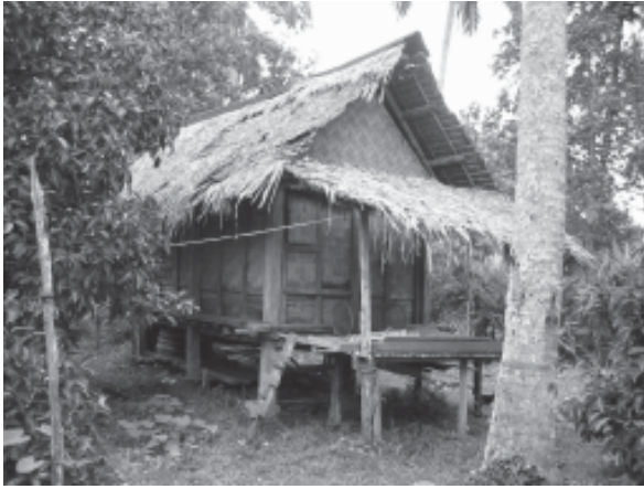
รูปที่ 9 เรือนเก็บข้าวเปลือก