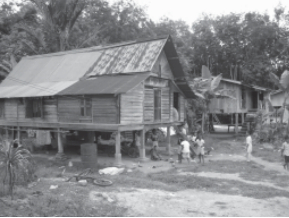
รูปที่ 7 พื้นที่เปิดโล่งระหว่างเรือน ปรากฏจากรั้วกัน ในเรือนหลังหนึ่ง จังหวัดสตูล