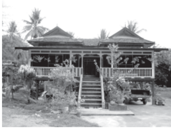
รูปที่ 8 การประดับไม้กระถางบริเวณทางขึ้นเรือน ในเรือนหลังหนึ่ง ตำบลท่าสาป อำเภอเมือง จังหวัดยะลา