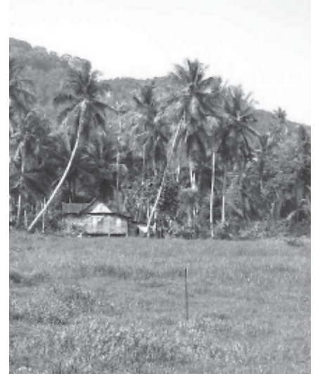
รูปที่ 3 บ้านจะแทรกไปกับกลุ่มไม้ใหญ่เพื่อความร่มรื่น

เข้ามาในแผ่นดิน ส่วนใหญ่มักจะประกอบกิจกรรมทางการเกษตรมากกว่าหนึ่งชนิด เช่น ทำนาพร้อม ๆ กับทำสวนยางหรือทำนาควบคู่ไปกับสวนผสม โดยจะทำสวนยางหรือสวนผสมในพื้นที่สูง ลักษณะการทำเกษตรแบบผสมผสานนี้ช่วยให้ชาวบ้านสามารถดำรงชีวิตอยู่ได้โดยไม่ต้องพึ่งพาระบบการตลาดภายนอกมากนัก [8] ลักษณะการเกิด 'หมู่บ้าน' ของชาวมุสลิม หรือที่เรียกว่า 'kampong' ในภาษามลายูนั้น จะเริ่มจากเรือนหนึ่งหลังแล้วจึงขยายเพิ่มเติมจนกลายเป็นกลุ่มบ้านเรือนและหมู่บ้านตามลำดับ [9] จากการสำรวจพบว่า กลุ่มบ้านเรือนที่อยู่ใกล้กันมักจะเป็นเครือญาติกัน และทุกหมู่บ้านจะมีมัสยิดหรือสุเหร่าเป็นจุดศูนย์กลาง โดยมี 'ปอเนาะ' (โรงเรียนสอนศาสนาอิสลาม) 'กูโบร์' (สุสาน) สถานที่ราชการ ตลาด ออเนาะ ตั้งอยู่ในบริเวณใกล้เคียงกัน [10] นอกจากนี้ การสำรวจพื้นที่ศึกษาในสี่จังหวัดชายแดนภาคใต้พบว่า หมู่บ้านชาวไทย-มุสลิมจะมีพื้นที่เปิดโล่งระหว่างกลุ่มบ้านเรือนสำหรับการประลองเสียงชั้นของนกเขาชาอันเป็นกิจกรรมสำคัญของคนในชุมชน โดยสังเกตได้ว่าบริเวณนั้นจะมีเสาสูงประมาณสี่เมตรปักไว้เป็นกลุ่มเพื่อแขวนกรงนก (รูปที่ 2) เมื่อพิจารณาการเชื่อมโยงพื้นที่แต่ละส่วนภายในหมู่บ้านพบว่า จะมีเส้นทางเดินขนาดเล็กที่เป็นทั้งผิวคอนกรีตและผิวดินธรรมดาเชื่อมต่อเป็นโครงข่ายลัดเลาะไปตลอดทั้งหมู่บ้าน บางครั้งเส้นทางเดินเหล่านี้จะไม่สามารถเห็นได้ชัดเจน เนื่องจากผสมผสานเข้ากับที่ว่างโดยรอบของเรือนบางหลังแทน