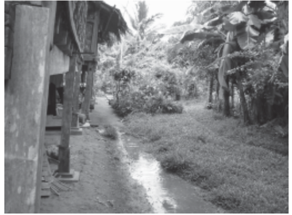
รูปที่ 10 ร่องระบายน้ำบริเวณข้างตัวเรือน

ทั้งปีและเผชิญลมมรสุมอยู่บ่อยครั้ง เพื่อสามารถระบายน้ำออกจากบริเวณตัวเรือนให้เร็วที่สุด