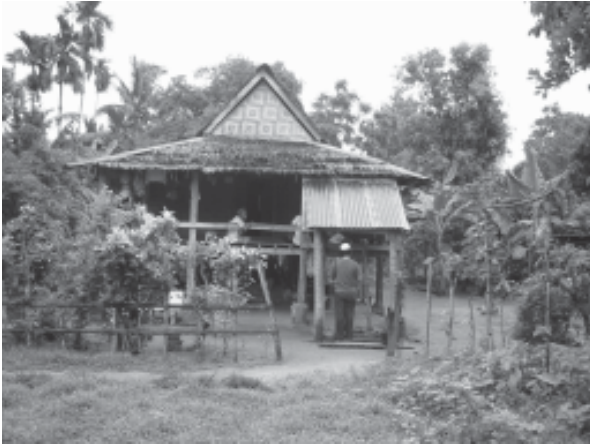
รูปที่ 4 การปลูกสร้างบ้านเรือนจะหักร้างทางพงเท่าที่จำเป็น