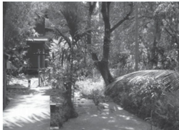
รูปที่ 6 สภาพพื้นที่ร่องสวนผลไม้ที่ยังมีการทำเกษตรแบบผสมผสาน