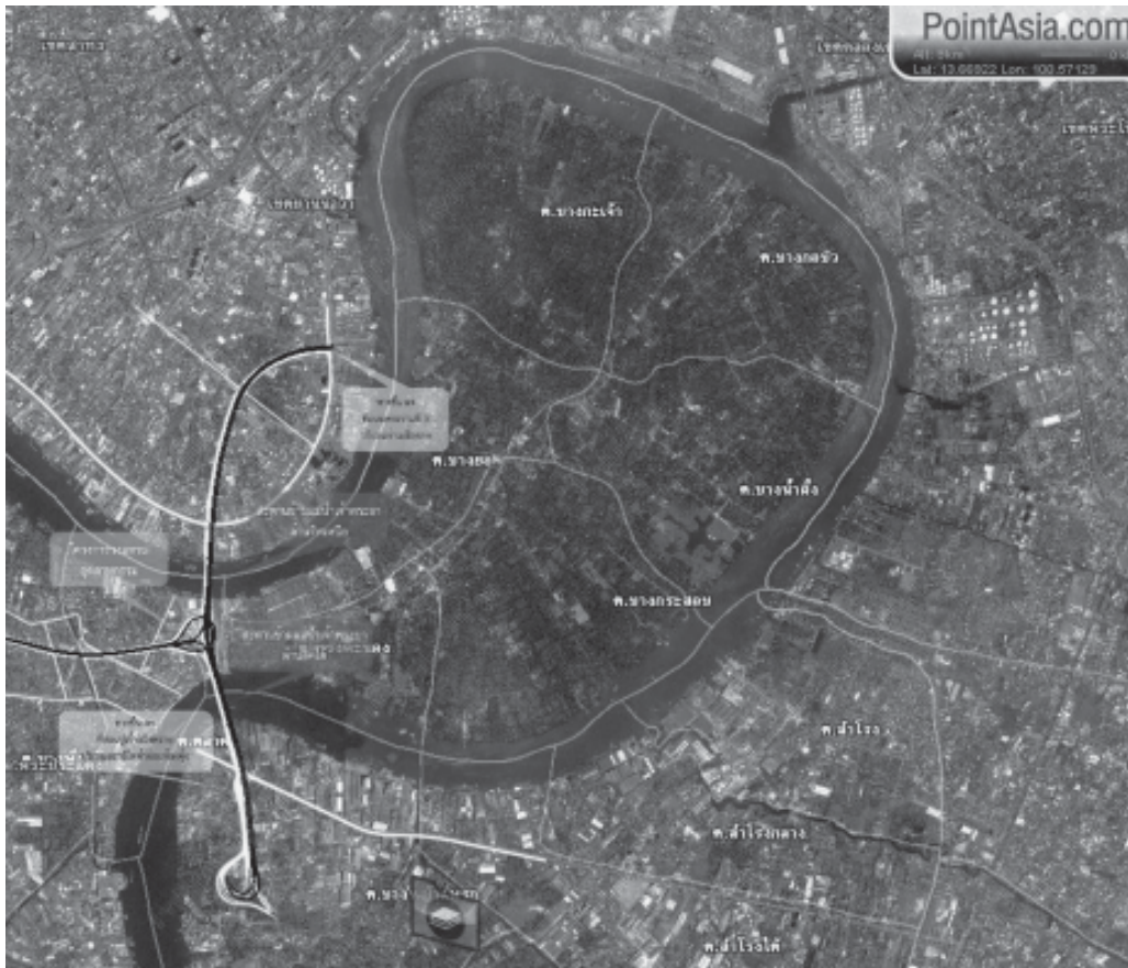
รูปที่ 4 พื้นที่บางกะเจ้า พ.ศ. 2549

ชุมชนบริเวณบางกะเจ้า ดังแสดงตามรูปที่ 4 เป็นสังคมแบบผสมของกลุ่มอาชีพเกษตรกร รับจ้าง ค้าขาย และรับราชการ เป็นสังคมที่มีวิวัฒนาการมาตั้งแต่สมัยรัตนโกสินทร์ตอนต้น เป็นชุมชนมอญเก่า ซึ่งเริ่มอพยพเข้ามาเมื่อ พ.ศ. 2357 ขนบธรรมเนียมและวัฒนธรรมของชาวมอญยังคงรักษาเอาไว้ ประเพณีงานเทศกาลที่สำคัญ ๆ ซึ่งยังดึงดูด