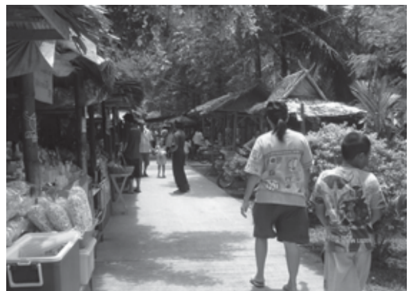
รูปที่ 7 กิจกรรมการท่องเที่ยวภายในพื้นที่ร่องสวนผลไม้ บางกะเจ้า