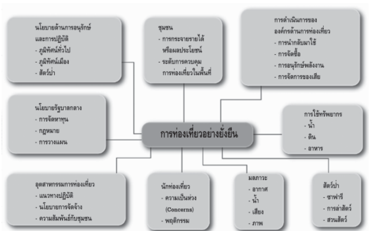
รูปที่ 3 แผนภูมิแสดงประเด็นที่เกี่ยวข้องกับการท่องเที่ยวอย่างยั่งยืน [5]

ความสามารถในการรองรับ (carrying capacity) จึงกลายเป็นประเด็นสำหรับการพิจารณาศักยภาพของแหล่ง