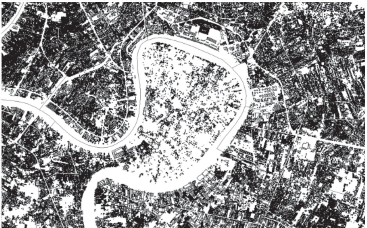
รูปที่ 2 Figure-ground โดยรอบพื้นที่บางกะเจ้า แสดงที่ว่างที่เป็นพื้นที่สีเขียวเกษตรกรรม

ในปีปัจจุบัน (พ.ศ. 2549) พบว่า การเข้าไปใช้งานสวนกลางมหานครนั้นกลับเป็นเพียงในระดับของชุมชนเท่านั้น จำนวนผู้เข้ามาใช้พื้นที่มีน้อยมาก จากสถิติมีผู้ใช้