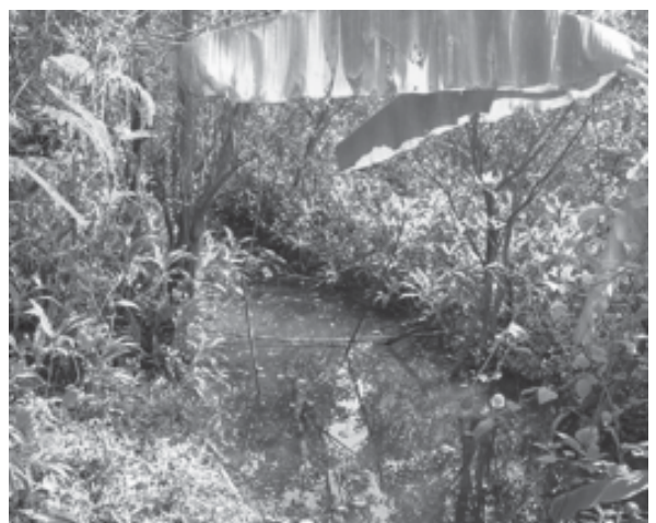
รูปที่ 5 สภาพพื้นที่ร่องสวนผลไม้เดิมที่ถูกปล่อยให้รกร้าง ไม่มีกิจกรรมการเกษตร