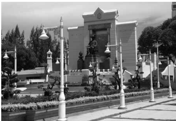
รูปที่ 28 พระปฐมบรมราชานุสรณ์ พระบาทสมเด็จพระพุทธยอด ฟ้าจุฬาโลกมหาราช

เอกลักษณ์สถาปัตยกรรมไทยสมัยใหม่ จึงต้อง ‘คิดใหม่ ทำใหม่’ ด้วยหลักบูรณาการปัจจัยต่าง ๆ เพื่อหาคำตอบ แนวรูปแบบที่เหมาะสมกับสังคมปัจจุบัน และเพื่อเป็นการ สร้างมรดกทางวัฒนธรรมอีกด้วย ซึ่งในอดีตที่ผ่านมา สมเด็จพระเจ้าฟ้ากรมพระยานริศรานุวัดติวงศ์ก็ได้ริเริ่มการ สร้างสรรค์สถาปัตยกรรมไทยสมัยใหม่ที่จัดเป็นมรดกทาง วัฒนธรรมในงานออกแบบพระปฐมบรมราชานุสรณ์ พระบาทสมเด็จพระพุทธยอดฟ้าจุฬาโลกมหาราช ที่มี ลักษณะเรียบง่ายและงดงามด้วยด้านภูมิปัญญาสร้างสรรค์ (รูปที่ 28)