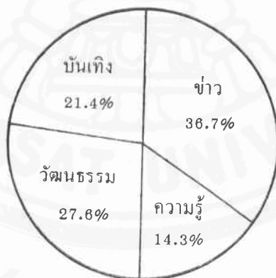
แผนภูมิที่ 1 สัดส่วนของรายการของสถานี เอ็นเอชเค บริการทั่วไป