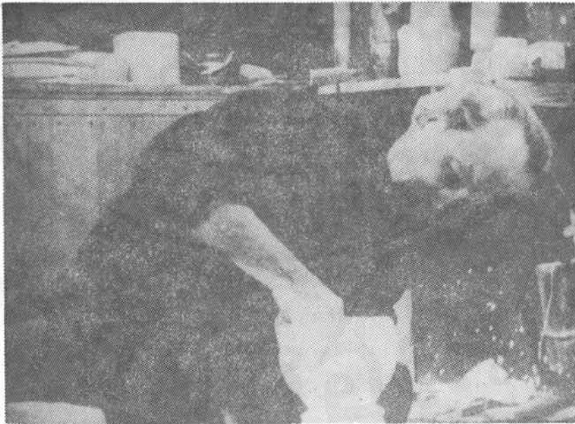
รายการสารคดี แนะนำศิลปินช่างปั้น ซึ่ง NHK ผลิตขึ้น