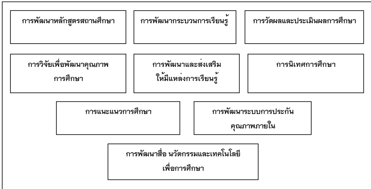
ภาพที่ 2 รูปแบบการบริหารงานวิชาการที่มีประสิทธิผลของโรงเรียนประถมศึกษาในจังหวัดนนทบุรี สังกัดสำนักงานคณะกรรมการการศึกษาขั้นพื้นฐาน