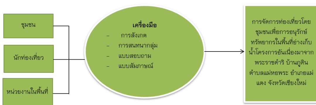
ภาพที่ 1 กรอบแนวคิดการวิจัย

งานวิจัยนี้ เป็นการวิจัยเชิงผสมผสาน ผู้วิจัยกำหนดกรอบแนวคิดการวิจัยตามแนวคิด/ทฤษฎีการท่องเที่ยงโดยชุมชนและกระบวนการวิจัยเชิงปฏิบัติการอย่างมีส่วนร่วม โดยมีรายละเอียดดังภาพที่ 1