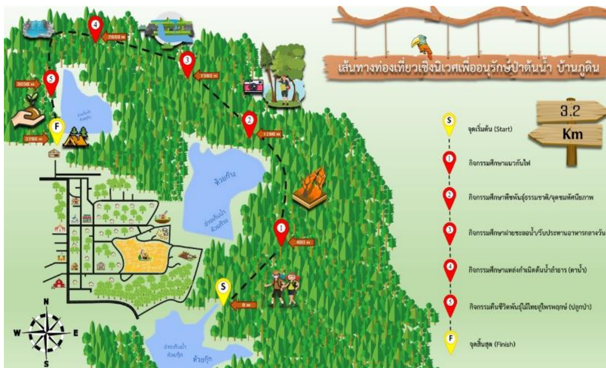
ภาพที่ 2 แผนที่เส้นทางท่องเที่ยวเชิงนิเวศเพื่ออนุรักษ์ทรัพยากรป่าต้นน้ำ ชุมชนบ้านภูดิน

โดยผลการสอบถามความพึงพอใจของนักท่องเที่ยวต่อกิจกรรมและโปรแกรมการท่องเที่ยวโดยชุมชนบ้านภูดินตำบลแม่หอพระ อำเภอแม่แตง จังหวัดเชียงใหม่ อยู่ในระดับมาก ( \bar{X} = 4.17 , SD = .50 ) เมื่อพิจารณาเป็นรายด้าน พบว่า ระดับความพึงพอใจมากที่สุด คือ ด้านกิจกรรมและการเรียนรู้ ( \bar{X} = 4.31 , S.D = .45 ) รองลงมา คือ ด้านการจัดการ ( \bar{X} = 4.24 , S.D = .50 ) รองลงมา คือ ด้านพื้นที่ ( \bar{X} = 4.11 , S.D = .49 ) และด้านการมีส่วนร่วมองค์กรชุมชน ( \bar{X} = 4.03 , S.D = .57 ) ดังตารางที่ 1