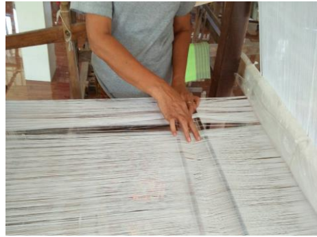
ภาพที่ 4 แสดงการต่อเส้นยืน