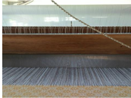
ภาพที่ 2 แสดงการทอเส้นด้าย