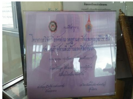
ภาพที่ 1 แสดงเกียรติบัตรการจัด นิทรรศการในวันงานวิชาการ