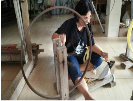
ภาพที่ 1 แสดงการกรอเส้นด้าย