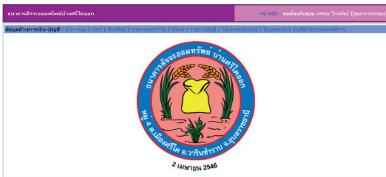
ภาพที่ 2 แสดงหน้าจอหลัก

เมื่อเข้าสู่ระบบสารสนเทศทางการบัญชีธนาคารสัจจะออมทรัพย์บ้านศรีโคกออก ผู้ใช้งานจะพบหน้าจอหลัก ซึ่งประกอบไปด้วยรายการหลัก 8 ด้าน (ดังแสดงในภาพที่ 2) ดังรายละเอียดต่อไปนี้