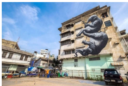
ภาพที่ 1 ตัวอย่างผลงานในโครงการ บุกrukเออร์เบิร์น อาร์ต เฟสติวัล