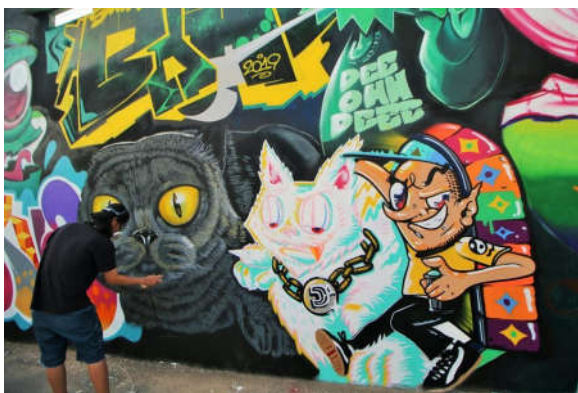
ภาพที่ 5 ผลงานสนับสนุนโครงการ “โคราชเมืองศิลปะ”

แสดงออกและเรียนรู้ด้วยความมั่นใจ ซึ่งใช้กิจกรรมศิลปะเป็นตัวเชื่อมโยงสื่อสารในการมีปฏิสัมพันธ์สร้างสรรค์ (creative interaction) เพื่อจะได้รับประสบการณ์เรียนรู้โดยธรรมชาติทั้งทางด้านการสบสายตา วาจาสร้างสรรค์ สัมผัสที่อบอุ่น เพื่อส่งเสริมพัฒนาการทั้งทางด้านร่างกาย อารมณ์ จิตใจ สังคม และสติปัญญา (Super User, 2562) และสำนักวัฒนธรรมจังหวัดนครราชสีมา ร่วมกับศิลปินสตรีทอาร์ตแนวหน้าของประเทศ ประมาณ 30 คน สร้างผลงานสนับสนุนโครงการ “โคราชเมืองศิลปะ” โดยใช้สีสันของงานกราฟฟิตี้มาช่วยเปลี่ยนกำแพงแห่งแล้งให้กลายเป็นแลนด์มาร์คแห่งใหม่ในตัวเมืองโคราช ซึ่งสถานที่ในการเริ่มโครงการนี้อยู่บริเวณประตูผี (ประตูไชยณรงค์) บนกำแพงหน้าออฟฟิศนครชัยขนส่ง และกำแพงบริเวณใกล้เคียง ที่มีพื้นที่กว่า 49 เมตร (สถาปนิก 64, 2563)