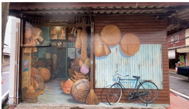
ภาพที่ 9 ภาพเหมือนจริงสะท้อนวิถีชุมชนพนัสนิคม

อีกพื้นที่ในจังหวัดด้านตะวันออก ที่น่าสนใจคือ อำเภอพนัสนิคม ที่รวมตัวกันเพื่อแสดงออกถึงความสำคัญของพื้นที่ โดยพื้นที่พนัสนิคมมีชื่อเสียงในเรื่องงานจักสานที่ดังระดับโลก และชุมชนที่มีความเข้มแข็ง ผู้คนมีความเข้าใจ ที่ต้องการสร้างพื้นที่ให้ชุมชนตลาดในอำเภอเล็ก ๆ ให้เป็นคอมมูนิตี้อาร์ต ศิลปะกับชุมชนถ่ายทอดวิถีชีวิต วัฒนธรรมชาวอำเภอพนัสนิคมในรูปความงดงามของงานศิลปะที่มีกลิ่นอายวิถีชีวิตชุมชน ผสมผสานกับเสน่ห์ของอาคารไม้เก่าแก่ใจกลางเมืองพนัสนิคม ซึ่งสตรีทอาร์ต เป็นโครงการส่งเสริมการท่องเที่ยวของเทศบาลเมืองพนัสนิคม มีแนวคิดที่จะสร้างแหล่งท่องเที่ยววิถีชุมชน แสดงถึงวิถีชีวิต วัฒนธรรม ประเพณี ภูมิปัญญาท้องถิ่นที่เป็นเอกลักษณ์ของอำเภอพนัสนิคม กระตุ้นการท่องเที่ยวรวมถึงเพิ่มรายได้ให้แก่ชุมชน รวมถึงภาพทั้งหมดก็เกิดขึ้นโดยศิลปินที่เป็นชาวพนัสนิคมล้วน ๆ ถ่ายทอดเรื่องราวได้อย่างลึกซึ้ง