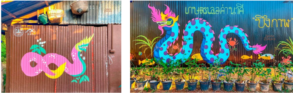
ภาพที่ 6 รูปพญานาค ศิลปะในชุมชนบ้านซี้เหล็กใหญ่

งานสตรีทอาร์ต ทางภาคเหนือได้รับความนิยมอย่างสูงสุด ซึ่งปรากฏอยู่ทุกจังหวัด ตั้งแต่ เชียงราย เชียงใหม่ ลำปาง สุโขทัย แทรกซึมอยู่หลายชุมชน เมืองเชียงใหม่ มีงานสตรีทอาร์ตเป็นชุมชน เรียกได้ว่าเป็น STREET ART IN TOWN อยู่ในย่านชุมชนถนนวัวลาย ถนนมูลเมือง หลังคูกเก่า วัดล่วมช้าง วัดดวงดี ฯลฯ ภาพที่ปรากฏจากศิลปินมีทั้งแสดงลักษณะ คาแร็กเตอร์ต่าง ๆ ของศิลปิน ที่สัมพันธ์กับบริบทเรื่องราวในพื้นที่นั้น ๆ ได้อย่างลึกซึ้ง นอกจากงานบนกำแพงแล้วยังพบงานสตรีทอาร์ตที่ปรากฏอยู่บนตู้โหลดของการไฟฟ้าส่วนภูมิภาค บริเวณถนนสายท่าแพ เป็นภาพที่แสดงออกถึงลวดลายจากวัฒนธรรมท้องถิ่น เช่น ลายผ้าทอต่าง ๆ แสดงความเป็นอัตลักษณ์อย่างชัดเจน