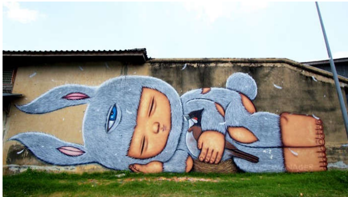
ภาพที่ 4 ผลงานของ Alex face บนผนังบ้านภายในชุมชน อำเภอเมือง จังหวัดยะลา

ควรหาโอกาสไปเดินชมสตรีทอาร์ตไม่ว่าจะเป็นที่ใด เพราะสตรีทอาร์ตเป็นดังพิพิธภัณฑ์กลางแจ้งของเมือง ไม่เพียงแต่จะดึงดูดสายตาให้มองเท่านั้น หลายครั้งที่สตรีทอาร์ตยังมีหน้าที่เป็นประตูสู่ความห่วงใยสำคัญที่ซ่อนอยู่ในสังคม วัฒนธรรม หรือการเมือง ในสถานที่ที่ปรากฏอยู่ในขณะที่เป็นเรื่องง่ายที่จะถ่ายรูปงานสวย ๆ บนกำแพงเมืองสักแห่ง แล้วอัปโหลดบนสื่อออนไลน์ งานสตรีทอาร์ตที่สวยงามที่สุดยังคงคู่ควรกับการใช้เวลาสักสองสามขณะเพื่อคิดว่าสื่อถึงสิ่งใด โดยเฉพาะอย่างยิ่งเมื่ออยู่ในชุมชนจังหวัดชายแดนใต้ที่สันติสุขที่ยั่งยืนเป็นสิ่งทีทุกคนปรารถนาอยากให้เห็น (ศูนย์ประสานการปฏิบัติที่ ๕ กองอำนวยการรักษาความมั่นคงภายในราชอาณาจักร, 2564)