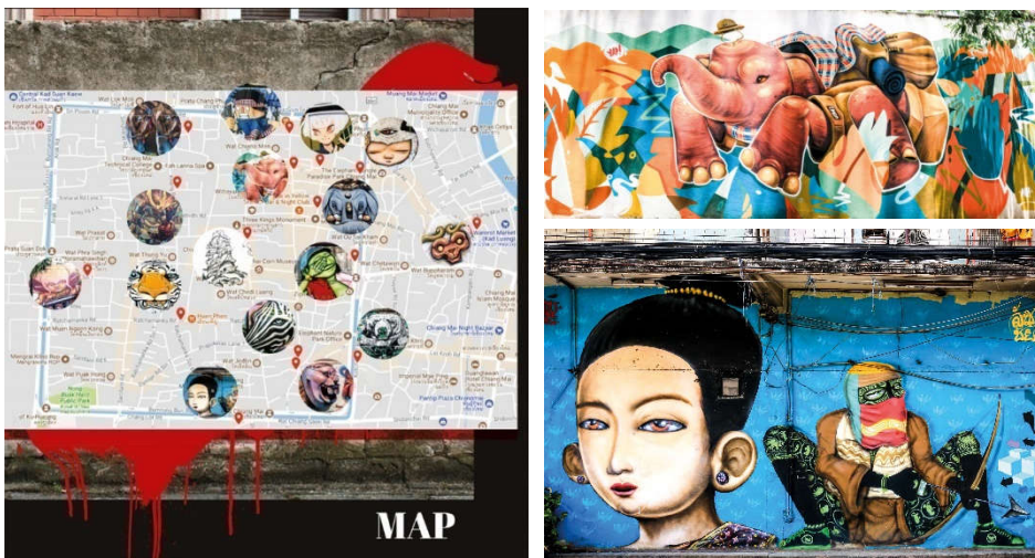
ภาพที่ 7 STREET ART IN TOWN เมืองเชียงใหม่

งานสตรีทอาร์ต ทางภาคเหนือได้รับความนิยมอย่างสูงสุด ซึ่งปรากฏอยู่ทุกจังหวัด ตั้งแต่ เชียงราย เชียงใหม่ ลำปาง สุโขทัย แทรกซึมอยู่หลายชุมชน เมืองเชียงใหม่ มีงานสตรีทอาร์ตเป็นชุมชน เรียกได้ว่าเป็น STREET ART IN TOWN อยู่ในย่านชุมชนถนนวัวลาย ถนนมูลเมือง หลังคูกเก่า วัดล่วมช้าง วัดดวงดี ฯลฯ ภาพที่ปรากฏจากศิลปินมีทั้งแสดงลักษณะ คาแร็กเตอร์ต่าง ๆ ของศิลปิน ที่สัมพันธ์กับบริบทเรื่องราวในพื้นที่นั้น ๆ ได้อย่างลึกซึ้ง นอกจากงานบนกำแพงแล้วยังพบงานสตรีทอาร์ตที่ปรากฏอยู่บนตู้โหลดของการไฟฟ้าส่วนภูมิภาค บริเวณถนนสายท่าแพ เป็นภาพที่แสดงออกถึงลวดลายจากวัฒนธรรมท้องถิ่น เช่น ลายผ้าทอต่าง ๆ แสดงความเป็นอัตลักษณ์อย่างชัดเจน