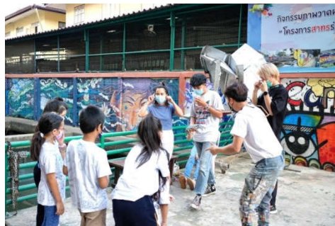
ภาพที่ 2 ตัวอย่างภาพกิจกรรมในโครงการ “ศิลปะริมคลอง” ริมคลองวัดยานนาวา (Canal Art)

“คลองโอ่งอ่าง” โครงการใหญ่อีกหนึ่งพื้นที่ของกรุงเทพมหานครที่มีการปรับปรุงเมืองอย่างเป็นระบบ โดยมีศิลปะสตรีทอาร์ตเข้าไปมีส่วนร่วม โดยพื้นที่คลองโอ่งอ่างก่อนหน้านี้ นับว่าเป็นย่านการค้าที่มีความแออัด มีผู้คนมาตั้งร้านขายของเต็มพื้นที่ เพราะเป็นพื้นที่เศรษฐกิจอันดับต้น ๆ ของกรุงเทพฯ ซึ่งบริเวณดังกล่าวมีความงดงามทางทัศนียภาพเป็นอย่างมากทางกม.จึงมีการปรับปรุงภูมิทัศน์ โดยงานสตรีทอาร์ตรอบชุมชนคลองโอ่งอ่างนั้นเป็นตัวสะท้อนบอกเรื่องราวในอดีตบนพื้นที่นี้ได้อย่างยอดเยี่ยม