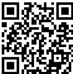
ภาพที่ 3: วิดีโองานสร้างสรรค์ ชุด “Pride Zing”