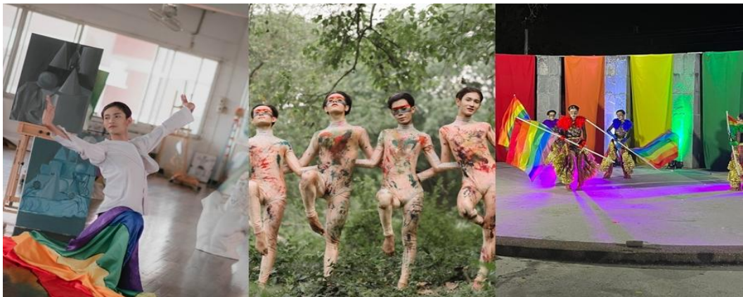
ภาพที่ 2: นาฏกรรมสร้างสรรค์เพื่อการแสดงอัตลักษณ์ทางเพศของกลุ่ม LGBTQ ชุด “Pride Zing”