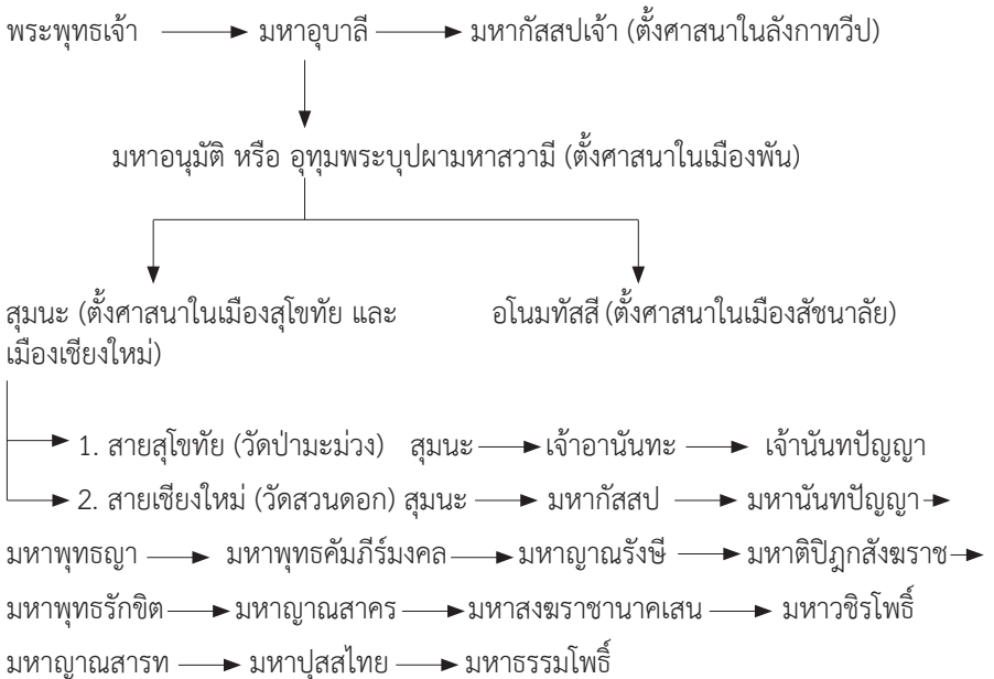
แผนผังแสดงวงศ์พระพุทธรศาสนาฝ่ายวัดสวนดอก

ทั้งนี้วงศ์พระพุทธรศาสนาฝ่ายวัดสวนดอก สามารถสรุปเป็นแผนผังได้ดังนี้