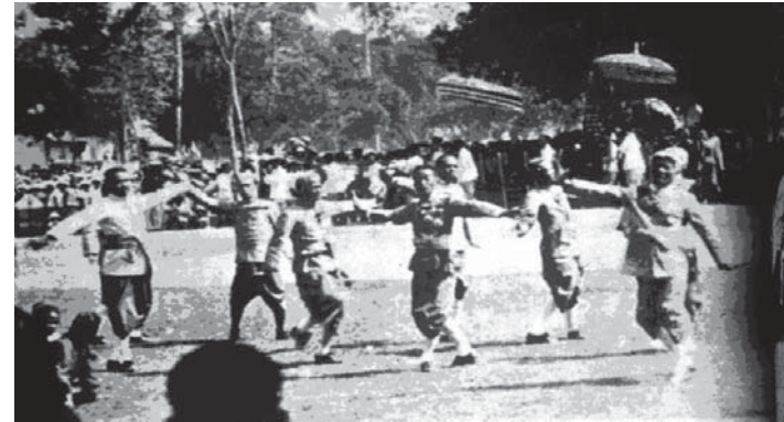
พื่อนรับเสด็จในพิธีทูลขอขวัญถวายรัชกาลที่ 7 เมื่อครั้งเสด็จประพาสล้านนา พ.ศ.2469(เชียงใหม่)