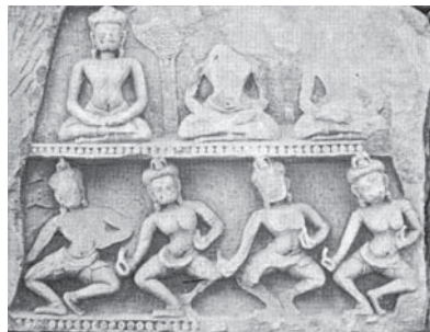
ทับหลังประสาธหินพิมาย จ.นครราชสีมา พุทธศตวรรษที่ 16-17