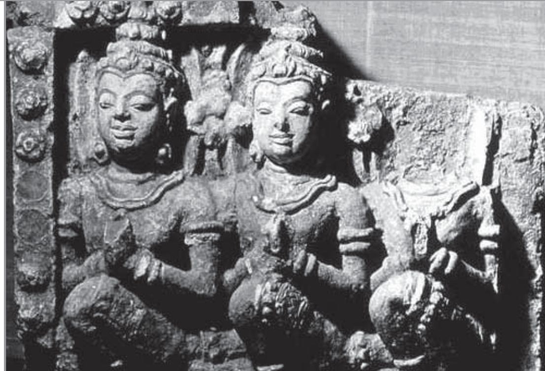
เทพพนม jpg

เป็นผลงานศิลปะประติมากรรมให้อย่างประณีตงดงาม ละเมียดละไมยิ่งนัก ดังตัวอย่างการสร้างพระพุทธรูป ปางลีลา อาจกล่าวได้ว่าช่างสุโขทัย ได้จำลองรูปเทพ ของพระพุทธรองค์ ขณะเสด็จดำเนินลีลามาจากสวรรค์ สวรรค์ ในความรู้สึกที่บานุ่มนวล เป็นพุทธรูปที่ไม อาจสรรหาคำใด ๆ มาเทียบได้ว่ามีความวิจิตรเพียง ไหน พระหัตถ์ที่เรียวยาวที่ค่อยๆ ยกขึ้นอย่างนุ่มนวล นั้นหมายถึงความกรุณาปรานีต่อปวงสรรพเวไนยสัตว์ ของโลก ชายจิวที่ตกลงมาเป็นเส้นพริ้ว ปานประหนึ่งผิ น้าอันสงบนิ่ง ยามเมื่อโดนลมโชยพัดเบาๆ ให้เกิดเป็น