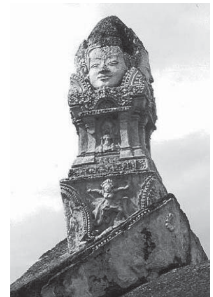
ซุ้มประตู วัดพระศรีรัตนมหาธาตุ พ.ศ.1780