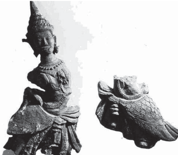
กินรี ฟ้อนแอน

จากหลักฐานที่ปรากฏให้เห็นถึงงานนาฏกรรม การแสดงของสังคมไทยยุคแรกๆ มิได้มีขึ้นมาเพื่อ ความสนุกสนานหรือความบันเทิงใจของผู้คนเพียง อย่างเดียว เพราะผู้แสดงและผู้ชมการแสดงมักมีจุด มุ่งหมายไปในทิศทางเดียวกัน เช่นร่วมกันสร้างขึ้นมา เพื่อความอุดมสมบูรณ์ หรือเพื่อความมั่งคั่งมั่นคงของ สังคม ดังนั้นงานนาฏกรรมการแสดงจึงมักเกี่ยวข้องกับ พิธีกรรม ตามระบบความเชื่ออันศักดิ์สิทธิ์ เช่น