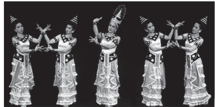
ระบำสุโขทัย