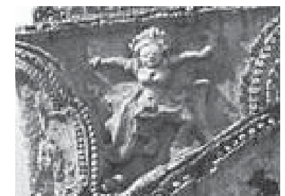
อัปสรพ้อนรำ ซุ้มประตู วัดพระศรีรัตนมหาธาตุ พ.ศ.1780