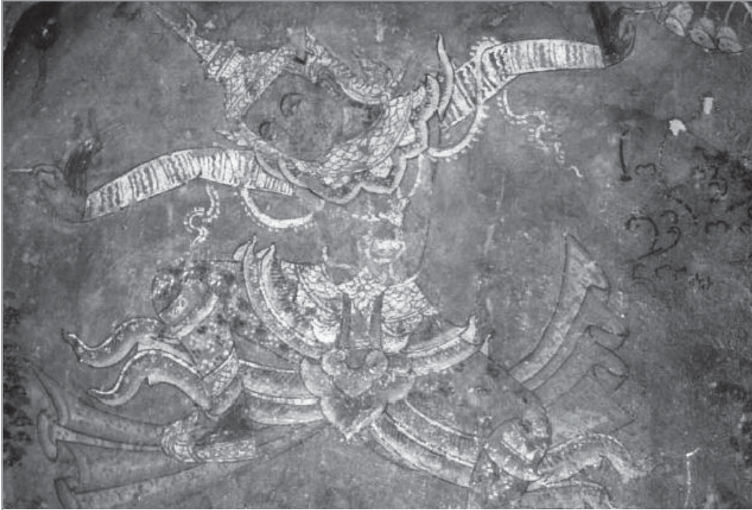
เทวดาพื่อนรำหนังวัด ภูมินทร์ ต้นพุทธศตวรรษที่ 20