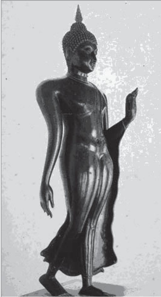
พระสุโขทัยปางลีลาที่ระเบียงวิหารวัดเบญจมบพิตร กรุงเทพฯ เป็นพระสำริดสูงกว่าเมตร อายุศิลปะระหว่าง ศตวรรษที่ 19-20

ลีลาการพ้อนรำของทางภาคเหนือ ซึ่งก็อาจจะมีความคล้ายคลึงกันอยู่บ้าง ไม่มากนัก