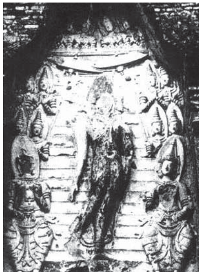
พระสุโขทัยปางลีลา “พระพุทธเจ้าเสด็จจากดาวดึงส์” ภาพปูนปั้นในซุ้มด้านทิศใต้มณฑป วัดตระพังทองหลวง จังหวัดสุโขทัย

นอกจากนี้ยังพบรูปสลักเป็นนางอัปสรพ้อนรำที่ปรากฏอยู่บนซุ้มประตูทางเข้า วัดพระศรีรัตนมหาธาตุที่เมืองสุโขทัย จ.สุโขทัย ถือเป็นศิลปะสมัยบายัน ซึ่งลีลาการพ้อนรำจะมีความคล้ายคลึงกับจิตรกรรมฝาผนังรูปพระอินทร์พ้อนรำที่ปรากฏอยู่บนผนังวัดกุฎีจันทร์ จ.น่าน ถึงแม้ว่าอายุการสร้างงานจะแตกต่างกันอยู่หลายร้อยปีก็ตาม เราสามารถสัมผัสได้กับลีลาที่มีพลังเปิดกว้างอย่างอิสระแต่แฝงไปด้วยความนุ่มนวลอ่อนหวานที่ปรากฏออกมาพร้อมๆกัน ความรู้สึกเช่นนี้อาจเทียบเคียงได้กับเหตุการณ์ที่เจ้านายฝ่ายเหนือ ร่วมกันพ้อนรับเสด็จใน