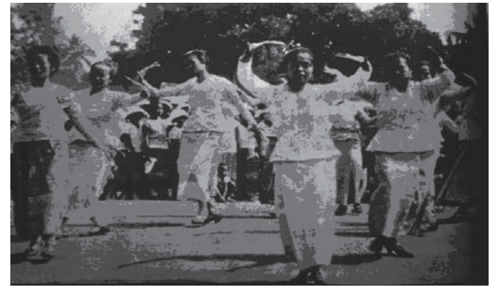
พื่อนรับเสด็จในพิธีทูลขอขวัญถวายรัชกาลที่ 7 เมื่อครั้งเสด็จประพาสล้านนา พ.ศ.2469(เชียงใหม่)