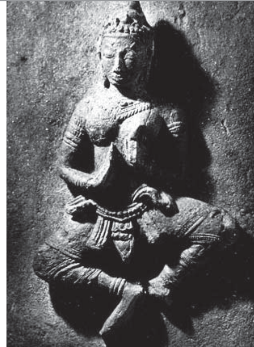
รูปเทวดาร่ายรำของสุโขทัย

พิธีทูลพระขวัญถวายรัชกาลที่ 7 เมื่อครั้งเสด็จประพาสลำานา พ.ศ.2469 (เขียนใหม่)