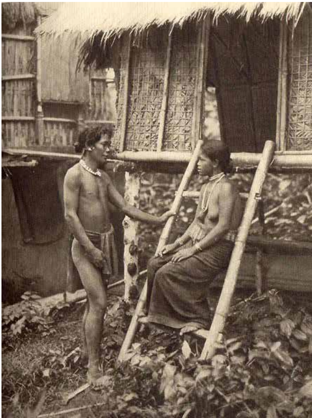
ภาพที่ 1 ข่าแห่งปากเซเขตภาคใต้ของลาว (Kha du Paksé, au Laos méridional)

ค.ศ. 1882 - 1883 แอมอนิเยร์ (2539, 12) นักเดินทางชาวฝรั่งเศสได้ตั้งข้อสังเกต เรื่องการผสมกลมกลืนทางวัฒนธรรมระหว่างศาสนาพุทธกับชนบทรรมนิยม ประเพณีลาวในกลุ่มข่า จิตร ภูมิศักดิ์ ได้อธิบายปรากฏการณ์นี้เอาไว้ที่น่าสนใจ “วัฒนธรรมลาวสูงกว่า การผลิตของลาวก็สูงกว่า จึงดูดเอาพวกส่วยให้หัน มาใช้ชีวิตแบบลาว พูดภาษาลาว” (จิตร 2535, 283)