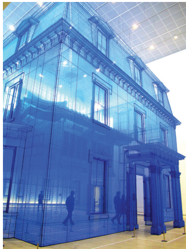
ภาพที่ 8 Do Ho Suh: "Home Within Home Within Home Within Home", 2013/14, soft translucent fabric, 1500 x 1500 x1200 cm.

รูปแบบศิลปะจัดวางของ Do Ho Suh จำลองแบบสิ่งของเครื่องใช้ที่มีอยู่ในอพาร์ทเมนต์ของเขาที่ประเทศสหรัฐอเมริกาในขนาดเท่าจริง เพื่อสร้างความสัมพันธ์ระหว่างสองความคิด คือพื้นที่ที่พำนักส่วนตัวของศิลปิน และความหมายของพื้นที่ส่วนตัว ศิลปินตั้งคำถามว่าสิ่งของเครื่องใช้ส่วนตัว (object) และพื้นที่ (space) สามารถแสดงอัตลักษณ์ของบุคคลได้หรือไม่ นิทรรศการ Home Within Home Within Home Within Home Within Home ปี ค.ศ. 2013-2014 (ภาพที่ 8) ณ หอศิลป์สมัยใหม่และร่วมสมัยโซล (Museum of Modern and Contemporary Art) ผลงานจัดวางชิ้นนี้ ผนวกภาพความทรงจำและตัวตนของศิลปินเข้ากับสองประเด็นของพื้นที่ในชีวิต อันได้แก่ บ้านเกิดที่โซล ประเทศเกาหลีใต้ และสถานที่ศึกษาที่รัฐโรดไอแลนด์ ประเทศสหรัฐอเมริกา (Do Hu Suh online)