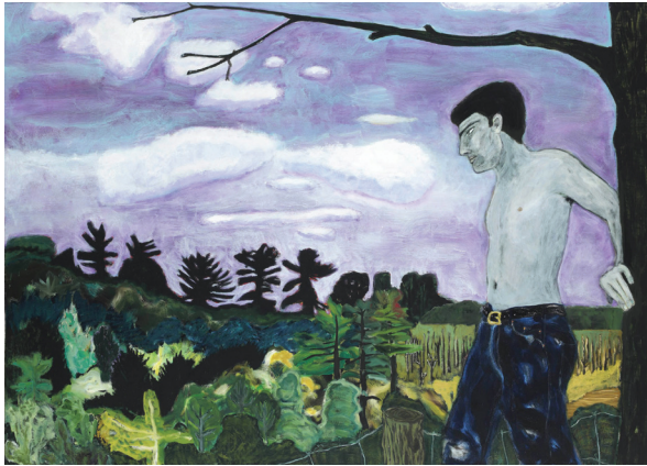
ภาพที่ 14 Peter Doig: “At the Edge of Town”, 1986/88, oil on canvas, 152 x 213 cm.

“At the Edge of Town” ค.ศ. 1986-1988 (ภาพที่ 14) เป็นผลงานที่มีการแสดงออกไปจากงานในช่วงปลายยุคต้นของเขา ช่วงเวลามากกว่าหกถึงเจ็ดปีนั้นโดยจ้ผลิตผลงานสร้างสรรค์บนพื้นฐานแนวความคิดในเรื่องอัตลักษณ์ สังคมเมือง วัฒนธรรม และประวัติศาสตร์ ผลงานชิ้นนี้กล่าวถึงการวิไลหาธรรมชาติด้วยการวาดเป็นภาพผู้ชายเปลือยกายท่อนบน สวมกางเกงยีนส์ กำลังยืนมองดูธรรมชาติ และความรู้สึกใคร่ครวญระยะห่างระหว่างมนุษย์และธรรมชาติ บ่งบอกความหมายของเวลาและสถานที่ที่ศิลปินคำนึงถึง ซึ่งน่าจะเป็นประสบการณ์ชีวิตในอดีตเมื่อครั้งอาศัยอยู่ในแคนาดา การใช้ทัศนธาตุทางศิลปะในงานชิ้นนี้จึงแตกต่างอย่างสิ้นเชิงจากผลงานชุดอื่นๆ ก่อนหน้านี้ทั้งการใช้สีตามธรรมชาติ และใช้สัดส่วนของบุคคลในภาพให้สัมพันธ์กับธรรมชาติแวดล้อม ซึ่งบ่งชี้ว่าต่อจากนี้ไปศิลปินจะเริ่มนำเรื่องราวในอดีตและธรรมชาติมาใช้ในผลงานมากขึ้น