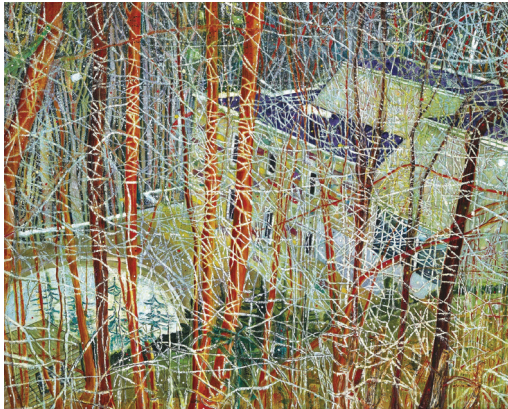
ภาพที่ 16 Peter Doig: “The Architect’s Home in the Ravine”, 1991, oil on canvas, 200 x 275 cm.

ในขณะที่บางส่วนของภาพจะมีลักษณะที่เป็นนามธรรม (Abstract) กล่าวคือ หากมองลงไปในพื้นที่บางส่วนจะเห็นเฉพาะบริเวณการทับซ้อนของสีและรูปทรงที่ไม่ชัดเจน การตัดลดทอนรายละเอียดส่งผลให้ผลงานมีลักษณะสื่อสารในเชิงการไม่เป็นตัวแทนของสิ่งใด (Non-representation) นอกจากนี้ ผลงานในชุดเดียวกันอีกชิ้นที่สร้างในปีเดียวกันชื่อ “White Canoe” ขนาด 200.5 x 243 เซนติเมตร กลับแสดงพัฒนาการที่เน้นการสร้างอารมณ์ผ่านพื้นที่และสิ่งแวดล้อม