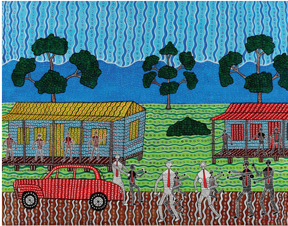
ภาพที่ 9 Robert Campbell jur.: “Welfare don’t take my kids”, 1987, synthetic polymer paint on canvas, 97.5 x126.5 cm.

การสำรวจทางประวัติศาสตร์ศิลปะจากกลางคริสต์ศตวรรษที่ 19 ถึงปัจจุบัน มีเทคนิควิธีการหลากหลายที่ถูกนำมาใช้ถ่ายทอดผลงานศิลปะภายใต้ประเด็น การถวิลหาอดีต แต่ข้อสังเกตที่น่าสนใจคือ เราสามารถสรุปรูปแบบในเข้าถึง การระลึกอดีตหรือตัวแทนของอดีตด้วยการจำแนกผ่านรูปแบบของสิ่งที่ เกี่ยวข้องดังต่อไปนี้