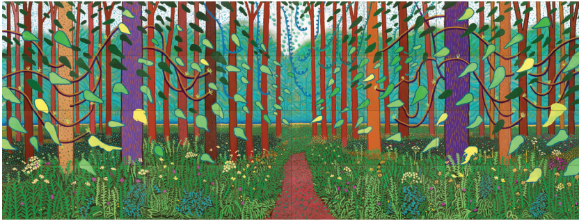
ภาพที่ 5 David Hockney: “Arrival of spring in Woldgate, East Yorkshire”, 2011, oil on canvas, 365.6 x 975.2 cm.

Allen Gallery เมืองนิวยอร์ก (ภาพที่ 6) เป็นสัญลักษณ์อย่างหนึ่งของการโหยหาอดีต โดยไม่จำเป็นต้องนำเสนอภาพหรือสถานที่อย่างตรงไปตรงมา หากกระบวนการทางการผลิตหรือการสัมผัสรูป รส กลิ่น เสียง ก็เพียงพอที่จะเชื่อมต่อเข้าสู่ประเด็นดังกล่าวได้ “ผัดไทยของฤกษ์ฤทธิเป็นตัวแทนความทรงจำระหว่างศิลปินและคุณยายซึ่งเป็นบุคคลสำคัญในชีวิต” (what’s the big idea?: performance online)