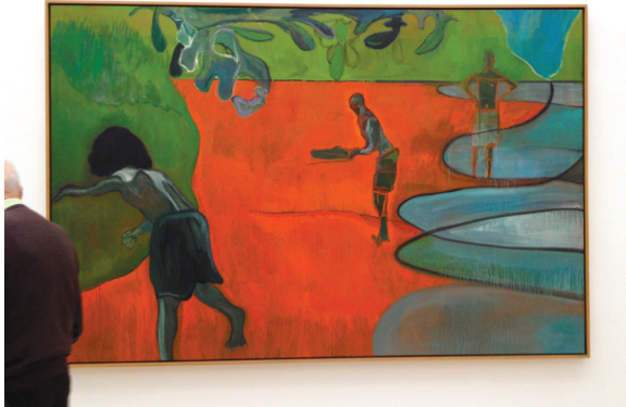
ภาพที่ 25 Peter Doig: “Paragon”, 2006, oil on canvas, 195 x 295 cm.

รูปแบบผลงานของ Paul Gauguin มีอิทธิพลต่อการทำงานจิตรกรรมของดอยจ์เป็นอย่างมาก ดังเช่น ผลงานชื่อ “Paragon” ค.ศ. 2006 (ภาพที่ 25) ประเด็นที่น่าสนใจยิ่งคือ ดอยจ์ต้องการที่ลอกเลียนหรือจำลองภาพเพื่อระลึกถึงอดีตหรืออย่างไร ผลงานจิตรกรรม Paragon เป็นภาพวาดที่ใช้สีโทนร้อนจัดจ้าน ลดทอนรายละเอียดของสิ่งแวดล้อมให้เหลือเพียงพื้นที่สีและการตัดเส้นในการจัดสัดส่วนและสร้างระยะใกล้-ไกล (Perspective) ภาพกลุ่มเด็กกำลังเล่นกีฬาคริกเก็ต ซึ่งเป็นกีฬาที่ศิลปินเคยเล่นในสมัยเด็กๆ สะท้อนภาพความทรงจำของศิลปินเอง