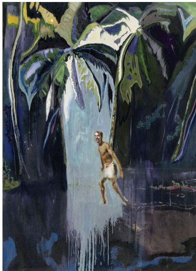
ภาพที่ 23 Peter Doig: "Pelican", 2003, oil on canvas, 276 x 200.5 cm.

บ่งชี้เรื่องราว ดอยจ้ต้องการให้มีคนยืนเฝ้าประตูประหนึ่งกำลังขัดขวางไม่ให้มีการผ่านเข้าไปในภายในอื่น ทั้งนี้เขื่อนจึงถูกใช้เป็นสัญลักษณ์ความเป็นส่วนตัวของศิลปิน อีกทั้งชุดเครื่องแต่งกายของคนเฝ้าประตูสองคนมีลักษณะของความมีอำนาจแต่อ่อนยุค ภาพที่ปรากฏในผลงานจิตรกรรมชิ้นนี้จึงเป็นการผสมผสานความต้องการของเวลาที่หลากหลาย คือไม่ต่อเนื่องสิ้นไหลบนความสมเหตุสมผล ประกอบกับอิทธิพลจากฉากภาพยนตร์ที่เป็นแรงบันดาลใจให้ดอยจ้ ส่งเสริมให้ผู้ชมเกิดการตีความได้อย่างกว้างไกล อุตลักษณ์ของผลงานชุดนี้จึงพิจารณาได้จากประเด็นกระบวนการสร้างสรรค์ที่ศิลปินมักอาศัยแหล่งข้อมูลที่หลากหลายและไม่มีความจำเป็นที่ต้องอยู่ในช่วงเวลาที่ต่อเนื่องกัน หากแต่ศิลปินจะใช้ความคิดของตนเองเป็นตัวกำหนดเนื้อหาในการทำงานศิลปะ