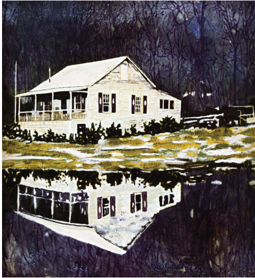
ภาพที่ 19 Peter Doig: “Camp Forestia”, 1996, oil on canvas, 170 x 170 cm.

ภาพของพื้นที่และสถาปัตยกรรม “Camp Forestia” ค.ศ. 1996 (ภาพที่ 19) แสดงเอกลักษณ์ทางความคิดที่มีต่อวัตถุของดอยจ์ การรวบรวมประสบการณ์ และแหล่งข้อมูลที่หลากหลาย ทั้งในรูปแบบกายภาพ โปสการ์ด ภาพถ่าย ฉากในภาพยนตร์ วรรณกรรมและหนังสือ ผนวกเข้ากับความรู้สึทางนามธรรม ผลงานชิ้นนี้อาศัยลักษณะพิเศษของสองเทคนิคคือ เทคนิคภาพพิมพ์โลหะ และเทคนิคจิตรกรรม ซึ่งอยู่ในชุดที่ชื่อว่า Grasshopper ผลิตขึ้นในช่วงปี ค.ศ. 1992-1997 ดอยจ์ได้แรงบันดาลใจจากหนังสือประวัติศาสตร์กีฬาฮอกกี้น้ำแข็ง ซึ่งอุปมาอุปมายพุ่งตักแทนกับสังคมมนุษย์ (Clibborn et al. 2001, 313) สังคมมนุษย์เปรียบได้กับสังคมแมลงตัวเล็กๆ ที่อยู่รวมกลุ่ม และเคลื่อนไหวเปลี่ยนแปลงอยู่ตลอดเวลา มีความเป็นไปได้ที่ศิลปินจะมองกลับเข้าไปในตนเอง และเปรียบเทียบการเคลื่อนย้ายถิ่นฐานของตนว่าไม่แตกต่าง