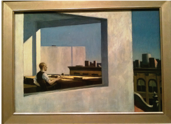
ภาพที่ 4 Edward Hopper: "Office in a small city", 1953, oil on canvas, 71x102 cm.