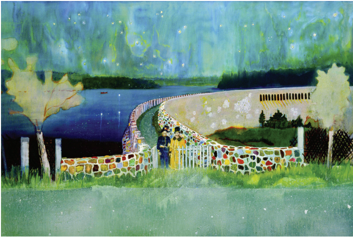
ภาพที่ 22 Peter Doig: “Gasthof”, 2002/04, oil on canvas, 274.5 x 200 cm.

ผลงานชุดแรกในประเทศตริनिแดดและโตเบโก ผลงาน “Gasthof” ค.ศ. 2002-2004 (ภาพที่ 22) ศิลปินได้รับแรงบันดาลใจจากภาพเก่าในวัยเด็กของตน และเพื่อนๆ ในฉากละคร Petrushka ที่สวมชุดเครื่องแต่งกายยุคคริสต์ศตวรรษที่ 19 (regalia) นอกจากนี้ศิลปินยังได้รับแรงบันดาลใจจากวรรณกรรมและประวัติศาสตร์ของพื้นที่ (Peter Doig interviewed by Kitty Scott, online)