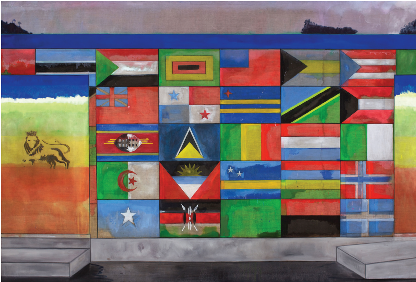
ภาพที่ 26 Peter doig: “Painting for Wall Painter”, 2010, oil on canvas, 240 x 360 cm.

ผลงาน “Paintings for Wall Painter” ค.ศ. 2010 (ภาพที่ 26) สะท้อนความคิดของศิลปินที่มีต่อพื้นที่ (ในประเทศตรินิแดดและโตเบโก) ในช่วงปี ค.ศ. 1962-1966 เนื่องจากตอยจ์เคยใช้ชีวิตกับครอบครัวในประเทศดังกล่าว ภาพกำแพงแห่งนี้ตั้งอยู่ในเมืองหลวงของประเทศตรินิแดดและโตเบโก ซึ่งปัจจุบันพื้นที่นี้กลายเป็นส่วนหนึ่งของรัฐสภา ภาพธงชาติของประเทศหมู่เกาะต่างๆ โนโชนทะเลแคริบเบียนที่ถูกจัดวางให้เรียงรายอย่างเป็นระเบียบเรียบร้อยอยู่บนกำแพง วาดขึ้นเพื่อประชาสัมพันธ์ถึงความเป็นหนึ่งเดียวกันของกลุ่มประเทศดังกล่าว ศิลปินวาดรายละเอียดของธงชาติด้วยลักษณะที่แสดงให้เห็นถึงร่องรอยการไหลย้อนและการซึมซับของสี มีการใช้สีเข้ม รองพื้นเพื่อลดค่าความสว่างของสีสดที่นำมาซ้อนทับด้านบน ทั้งนี้เพื่อควบคุมบรรยากาศของภาพ