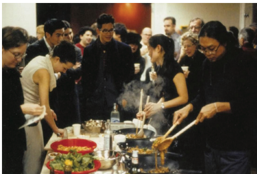
ภาพที่ 6 Rirkrit Tiravanija: “Untitled (Pad Thai)”, 1990, mixed media, dimensions variable.