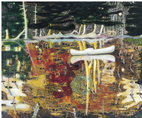
ภาพที่ 15 Peter Doig: “Swamped”, 1990, oil on canvas, 197 x 241 cm.

ช่วงต้นปี ค.ศ. 1990 ดอยจี้มีความเชื่อในแนวความคิดเรื่องพลเมืองโลก (Global Citizenship) จึงไม่ต้องการที่จะมีสัญชาติใดสัญชาติหนึ่งที่ชัดเจน ประกอบกับปัจจุบันมีศิลปิน นักวิชาการ ภัณฑารักษ์ร่วมสมัยจำนวนไม่น้อยที่โยกย้ายถิ่นฐานการทำงานไปยังเมืองต่างๆ ตลอดเวลา ทำให้ความคิดในเรื่องประชากรของโลกกลายเป็นลักษณะเด่นร่วมสมัยไปโดยปริยาย