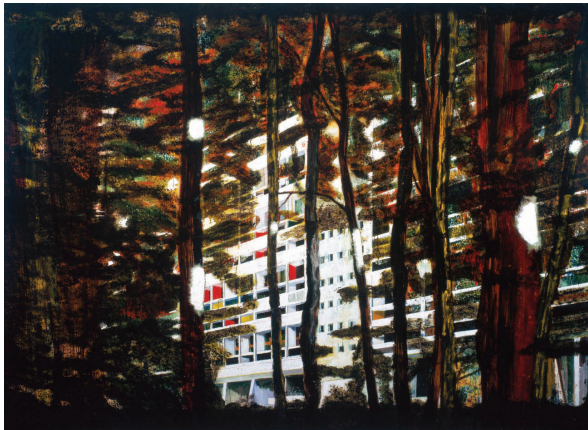
ภาพที่ 17 Peter Doig: “Concrete Cabin”, 1992, oil on canvas, 200 x 275 cm.

ระหว่างเส้นสายในธรรมชาติกับโครงสร้างทางสถาปัตยกรรมสมัยใหม่เพื่อสื่อให้เห็นภาพอาคารสมัยใหม่ที่ถูกโอบล้อมด้วยธรรมชาติของป่า เนื่องจากบ้านพักอาศัยในลักษณะนี้มักจะตั้งอยู่อย่างโดดเดี่ยวในธรรมชาติ แต่กลับมีสิ่งอำนวยความสะดวกอย่างมากมาย ในช่วงเวลานั้น ดอยจ์มัวดภาพสถาปัตยกรรมกับธรรมชาติ เพราะความสนใจในแนวคิดเรื่องการถวิลหาอดีต ซึ่งเป็นประสบการณ์ประทับใจในอดีตของเขาที่มีต่อพื้นที่ที่อยู่อาศัยและสภาพแวดล้อม หากเปรียบเทียบกับผลงาน “Swamped” จะพบว่าแนวความคิดและการถวิลหาประสบการณ์ในอดีตที่มีต่อสถานที่ถูกพัฒนาเป็นการมองในมุมเฉพาะที่แคบลงและชัดเจนมากขึ้น