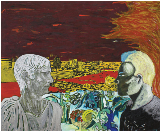
ภาพที่ 12 Peter Doig: "Contemplating Culture", 1985, oil on canvas, 195 x 241 cm.

ภาพรณนต์สีขาวบนอาคารโครส์เลอร์เป็นการสะท้อนวัฒนธรรมอเมริกัน (Pop Culture) ตลอดจนเสียดสีความความเลศนุของสังคมเมืองโดยเชื่อมโยงเข้ากับความจริงใจของศิลปินในการตั้งชื่อผลงาน การแสดงออกของผลงานทั้งสองชิ้นเป็นการใช้วิธีการวาดเส้นด้วยสีอ่อนทับพื้นเข้ม ขณะที่ภาพด้านบนท้องฟ้าทำให้นึกถึงเทคนิคการสาดสีของ Jackson Pollock ศิลปินอเมริกัน ภาพทั้งสองจึงเป็นการเชื่อมโยงในส่วนของเนื้อหาทางสังคม พื้นที่ และศิลปะจิตรกรรมที่ศิลปินใช้เป็นภาพตัวแทนของชนชาตินั้นๆ (Peter Doig: Early Works, online) จิตรกรรมทั้งสองภาพในชุดนี้อาจกล่าวได้ว่า เป็นเหมือนภาพเขียนที่มีอยู่ในหัวของศิลปิน และพยายามสื่อสารออกมาอย่างตรงไปตรงมา (Peter Doig: Early Works Review – a show all would-be artists should visit, online) จากผลงานสร้างสรรค์ชุดนี้ทำให้สังเกตเห็นถึงความพยายามในการแสวงหาอัตลักษณ์ทางศิลปะของดอยจ์โดยสร้างจากพื้นฐานความรู้ทางประวัติศาสตร์ ประสบการณ์การวิไลหาอดีตของตน และรูปแบบศิลปะจากลัทธิศิลปะในประวัติศาสตร์ เช่น German Expressionism และ Pop Art เป็นต้น