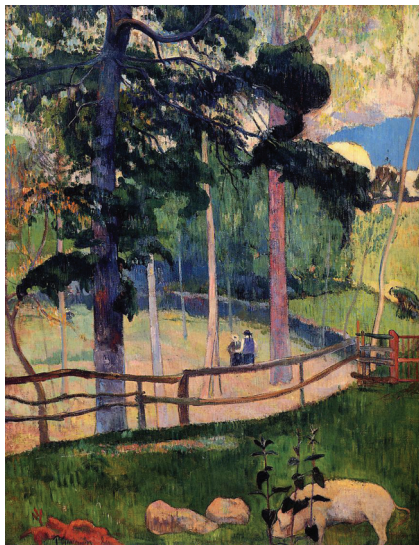
ภาพที่ 1 Paul Gauguin: “Nostalgic Promenade”, 1889, oil on canvas.

เพื่อขายแรงงาน รับจ้างทำเหมืองแร่ และเข้าทำงานในโรงงานทอผ้าในยุคนั้น แม้กระทั่งศิลปินก็สามารถแบ่งออกได้เป็นสองกลุ่มใหญ่ๆ คือ กลุ่มศิลปินเมืองและกลุ่มศิลปินย้ายถิ่น ที่ต้องการหลบหนีจากความวุ่นวายของสังคมสมัยใหม่ในเมืองและกลับไปสู่การสร้างสรรค์ร่วมกับธรรมชาติ (Countryside, Rural, Non-urban) เช่น André Derain, Claude Monet, Maurice de Vlaminck, Pablo Picasso, Paul Gauguin และ Vincent van Gogh เป็นต้น (Nostalgic Promenade - Paul Gauguin, 1889) (ภาพที่ 1)