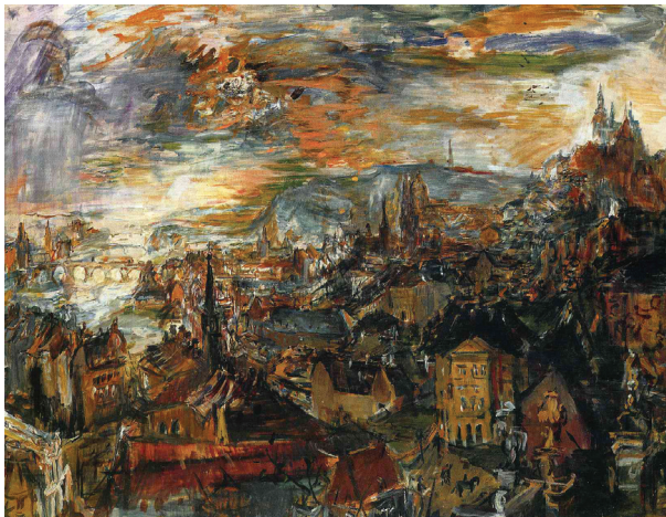
ภาพที่ 3 Oskar Kokoschka: "Prague, view from Villa Kramar", 1934, oil on canvas.