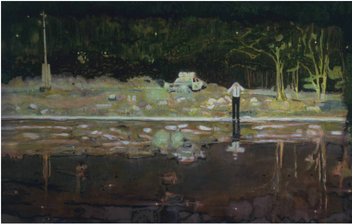
ภาพที่ 21 Peter Doig: “Echo Lake”, 1998, oil on canvas, 230.5 x 360.5 cm.

การต่อสู้ดิ้นรนและความพยายามที่จะวิงเวียนหาตรรกะในภาพยนตร์เชื้อเชิญให้ตั้งคำถามต่อความรู้ สึกภายในตัวศิลปินเช่นเดียวกับ “Echo Lake” ค.ศ. 1998 (ภาพที่ 21) ใช้แรงบันดาลใจจากฉากในภาพยนตร์เดียวกัน สิ่งที่แตกต่างกันไปจากผลงานก่อนหน้านี้คือ มุมมองของเจ้าหน้าที่ตำรวจที่มองข้ามแม่น้ำมายังผู้ชม ทั้งนี้เพื่อสื่อว่ากำลังมองหาผู้หญิงที่ส่งเสียงกรีดร้อง ตามเนื้อเรื่องในภาพยนตร์ ภาพสถานที่และบรรยากาศถูกผลิตซ้ำและปะติด (Copy and Paste) จากภาพที่ปรากฏในภาพยนตร์ผนวกประสบการณ์ส่วนตัวที่มีต่อทะเลสาบและความรู้สึกภายใน