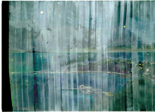
ภาพที่ 24 Peter Doig: “Black Curtain”, 2004, oil on canvas, 200 x 275 cm.

ผลงานเชิงทดลองกึ่งนามธรรมของดอยจันชื่อ “Black Curtain” ค.ศ. 2004 (ภาพที่ 24) หลังปี ค.ศ. 2002 ศิลปินเลือกใช้สีที่ตนเองประทับใจ และสีที่ตนเองสร้างขึ้นมาใช้เป็นภาพต้นแบบ “Black Curtain” พัฒนามาจากภาพถ่ายที่ศิลปินพายเรือคายักรอบๆ ชายฝั่งตอนเหนือของตรินิแดด บันทึกรูปด้วยกล้อง และเล่นลึกระยะไกลเพื่อค้นหาภาพที่มองไม่เห็นด้วยตาเปล่า ภาพที่ได้จึงถูกตีความใหม่ในมิติของมุมมอง ผลงานชิ้นนี้เป็นภาพเกาะในมุมมองจากที่สูง ศิลปินทาเคลือบภาพด้วยสีขาว คล้ายการถูกปกคลุมด้วยเยื่อบางๆ สีขาวทำให้ผู้ชมไม่สามารถมองรายละเอียดของภาพได้ชัดเจน ประหนึ่งศิลปินกำลังเล่นกับความคิดของแหล่งที่มาที่ไม่สมบูรณ์และไม่ต่อเนื่อง ซึ่งเป็นความคิดในเชิงการตีความความสำคัญของพื้นที่ ศิลปินอาศัยการเก็บเกี่ยวประสบการณ์ในพื้นที่ด้วยการสร้างกิจกรรมการสำรวจพื้นที่ทั้งจากการพายเรือด้วยตนเอง รอบๆ เกาะและปีนขึ้นสู่ยอดเขาเพื่อดูลักษณะของภูมิประเทศ ในทางกลับกันผลลัพธ์ของผลงานจิตรกรรมชิ้นนี้มีความแตกต่างจากผลงานในอดีต การเคลือบด้วยสีขาวของดอยจันนับเป็นการทดลองทางทัศนธาตุเพื่อหาความเป็นไปได้ใหม่ๆ