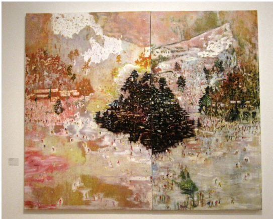
ภาพที่ 18 Peter Doig: “Ski Jacket”, 1994, oil on canvas, 295 x 351 cm.

ชื่อดัง Le Corbusier ดอยจ้เก็บข้อมูลด้วยการถ่ายภาพวิดีโอเพื่อนำมาใช้ในการสร้างสรรค์ในหัวข้อความสัมพันธ์ของมนุษย์ที่มีต่อพื้นที่ในสิ่งแวดล้อมและความทรงจำ ผลงานชิ้นนี้มีลักษณะการมองจากพื้นที่ในป่าอ่อนแสงออกไปในลักษณะซิลลูเอท (silhouette) ใช้ต้นไม้ใหญ่ในระยะหน้าปิดบังความยิ่งใหญ่ของอาคารด้านหลัง ซึ่งมีสีที่จัดจ้านตามลักษณะการใช้แม่สีของ Le Corbusier ผลงานชุดนี้วิพากษ์วิจารณ์ความคิดในยุคสมัยใหม่หลังสงครามโลกครั้งที่สองที่เร่งการผลิตในเชิงอุตสาหกรรม และทำให้วิถีชีวิตของมนุษย์เปลี่ยนแปลงไป ในชุดเดียวกันนี้ยังมีผลงานชื่อ “Concrete Cabin II” ค.ศ. 1992, “Cabin Essence” ค.ศ. 1993-1994 และ “Boiler House” ค.ศ. 1994 ที่พัฒนามาจากข้อมูลภาพถ่ายวิดีโอเช่นกัน