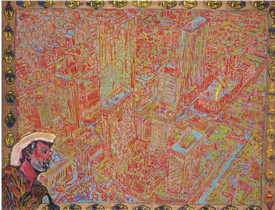
ภาพที่ 10 Peter Doig: “I think it’s time...”, 1982/1983, oil on canvas, 180.5 x 238 cm.

ผลงาน “I think it’s time...” ค.ศ. 1982-1983 (ภาพที่ 10) ผลงานชิ้นนี้ได้รับแรงบันดาลใจโดยตรงจากประสบการณ์เดินทางในนิวยอร์ก ประเทศสหรัฐอเมริกา ในปี ค.ศ. 1982 นับเป็นผลงานชิ้นแรกๆ ที่ดอยจ์ถ่ายทอดบรรยากาศของสังคมเมืองสมัยใหม่ที่เป็นสิ่งแวดล้อมใหม่ แตกต่างไปจากประสบการณ์ในอดีตของศิลปิน ซึ่งมีพื้นเพมาจากสังคมชนบท แมื่อดอยจ์จะเคยเดินทางมาสหรัฐอเมริกาเกือบครบครันแล้ว ภาพมุมมองจากอาคารสูงเมืองนิวยอร์กสะท้อนความคิดบางประการที่ศิลปินมีต่อพื้นที่ในความทรงจำ ผลงานจิตรกรรมชิ้นนี้ใช้การวาดภาพในลักษณะเหมือนการ์ตูน ซึ่งมีลักษณะตรงไปตรงมาในการแสดงออก โดยคงลักษณะภูมิทัศน์ของความเป็นมหานครไว้ หากพิจารณาในรายละเอียด ศิลปินแสดงภาพล้อเลียนสังคมและวิพากษ์