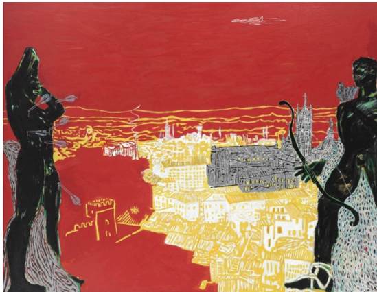
ภาพที่ 13 Peter Doig: “Red Sienna”, 1985, oil on canvas, 180 x 234 cm.

“Contemplating Culture” ค.ศ. 1985 (ภาพที่ 12) จากภาพ เราอาจสังเกตเห็นได้ว่า ดอยจ์เริ่มอาศัยภาพความทรงจำจากการเดินทางในทวีปยุโรป และการตั้งคำถามต่ออัตลักษณ์ทางวัฒนธรรม เขาเริ่มแสดงความสนใจต่อแนวคิดเรื่องบทบาทของศิลปิน จากลักษณะภาพที่แสดงอารมณ์รุนแรงและความร้อนรุ่มภายใน ฉากหลังเป็นทัศนียภาพของเมือง ส่วนฉากหน้าของภาพมีสภาพการเผชิญหน้าระหว่างภาพวาดบุคคลของยุคปัจจุบันทางด้านขวามือของภาพกับประติมากรรมบุคคลในสมัยโรมันทางด้านซ้ายมือ ซึ่งเป็นตัวแทนแห่งยุคสมัยของความสมบูรณ์และความเข้มแข็งทางวัฒนธรรมในประวัติศาสตร์ ดอยจ์ใช้ภาพสถานที่ในการเปรียบเทียบให้เห็นความนัยของประเด็นที่ต้องการวิพากษ์วิจารณ์ ดังการใช้ภาพทิวทัศน์ในยุโรปควบคู่กับลักษณะของท้องฟ้าสีแดงเข้มร้อนแรง สื่อสารถึงความรู้สึกอารมณ์ที่เร้าร้อนจากการเผชิญทางความคิดภายในของศิลปินกับคุณค่าและประวัติศาสตร์สังคมและวัฒนธรรมยุโรปในช่วงเวลาดังกล่าว