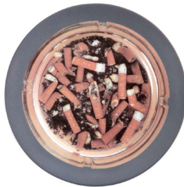
ภาพที่ 7 Damien Hirst: “Home Sweet Home”, 1996, screen print on porcelain plate, 21.3 cm.

เช่นเดียวกับ “Home Sweet Home” (ค.ศ. 1996) ของ Damien Hirst (ภาพที่ 7) ซึ่งใช้การพิมพ์ภาพบุหรี่ยี่ห้อจำนวนมากในที่เขี่ยบุหรี่บนจานเซรามิก เพื่อแสดงความจริงและการลวงทางสายตา ระหว่างภาพพิมพ์สองมิติบนจานสามมิติ อนึ่ง ผลงานชิ้นนี้แสดงความสัมพันธ์ระหว่างสิ่งของใกล้ตัวกับพื้นที่ส่วนตัวของศิลปิน Hirst เปรียบผลงานชิ้นนี้ดังตัวแทนที่พำนัก ซึ่งศิลปินสามารถดำรงชีวิตตามความต้องการได้อย่างไร้กฎเกณฑ์ ในขณะที่รูปแบบการผสมผสานจิตรกรรมบนภาพถ่ายของ Gerhard Richter เปิดประเด็นใหม่ระหว่างความสัมพันธ์ของรูปธรรมและนามธรรมในผลงานชุด overpainted photographs (ค.ศ. 2008) ตั้งแต่ปี ค.ศ. 1982 ศิลปินนำภาพถ่ายบุคคล อาคาร สถานที่ ตลอดจนกลุ่มเพื่อนฝูงขนาดประมาณ 4 x 6 นิ้ว มาใช้เป็น ฉากหลังและสร้างภาพนามธรรมทับซ้อนบนภาพต้นแบบ แต่ยังคงเปิดเผย บางส่วนของภาพให้ผู้ชมได้จินตนาการถึงเหตุการณ์ สถานที่ และบทสนทนาขณะนั้น การประสานกันของสองเทคนิคดังกล่าวเป็นการเพิ่มเติมความรู้สึกของศิลปินที่มีต่อภาพต้นแบบ (ภาพถ่าย) เพื่อซ้อนทับสองเวลาที่แตกต่างกัน นอกจากนั้นยังมีประเด็นที่น่าพิจารณาเพิ่มเติมคือ ผลงานบางชิ้นของ Richter เป็นตัวแทนภาพทางประวัติศาสตร์ของสังคมนิยม แนวทางดังกล่าวจึงเป็นการสร้างความหลากหลายของช่วงเวลาให้อยู่ในภาพเดียวกัน