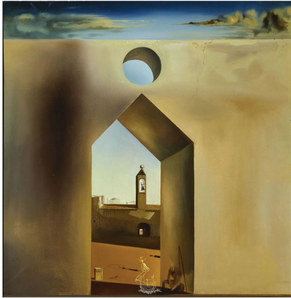
ภาพที่ 2 Salvador Dalí: "Nostalgic Echo", 1935, oil on canvas, 112.3x112.3 cm.