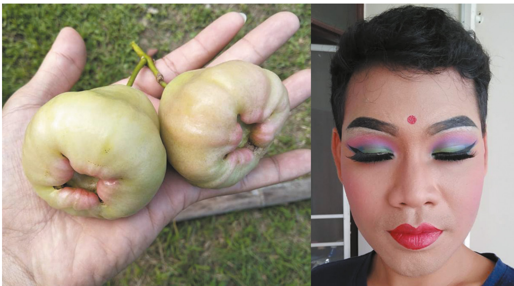
ภาพที่ 2 ลักษณะการแต่งหน้าประกอบการแสดงชุด ชมพูเพชรสายรุ้ง

การแต่งหน้า เป็นส่วนประกอบหนึ่งที่จะทำให้การแสดงสมบูรณ์แบบมากยิ่งขึ้น และเพื่อให้เป็นไปในทิศทางเดียวกัน ผู้วิจัยได้นำสีของผลชมพูพันธุ์เพชรสายรุ้ง อันได้แก่ สีเขียวและสีชมพูมาเป็นแรงบันดาลใจในการออกแบบการแต่งหน้า โดยเฉพาะบริเวณเปลือกตาได้ลงสีเขียวและสีชมพู จากนั้นนำการแต้มจุดแดงบนหน้าผากของชาวอินเดีย ซึ่งในอดีตจะนิยมใช้สำหรับหญิงที่แต่งงานแล้วและป้องกันสิ่งไม่ดีให้กับหญิงที่แต่งงานแล้ว รวมถึงยังเชื่อว่าระหว่างหน้าผากเป็นที่อยู่ของปัญญา ชาวอินดูจึงนิยมแต้มจุดเพื่อเป็นสิริมงคลแก่ตนเอง เรียกการแต้มจุดแดงบนหน้าผากว่า “บินดิ” (Siamganesh 2018, online) นอกจากนี้การแต้มบินดิยังเป็นแฟชั่นของหญิงอินเดียอีกด้วย ผู้วิจัยจึงนำแนวคิดที่ว่าชมพูเป็นผลไม้ที่มีต้นกำเนิดมาจากประเทศอินเดียว่าวิเคราะห์และสร้างสรรค์เป็นรูปแบบการแต่งหน้าของนักแสดงหญิง