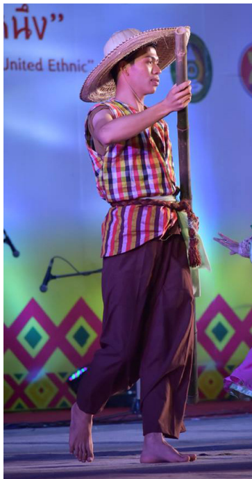
ภาพที่ 6 ลักษณะการแต่งกายของนักแสดงชาย ของการแสดงชมพู่เพชรสายรุ้ง