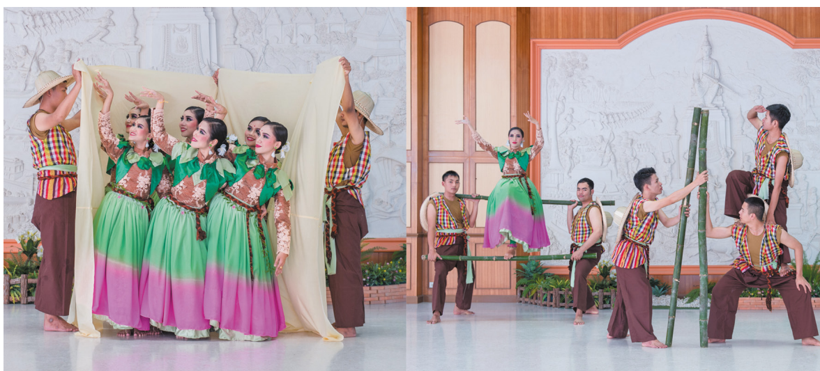
ภาพที่ 8 ภาพแสดงอุปกรณ์ประกอบการแสดง ผ้าห่อชมพู่และไม้ไผ่

ในส่วนของไม้ไผ่ ผู้วิจัยใช้ไม้ไผ่ทั้งหมด 4 ลำ สื่อแทนนั่งร้านไม้ไผ่ในสวนชมพู่เพชรสายรุ้ง ซึ่งเกษตรกรใช้นั่งร้านไม้ไผ่ในการเก็บชมพู่เนื่องจากชมพู่เพชรสายรุ้งมีลำต้นที่สูงใหญ่ การทำนั่งร้านไม้ไผ่จะช่วยให้เก็บผลผลิตสะดวกยิ่งขึ้น (Phewkum, S. 2018, Interview) ดังนั้นผู้วิจัยจึงนำผ้าและไม้ไผ่มาใช้ประกอบการแสดงเพื่อให้การแสดงเป็นไปตามข้อมูลและผู้ชมเห็นภาพไปในทิศทางเดียวกันกับผู้สร้างสรรค์ผลงาน