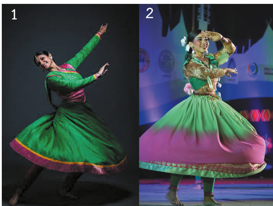
ภาพที่ 7 การนำท่าหมุนตัวของนาฏศิลป์กติกเข้ามาปรับใช้ในการออกแบบท่ารำเต๋นในการหมุนตัวของนาฏศิลป์สร้างสรรค์ชุดชมพู์เพชรสายรุ้ง โดยภาพหมายเลขที่ 1 เป็น ลักษณะการหมุนตัวของนาฏศิลป์กติกของอินเดีย ภาพหมายเลข 2 เป็นลักษณะการหมุนตัวของนักแสดงชมพู์เพชรสายรุ้ง

ท่ารำเต๋นสำหรับการแสดงชุด ชมพู์เพชรสายรุ้ง ผู้วิจัยต้องการให้ท่ารำเต๋นออกมาในรูปแบบนาฏศิลป์ร่วมสมัย โดยนำท่ารำนาฏศิลป์ไทย นาฏศิลป์กติกของอินเดีย และการเลียนแบบท่าทางจากธรรมชาติ มาผสมกัน ด้วยสาเหตุที่นำท่ารำนาฏศิลป์กติกของอินเดียมาผสมเนื่องจากตามประวัติที่ว่า ชมพู์เป็นผลไม้เขตร้อน มีต้นกำเนิดในประเทศอินเดียซึ่งเป็นศูนย์กลางการปลูกชมพู์ จากนั้นชมพู์จึงแพร่กระจายไปตามประเทศเขตร้อนต่าง ๆ (Na Songkhla 2003, 14) รวมถึงนาฏศิลป์กติกเน้นการหมุนตัว เพื่อให้เกิดความสวยงาม ดังนั้น การหมุนตัวของนาฏศิลป์กติกจะทำให้การออกแบบท่ารำเต๋นสื่อถึงความเป็นลูกชมพู์ได้ดียิ่งขึ้น เนื่องด้วยเวลานักแสดงหญิงหมุนตัวกระโปรงจะบานเป็นทรงระฆังคว่ำเสมือนเป็นลูกชมพู์