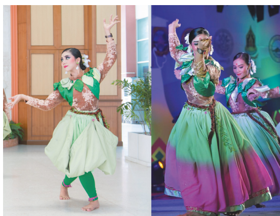
ภาพที่ 5 การออกแบบกระโปรง การแสดงชุด ชมพูเพชรสายรุ้ง ซึ่งรูปที่กระโปรงเป็นสีเขียวอ่อนทั้งหมดสื่อถึงชมพูอ่อน และภาพที่กระโปรงมีสีชมพูปรากฏบริเวณฐาน สื่อถึง ชมพูสุก

กระโปรง ลักษณะผลของชมพูเพชรสายรุ้งมีลักษณะเป็นทรงระฆังคว่ำ ลักษณะของชมพูอ่อนผลมีสีเขียวอ่อนทั่วทั้งผล แต่เมื่อผลแก่หรือสุกพร้อมรับประทานจะมีสีชมพูปรากฏบริเวณรอบฐานของผลและมีเส้นสีแดงปนชมพูขึ้นริ้วในแนวตั้งที่ผลชมพู ซึ่งเรียกว่า เส้นรุ้ง สิ่งนี้คือเอกลักษณ์ของชมพูพันธุ์นี้ ผู้วิจัยจึงนำลักษณะดังกล่าวมาออกแบบเป็นกระโปรงประกอบการแสดง โดยแบ่งกระโปรงออกเป็น 2 ลักษณะ ได้แก่ ชั้นชมพูอ่อนและชมพูสุก รวมถึงเมื่อนักแสดงหมุนตัวผู้วิจัยต้องการให้กระโปรงของนักแสดงเป็นทรงระฆังคว่ำเพื่อให้ตอบสนองกับรูปทรงของชมพูเพชรสายรุ้งมากที่สุด จึงได้เลือกสีและรูปแบบชมพูมาเป็นหลักในการออกแบบ