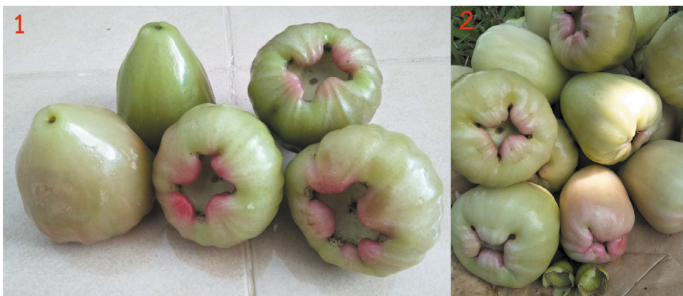
ภาพที่ 1 ความแตกต่างระหว่างชมพูพันธุ์เพชรสุวรรณและชมพูพันธุ์เพชรสายรุ้ง (© Siriwat Kamgert 25/10/2018)

ชมพูเพชรสายรุ้งและชมพูเพชรสุวรรณมีลักษณะเหมือนกันอย่างมาก โดยเฉพาะลักษณะของผลชมพู หากผู้บริโภคไม่ได้สังเกตหรือพิจารณาให้ดีอาจทำให้เข้าใจผิดได้ ความแตกต่างระหว่างชมพูพันธุ์เพชรสายรุ้ง และชมพูพันธุ์เพชรสามพราน (เพชรสุวรรณ)