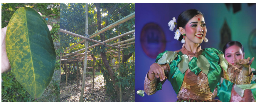
ภาพที่ 4 การออกแบบเสื้อ การแสดงชุด ชมพูเพชรสายรุ้ง (© Siriwat Kamgert 25/10/2018)

เสื้อนักแสดงหญิง ผู้วิจัยนำลักษณะต้นชมพูเพชรสายรุ้งและใบมาออกแบบ ชมพูพันธุ์เพชรสายรุ้งมีลำต้นสูงใหญ่ เปลือกของลำต้นมีสีน้ำตาลลักษณะหนาและขรุขระ ผู้วิจัยจึงเลือกผ้าที่มีสีน้ำตาล เนื้อสัมผัสไม่เรียบจนเกินไป มาใช้สำหรับตัดเสื้อ นอกจากนี้ผิวของต้นชมพูเพชรสายรุ้งมีความขรุขระและมีเส้นลายของไม้ที่เปลือกชัดเจน ผู้วิจัยจึงใช้ผ้าลูกไม้โทนสีน้ำตาลมาวางทับผ้าสีน้ำตาลอีกครั้ง เพื่อให้มีลักษณะเหมือนเปลือกไม้ โดยต้องการให้ ตัวเสื้อเหมือนลำต้นและกิ่งของชมพูพันธุ์เพชรสายรุ้ง นอกจากลำต้นและกิ่งแล้ว ผู้วิจัยสังเกตถึงลักษณะใบของชมพูเพชรสายรุ้ง และนำผ้าสีเขียวอ่อนและผ้าสีเขียวเข้มมาตัดตามรูปแบบใบของชมพูเพชรสายรุ้งและประดับลงไปบนตัวเสื้อเพื่อให้มีลักษณะคล้ายต้นชมพูเพชรสายรุ้ง