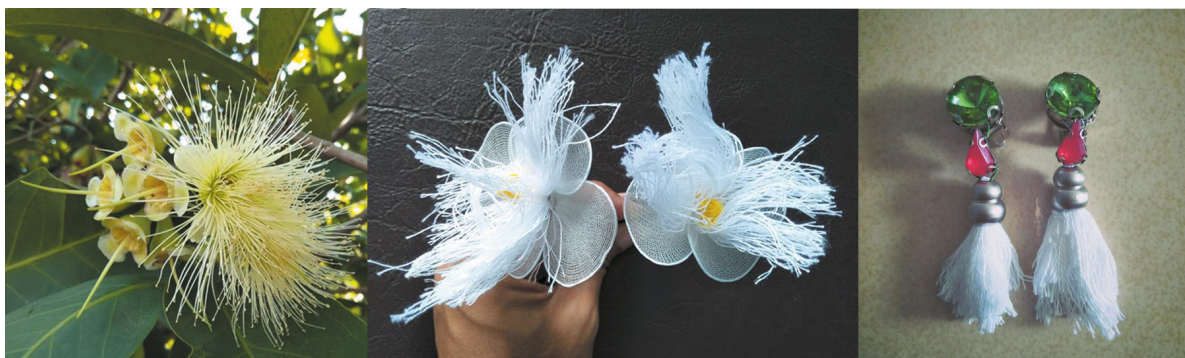
ภาพที่ 3 การออกแบบปิ่นปักผมและต่างหู การแสดงชุด ชมพู่เพชรสายรุ้ง

(1) นักแสดงหญิง ผู้วิจัยนำรูปแบบของผลชมพู่เพชรสายรุ้ง เกสร ใบ และลำต้น มาเป็นแรงบันดาลใจในการออกแบบเครื่องแต่งกายและเครื่องประดับ ได้แก่ ปิ่นปักผมและต่างหู เสื้อ และกระโปรง ปิ่นปักผมและต่างหู ผู้วิจัยได้แรงบันดาลใจมาจากดอกและเกสรของชมพู่เพชรสายรุ้งที่มีลักษณะเป็นพู่สีเขียวอ่อนปนขาว กลีบเลี้ยงของดอกมี 4 กลีบ จึงนำกลีบดอกและเกสรมาสร้างเป็นปิ่นปักผม โดยใช้ผ้าใยบัวสีขาวทำเป็นกลีบดอก และใช้เส้นด้ายสีขาวมาทำเป็นเกสร สำหรับต่างหู ผู้วิจัยนำเกสรที่มีลักษณะเป็นพู่มาออกแบบ และนำสีชมพูและเขียว ซึ่งเป็นสีของผลชมพู่เพชรสายรุ้งมาออกแบบเป็นต่างหู โดยใช้พลอยสังเคราะห์สีชมพูและเขียว มาเป็นส่วนประกอบ ดังภาพต่อไปนี้ ซึ่งจะเรียงจากทางซ้ายมือของผู้อ่านมายังทางด้านขวามือ ประกอบไปด้วย ภาพดอกและเกสรของชมพู่เพชรสายรุ้ง ปิ่นปักผม และต่างหู ประกอบการแสดง