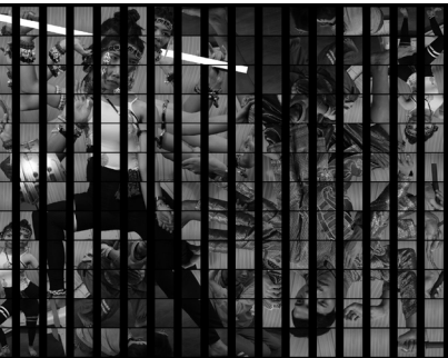
ภาพประกอบที่ 5