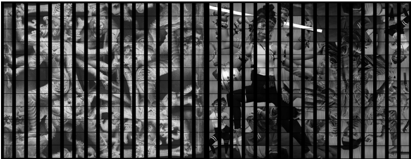
ภาพประกอบที่ 4