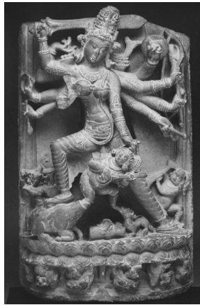
ภาพประกอบที่ 3