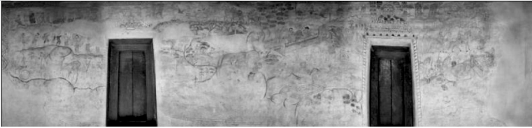
ภาพที่ 21 แสดงภาพจิตรกรรมฝาผนังด้านนอกทิศเหนือ วัดประตู่ชัย ตำบลโนนไผ่ อำเภอธวัชบุรี จังหวัดร้อยเอ็ด