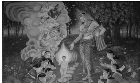
ภาพที่ 8 แสดงภาพจิตรกรรมฝาผนังด้านในทิศตะวันออก วัดศรีสุ่มังค์ ตำบลสวนหม่อน อำเภอมัญจาคีรี จังหวัดขอนแก่น