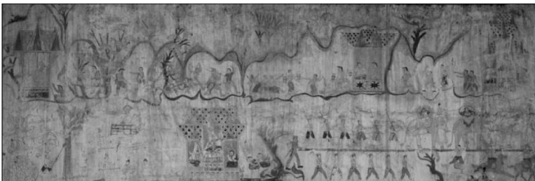
ภาพที่ 20 แสดงภาพจิตรกรรมฝาผนังด้านในทิศใต้ วัดเปือยใหญ่ ตำบลช้างเผือก อำเภอสุวรรณภูมิ จังหวัดร้อยเอ็ด