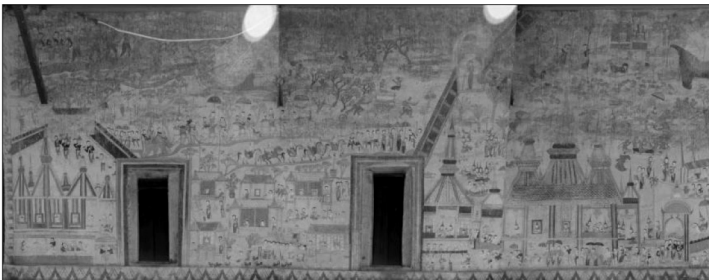
ภาพที่ 10 แสดงภาพจิตรกรรมฝาผนังด้านนอกทิศเหนือ วัดโพธาราม ตำบลดงบัง อำเภอนาดูน จังหวัดมหาสารคาม