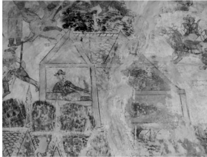
ภาพที่ 19 แสดงภาพจิตรกรรมฝาผนัง วัดขอนแก่นเหนือ ตำบลขอนแก่น อำเภอมือ จังหวัดร้อยเอ็ด