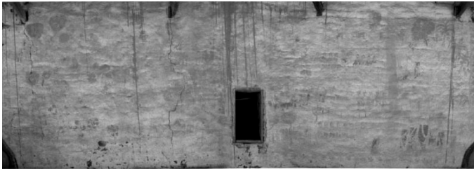
ภาพที่ 22 แสดงภาพจิตรกรรมฝาผนังด้านนอกทิศใต้ วัดมาลาภิรมย์ ตำบลเชียงใหม่ อำเภอโพธิ์ชัย จังหวัดร้อยเอ็ด

จากผลการศึกษาจิตรกรรมฝาผนังอีสานในจังหวัดขอนแก่น จังหวัดมหาสารคาม และจังหวัดร้อยเอ็ด พบว่าพัฒนาการการเขียนจิตรกรรมฝาผนังที่ปรากฏในลุ่ม สามารถแบ่งออกเป็น 2 ช่วงใหญ่ๆ คือจิตรกรรมฝาผนังที่สร้างก่อนปี พ.ศ.2500 และจิตรกรรมฝาผนังที่สร้างหลังปี พ.ศ.2500 โดยพบว่าจิตรกรรมที่สร้างก่อนปี พ.ศ.2500 พบมากถึง 15 วัด ซึ่งส่วนใหญ่มีอายุของการสร้าง ราว พ.ศ. 2400 ถึง พ.ศ. 2500 และจิตรกรรมฝาผนังที่สร้างหลังปี พ.ศ.2500 พบเพียง 7 วัด คือสร้างตั้งแต่ พ.ศ.2500 จนถึงปัจจุบัน โดยแบ่งตาม ปีที่สร้างได้ตามตารางดังนี้