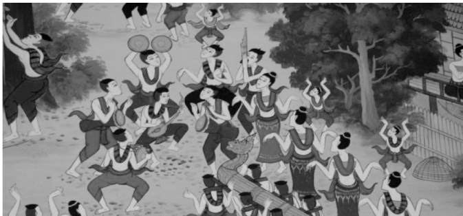
ภาพที่ 15 แสดงภาพจิตรกรรมฝาผนังด้านในทิศเหนือ วัดเหล่าจั่น ตำบลแกดำ อำเภอแกดำ จังหวัดมหาสารคาม