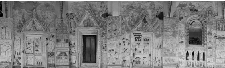
ภาพที่ 1 แสดงภาพจิตรกรรมฝาผนังด้านนอกที่วัดไชยศรี บ้านสาวะถี ตำบลสาวะถี อำเภอเมืองขอนแก่น

1.1. จิตรกรรมฝาผนังในจังหวัดขอนแก่นที่สร้างก่อนปี พ.ศ.2500 ได้แก่ วัดไชยศรี บ้านสาวะถี ตำบลสาวะถี อำเภอเมืองขอนแก่น วัดมณีมิตถาราม บ้านลาน ตำบลบ้านลาน อำเภอบ้านไผ่ วัดสระบัวแก้ว ต.หนองเม็ก อ.หนองสองห้อง วัดสวนวาริพัฒนาราม ตำบลหัวหนอง อำเภอบ้านไผ่