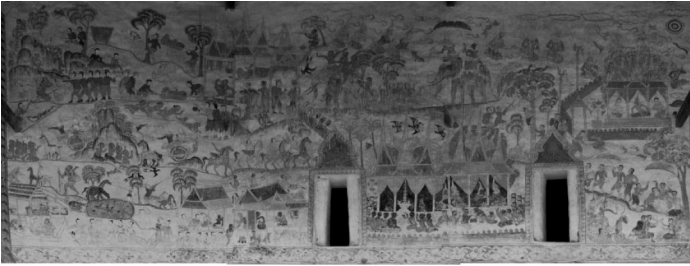
ภาพที่ 11 แสดงภาพจิตรกรรมฝาผนังด้านนอกทิศใต้ วัดป่าเรไรย์ ตำบลดงบัง อำเภอนาดูน จังหวัดมหาสารคาม