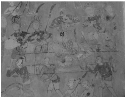
ภาพที่ 17 แสดงภาพจิตรกรรมฝาผนังวัดไตรภูมิคณาจารย์ ตำบลหัวโตน อำเภอสวรรณภูมิ จังหวัดร้อยเอ็ด