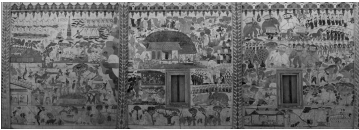
ภาพที่ 9 แสดงภาพจิตรกรรมฝาผนังด้านนอกทิศใต้ วัดยางทองวราราม ตำบลบ้านยาง อำเภอบรบือ จังหวัดมหาสารคาม

2.1. จิตรกรรมฝาผนังในจังหวัดมหาสารคามที่สร้างก่อนปี พ.ศ.2500 ได้แก่ วัดยางทองวราราม บ้านยาง ตำบลบ้านยาง อำเภอบรบือ วัดโพธาราม บ้านดงบัง ตำบลดงบัง อำเภอนาดูน วัดป่าเรไรย์ บ้านดงบัง ตำบลดงบัง อำเภอนาดูน วัดตาลเรือ บ้านโคกกลางใหญ่ ตำบลเขวาไร่ อำเภอโกสุมพิสัย