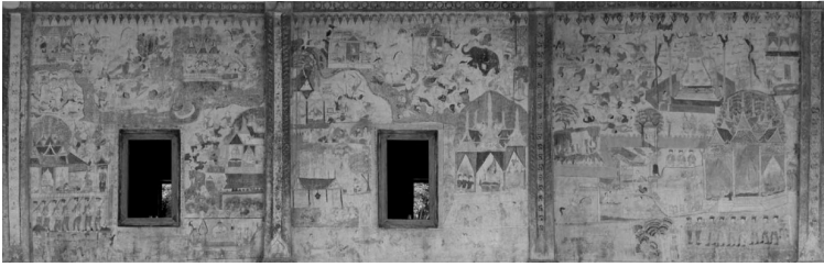
ภาพที่ 3 แสดงภาพจิตรกรรมฝาผนังด้านนอกทิศเหนือ วัดสระบัวแก้วบ้านวังคุณ ต.หนองเม็ก อ.หนองสองห้อง จ.ขอนแก่น