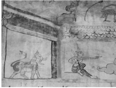
ภาพที่ 18 แสดงภาพจิตรกรรมฝาผนังวัดจักรวาลภูมิพิณิจ ตำบลหนองหมื่นถ่าน อำเภอบางบาล จังหวัดร้อยเอ็ด