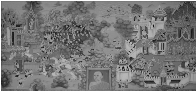
ภาพที่ 14 แสดงภาพจิตรกรรมฝาผนังด้านในทิศตะวันออก วัดตูเหนือ ตำบลหนองเหล็ก อำเภอโกสุมพิสัย จังหวัดมหาสารคาม