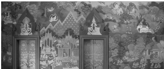
ภาพที่ 5 แสดงภาพจิตรกรรมฝาผนังด้านในทิศใต้ วัดไตรประสิทธิ์ ตำบลพระลับ อำเภอเมือง จังหวัดขอนแก่น

1.2. จิตรกรรมฝาผนังในจังหวัดขอนแก่นที่สร้างหลังปี พ.ศ.2500 ได้แก่ วัดไตรประสิทธิ์ ตำบลพระลับ อำเภอเมือง วัดป่าแสงอรุณ ตำบลพระลับ อำเภอเมือง วัดสว่างพิทยา ตำบลแดงใหญ่ อำเภอเมืองขอนแก่น วัดศรีสุ่มังค์ ตำบลสวนหม่อน อำเภอมัญจาคีรี