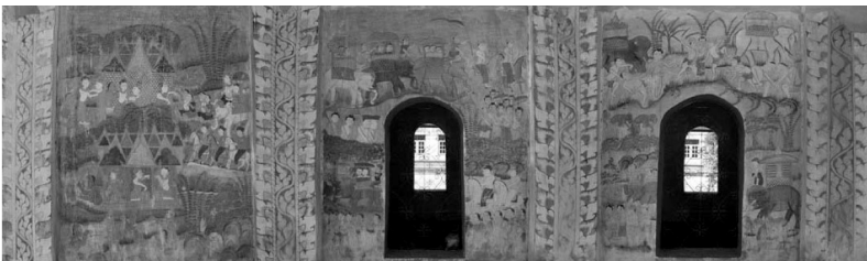
ภาพที่ 2 แสดงภาพจิตรกรรมฝาผนังด้านนอกที่วัดมณีมิตถาราม บ้านลาน ตำบลบ้านลาน อำเภอบ้านไผ่ จังหวัดขอนแก่น