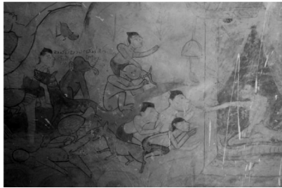
ภาพที่ 12 แสดงภาพจิตรกรรมฝาผนังด้านใน วัดตาลเรือ ตำบลเขวาไร่ อำเภอโกสุมพิสัย จังหวัดมหาสารคาม

2.2. จิตรกรรมฝาผนังในจังหวัดมหาสารคามที่สร้างหลังปี พ.ศ. 2500 ได้แก่ วัดบูรพาหนองบัว บ้านหนองบัว ตำบลวังแสง อำเภอแกลง วัดคูเหนือ บ้านคูเหนือ ตำบลหนองเหล็ก อำเภอโกสุมพิสัย วัดเหล่าจั่น บ้านเหล่าจั่น ตำบลแกลง อำเภอแกลง