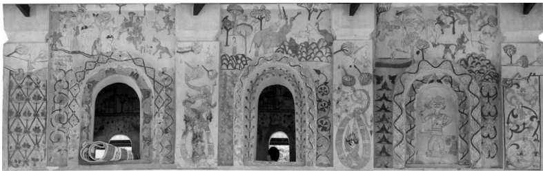
ภาพที่ 4 แสดงภาพจิตรกรรมฝาผนังด้านนอกทิศใต้ วัดสวนวาริพัฒนาราม ตำบลหัวหนอง อำเภอบ้านไผ่ จังหวัดขอนแก่น

1.2. จิตรกรรมฝาผนังในจังหวัดขอนแก่นที่สร้างหลังปี พ.ศ.2500 ได้แก่ วัดไตรประสิทธิ์ ตำบลพระลับ อำเภอเมือง วัดป่าแสงอรุณ ตำบลพระลับ อำเภอเมือง วัดสว่างพิทยา ตำบลแดงใหญ่ อำเภอเมืองขอนแก่น วัดศรีสุ่มังค์ ตำบลสวนหม่อน อำเภอมัญจาคีรี