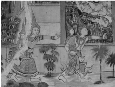
ภาพที่ 16 แสดงภาพจิตรกรรมฝาผนังวัดกลางมิ่งเมือง ตำบลในเมือง อำเภอเมือง จังหวัดร้อยเอ็ด

3.1. จิตรกรรมฝาผนังในจังหวัดร้อยเอ็ดที่สร้างก่อนปี พ.ศ.2500 ได้แก่ วัดกลางมิ่งเมือง ตำบลในเมือง อำเภอเมือง, วัดไตรภูมิคณาจารย์บ้านตากแดด ตำบลหัวโตน อำเภอสวรรณภูมิ, วัดจักรวาลภูมิพิณิจบ้านหนองหมื่นถ่าน ถนนสุวรรณนันท ตำบลหนองหมื่นถ่าน อำเภออาจสามารถ, วัดขอนแก่นเหนือ บ้านขอนแก่นเหนือ ตำบลขอนแก่น อำเภอเมือง, วัดบ้านเปลือยใหญ่ วัดประตู่ชัย บ้านประตู่ชัย ตำบลนิเวศน์ อำเภอธวัชบุรี, วัดมลาภิรมย์ บ้านหนองหูลิง ตำบลเชียงใหม่ อำเภอโพธิ์ชัย