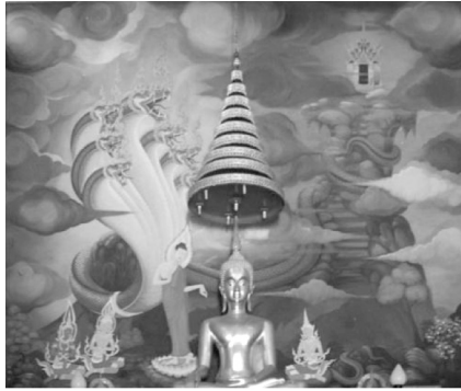
ภาพที่ 6 แสดงภาพจิตรกรรมฝาผนังด้านในทิศตะวันตก วัดป่าแสงอรุณ ตำบลพระลับ อำเภอเมือง จังหวัดขอนแก่น