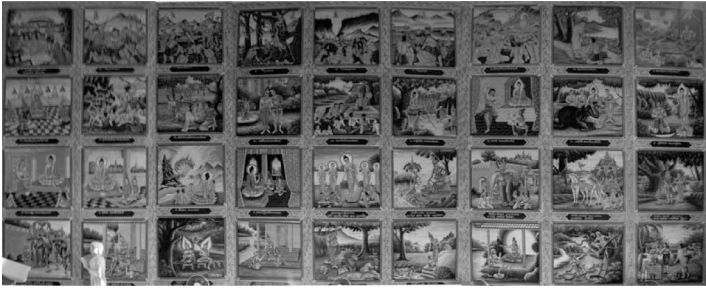
ภาพที่ 13 แสดงภาพจิตรกรรมฝาผนังด้านนอกทิศใต้ วัดบูรพาหนองบัว ตำบลวังแสง อำเภอแกดำ จังหวัดมหาสารคาม