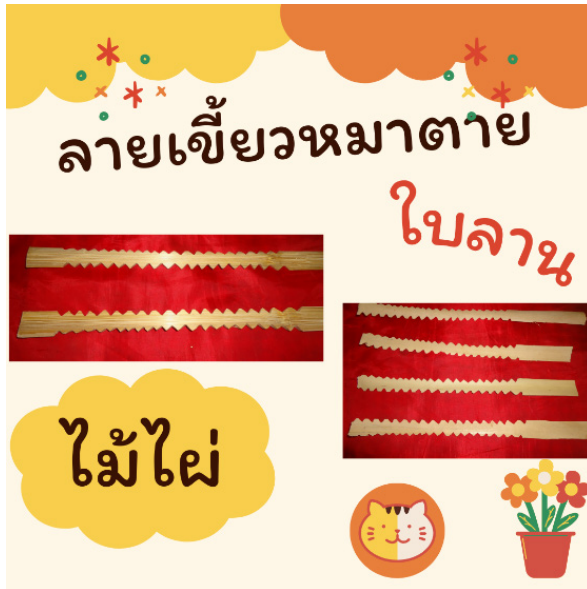
ภาพประกอบที่ 6 ลวดลายเขี้ยวหมาตาย