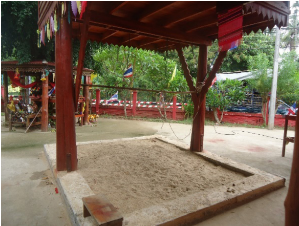
ภาพประกอบที่ 8 ที่จัดเตรียมเครื่องสังเวศ (ไก่ หมู วัว ) สำหรับเจ้าพ่อผาแดง และเจ้าพ่อมเหศักดิ์

อาการตรงข้ามกับมนุษย์ คือ ถ้าพอใจ ดีใจ จะร้องไห้ตีโพยตีพาย แต่ถ้าไม่พอใจในเครื่องสังเวศ จะหัวเราะเห็นเป็นเรื่องตลกขบขัน และการพูดจาก็จะตรงข้ามกับความหมายจริง เช่น พูดว่าปีนี้น้ำจะอุดมสมบูรณ์ ความหมายก็คือ ปีนี้จะแห้งแล้งไม่มีน้ำมาก อย่างนี้เป็นต้น เจ้าพ่อจะรับเครื่องสังเวศด้วยการดมกลิ่น เมื่อเจ้าพ่อรับเครื่องสังเวศแล้วจะทำการเสียดเรือที่สระน้ำในป่าช้าเพื่อทำนายดินฟ้าอากาศลักษณะของเรือที่ใช้ในการเสียดทายจะใช้กาบกล้วยตัดเป็นรูปสี่เหลี่ยมยาวประมาณ 1 คอกตรงกลางจะปักธูป เทียน ดอกไม้ ถ้าเรือที่เสียดจมน้ำแสดงว่าจะแห้งแล้ง เจ้าพ่อจะสั่งให้หมั้นแห้งไฟจุดถวาย เพื่อให้ฝนตกต้องตามฤดูกาล ในการแห่บั้งไฟจะใช้วัดเป็นศูนย์กลางในการจัดงาน โดยชาวบ้านจะนำบั้งไฟมาแห่รอบโบสถ์ และในขบวนจะมีการแสดงของชาวบ้านที่มาร่วมในงาน เช่น ขบวนการฟ้อนแซบลาน ขบวนตัวตลก แต่งตัวเขียนหน้าทาปากสีแดง ขบวนเซ็งกาพย์ สำหรับเซ็งกาพย์นั้น เป็นภาษาถิ่น คำที่ร้องจะสัมผัสคล้องจองกันและเป็นการร้องที่สนุกสนานใช้ประกอบในการฟ้อนแซบลาน แต่ถ้าเรือที่เสียดทายลอยตามน้ำ หมายความว่า พิษพรรณธัญญาหารจะอุดมสมบูรณ์ ก็จะเว้นไม่มีการแห่บั้งไฟ เมื่อทำนายเป็นอันเสร็จสิ้นการเสียดปี