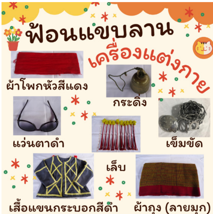
ภาพประกอบที่ 5 เครื่องแต่งกาย ฟ้อนแขกลาน