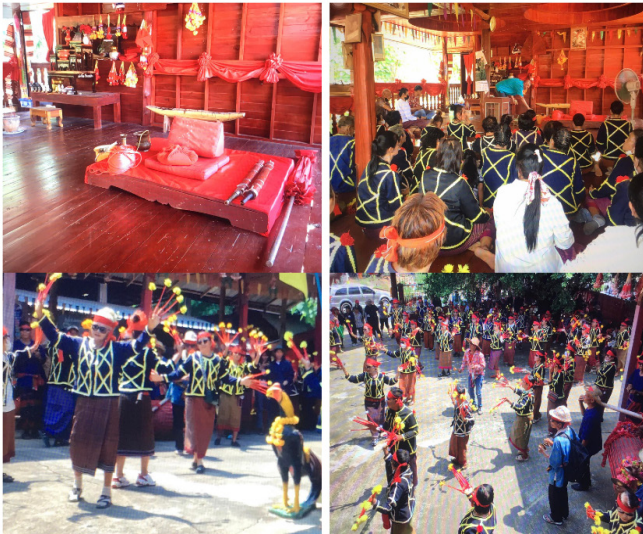
ภาพประกอบที่ 9 ราววงสรวงเจ้าพ่อผาแดงและเจ้าพ่อมเหศักดิ์