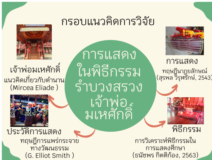
ภาพประกอบที่ 1 กรอบแนวคิดการวิจัยเรื่อง การแสดงในพิธีกรรมรำบวงสรวงเจ้าฟ่อมเหศักดิ์