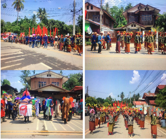
ภาพประกอบที่ 10 รูปแบบการเดินขบวนแห่