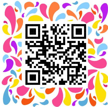
ภาพประกอบที่ 11 QR ภาพเคลื่อนไหวการแสดงฟ้อนแบบลาน วันที่ 7 พฤษภาคม พ.ศ. 2566