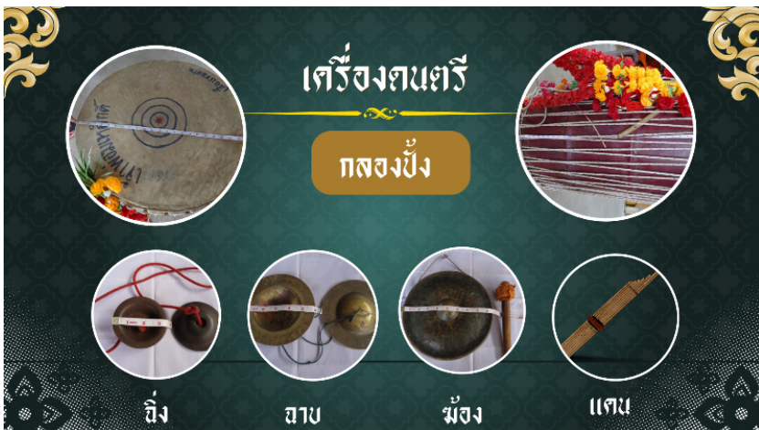
ภาพประกอบที่ 7 เครื่องดนตรี