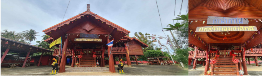
ภาพประกอบที่ 4 ศาลเจ้าพ่อมเหศักดิ์ ตำบลบ้านดู่ อำเภอหล่มสัก จังหวัดเพชรบูรณ์