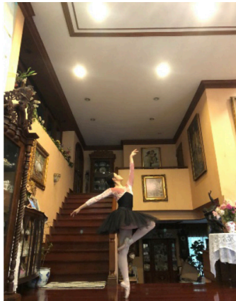
ภาพที่ 4 ผู้เรียนส่งวีดิทัศน์ความก้าวหน้าการเต้นในรายวิชาระบำนาฏยกรรมจากบ้านพักอาศัย เมื่อวันที่ 5 เมษายน 2564

3.3.2 ในส่วนของภาคปฏิบัติ ครูผู้สอนให้ผู้เรียนบันทึกวีดิทัศน์พัฒนาการและความก้าวหน้าในการเต้นที่ได้สอนในแต่ละครั้งส่งในกลุ่มไลน์ (Line Group) รวมทั้งผู้เรียนบางคนที่ยังไม่สามารถปฏิบัติท่าเต้นได้ดีตามบทเรียนที่ได้สอน