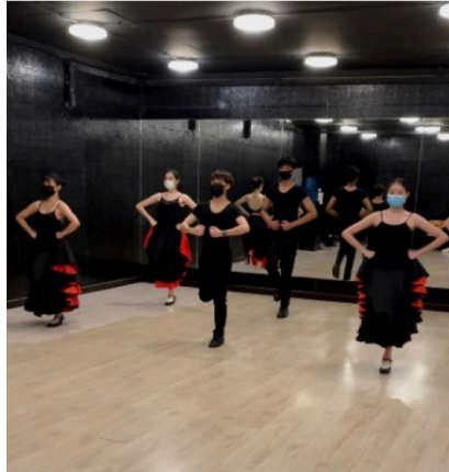
ภาพที่ 2 ผู้เรียนเรียนรายวิชาระบำสเปนที่สตูดิโอฟิตเนสเซเว่น (Fitness7)

รายวิชาระบำสเปน ซึ่งเป็นรายวิชาที่ต้องมีการใช้เท้า (Zapateado) ปรบมือ (Palmas) และเล่นกรับสเปน (Paillos) ที่ก่อให้เกิดเสียงดัง ซึ่งอาจก่อให้เกิดเสียงดังและรบกวนผู้ที่อยู่อาศัยร่วมกับนิสิตบางรายที่อาศัยอยู่ ณ หอพักหรือคอนโดมิเนียมอย่างมาก ครูผู้สอนและผู้เรียนจึงร่วมกันพิจารณาหาทางออกร่วมกันในการจัดการเรียนการสอน ด้วยการเข้าพื้นที่สตูดิโอเต้นรำของเอกชน เพื่อลดปัญหาดังกล่าว นอกจากนี้ ผู้เรียนเองยังได้แสดงทักษะในพื้นที่ที่เพียงพอได้เต็มศักยภาพและปลอดภัย