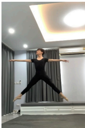
ภาพที่ 1 ผู้เรียนปฏิบัติท่าเต้นกระโดดบนเสื่อน้ำมัน (Linoleum) ในรายวิชาเทคนิคบัลเลต์

สำหรับผู้เรียนที่มีพื้นที่ของที่พักอาศัยไม่เอื้ออำนวยต่อการเต้น เช่น พื้นที่เต้นเป็นวัสดุหินอ่อน ซึ่งอาจทำให้เมื่อสัมผัสกับรองเท้าบัลเลต์หรือขณะเต้นและเกิดอันตรายหรืออุบัติเหตุได้ ครูผู้สอนจึงควรให้คำแนะนำนิสิตจัดหาเสื่อน้ำมัน (Linoleum) ที่มีคุณภาพเหมาะสมกับการเต้นชั่วคราวและราคาไม่สูงมากนัก เพื่อนำมาใช้ประกอบในการเรียนออนไลน์ที่ที่พักอาศัย ทั้งนี้ ให้เป็นความสมัครใจของนิสิตแต่ละคน