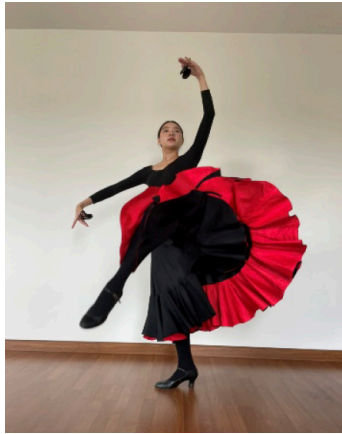
ภาพที่ 5 ผู้เรียนส่งวีดิทัศน์การสอบออนไลน์รายบุคคลในรายวิชาการบาสเปนน เมื่อวันที่ 14 พฤษภาคม 2564

3.4.5 ในรายวิชาการบาสเปนนซึ่งพบปัญหาเกี่ยวกับความล่าช้าของเครือข่ายอินเทอร์เน็ตซึ่งไม่ตรงกับจังหวะทำเต้นในขณะที่นิสิตปฏิบัติอยู่จริง ในการสอบระบาสเปนนนอกจากจะสอบออนไลน์ในรูปแบบรายบุคคลกับครูผู้สอนแล้ว ครูผู้สอนจะมอบหมายให้ผู้เรียนทุกคนปฏิบัติสอบและบันทึกวีดิทัศน์การเต้นเพื่อส่งให้ครูผู้สอนตรวจสอบอีกครั้ง