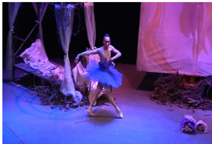
ภาพที่ 2 เครื่องแต่งกายชุดกระโปรงบัลเลต์ทรงคลาสสิคทูลู

ชุดกระโปรงบัลเลต์ทรงคลาสสิคทูลู มีลักษณะเป็นทรงแบนและตั้งขึ้นเป็นวงกลม เพื่อให้เห็นริ้วขาของผู้เต้นอย่างชัดเจน ในการแสดงชุด Ballerina นางระบำปลายเท้าผู้นำเวทนานักแสดง เปลี่ยนชุดกระโปรงบัลเลต์ทรงคลาสสิคหลากหลายสี สื่อถึงการแสดงบัลเลต์ของนักบัลเลต์หญิงเช่นเดียวกับชุดกระโปรงบัลเลต์โรแมนติคทูลู