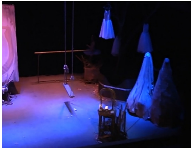
ภาพที่ 11 ชิงช้า

ชิงช้าอยู่ในตำแหน่ง ด้านขวามือของผู้ชมโดยอยู่ด้านหน้าอ่างอาบน้ำและเยื้องกับโต๊ะเครื่องแป้ง ลักษณะชิงช้าเป็นไม้กระดานสีเหลี่ยมผืนผ้าขนาดไม่ใหญ่มาก ผูกติดเชือกที่รอยตัวมาจากด้านบน