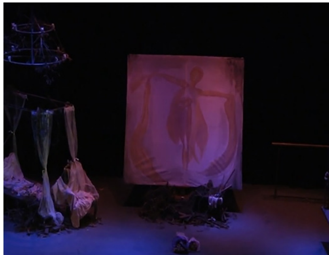
ภาพที่ 8 เตียนนอนสี่เสาและโคมระย้า

เครื่องประกอบจากเตียนนอนและโคมไฟ จัดวางอยู่ด้านซ้ายมือของผู้ชม โดยวางทแยงกับขอบเวที ด้านบนมีโคมไฟห้อยลงมา เตียนนอนมีลักษณะแบบ เตียนนอนสี่เสา (Canopy Bed) ถูกคิดค้นขึ้นในช่วงยุโรปยุคกลาง เพื่อช่วยสร้างความอบอุ่นและความเป็นส่วนตัว ในอดีตเตียนนอนสี่เสา มักถูกใช้เป็นเครื่องบ่งบอกถึงสถานะทางสังคม ยิ่งเป็นผู้มีฐานะ เตียนก็จะตกแต่งอย่างประณีตสวยงาม ในส่วนโคมไฟมีการออกแบบให้มีลักษณะแบบโคมระย้า หรือ แชนเดอเลียร์ (Chandelier) เป็นชื่อเรียกลักษณะของโคมไฟตกแต่งที่แขวนบนเพดาน ซึ่งพบว่าลักษณะของเตียนสี่เสาและโคมระย้าในฉากนี้ มีความคล้ายคลึงรูปทรงแบบเดิม แต่มีการตัดทอนรายละเอียดออกไป คงไว้ให้เห็นแต่เค้าโครงที่เสมือนจริง ดังนั้นผู้ชมจึงเห็นเป็นเสาโครงเหล็กที่ผูกผ้าสีโปร่งบางขาวไว้ตามมุมเสา มีกองผ้าวางข่มไว้บนเตียน ปลายเตียนมีเก้าอี้พนักพิงตั้งไว้ พาดผ้ายับย่น บริเวณใต้แผ่นไม้ของเตียน ตลอดจนโครงเสาเตียนและโคมไฟระย้าที่เป็นโครงเหล็กเกลี้ยงเต็มไปด้วยเศษขยะ ทั้งเศษไม้ ไม้ไผ่และเถาว์วัลย์แห้ง