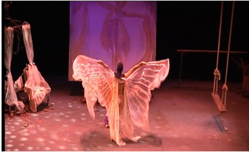
ภาพที่ 6 เครื่องแต่งกายที่ออกแบบเป็นผีเสื้อ

สำหรับลักษณะที่เป็นนามธรรม หมายถึง การตีความเชิงสัญลักษณ์ในการใช้เครื่องแต่งกายเพื่อสื่อถึง มิโนทอร์หรือสิ่งที่จับต้องไม่ได้ ได้แก่ การสวมเครื่องแต่งกายทับซ้อนกันหลายชั้นเพื่อสื่อถึงความยึดติดหรือ ลุ่มหลงในกิเลสและการเปลื้องชุดออกทีละชั้นเพื่อสื่อถึงการปล่อยวาง