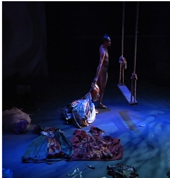
ภาพที่ 7 เครื่องแต่งกายที่ออกแบบเป็นผีเสื้อ

สำหรับลักษณะที่เป็นนามธรรม หมายถึง การตีความเชิงสัญลักษณ์ในการใช้เครื่องแต่งกายเพื่อสื่อถึง มิโนทอร์หรือสิ่งที่จับต้องไม่ได้ ได้แก่ การสวมเครื่องแต่งกายทับซ้อนกันหลายชั้นเพื่อสื่อถึงความยึดติดหรือ ลุ่มหลงในกิเลสและการเปลื้องชุดออกทีละชั้นเพื่อสื่อถึงการปล่อยวาง