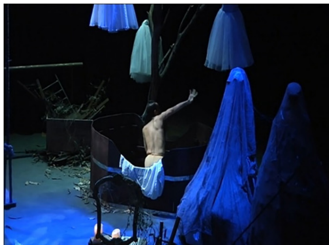
ภาพที่ 10 อ่างอาบน้ำไม้และโต๊ะเครื่องแป้ง

อ่างอาบน้ำและโต๊ะเครื่องแป้ง จัดวางอยู่ด้านขวามือของผู้ชม โดยอ่างอาบน้ำวางเฉียงลึกเข้าไปด้านเวที และโต๊ะเครื่องแป้งวางเยื้องมาอยู่ชิดขอบเวทีด้านหน้า ลักษณะของอ่างอาบน้ำเป็นอ่างอาบน้ำไม้ทรงวงรีขอบสูงและตัดเป็นขอบเว้าช่วงกลางกลางอ่าง เพื่อให้เห็นสรีระของนักแสดงในขณะที่นั่งแสดงท่าทางได้มากขึ้น โต๊ะเครื่องแป้งมีขนาดกะทัดรัด คงไว้ให้เห็นแต่กรอบกระจกที่เป็นโครงไม้ลวดลายอ่อนช้อยแต่ปราศจากกระจก