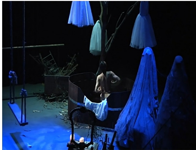
ภาพที่ 12 ต้นไม้แห้ง

ต้นไม้แห้งอยู่ในตำแหน่งหลังอ่างอาบน้ำ กิ่งก้านของต้นไม้ มีชุดบัลเลต์สีขาวแขวนอยู่ลดหลั่นกันไป บริเวณโดยรอบมีใบไม้แห้งเกลื่อนกลาด และมีลำไม้เก่าใส่เศษไม้หักวางอยู่ใกล้ ๆ