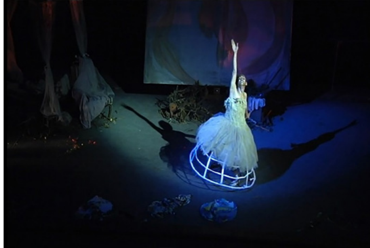
ภาพที่ 1 เครื่องแต่งกายชุดกระโปรงบัลเลต์โรแมนติคทูลูที่เพิ่มเติมโครงสู่ม

ชุดกระโปรงทรงโรแมนติคทูลู มีลักษณะเป็นกระโปรงสู่มทรงระฆังคว่ำ โดยปกติ นิยมใช้สีขาว สำหรับการแสดงชุด Ballerina นางระบำปลายเท้าผู้นำเวทนา มีการสร้างสรรค์เพิ่มเติม โดยเพิ่มโครงสู่มไปไว้ใต้กระโปรง สื่อถึงการสวมบทบาทเป็นนักบัลเลต์หญิง