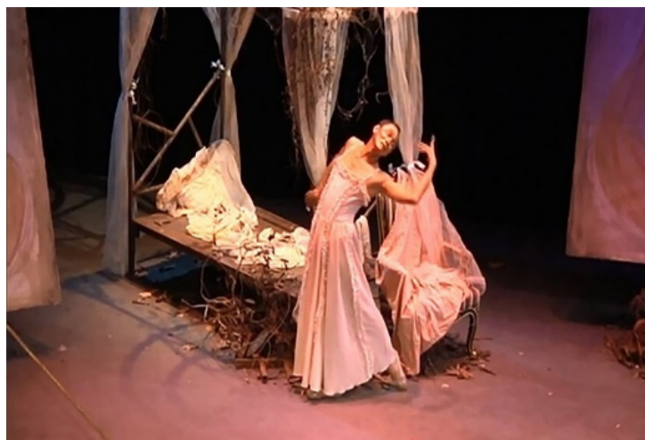
ภาพที่ 4 เครื่องแต่งกายชุดนอนสีขาวระบายลูกไม้

ชุดนอนสีขาวระบายลูกไม้ มีลักษณะเป็นชุดกระโปรงสีขาว ยาวคลุมขา ประดับตกแต่งด้วยผ้าลูกไม้ และไล่ลงมาเป็นแถวจากอกถึงชายกระโปรง ซึ่งจากรูปแบบและสีของชุด สื่อถึงหญิงสาวที่บริสุทธิ์ถึงดงาม อ่อนโยนและไร้เดียงสา