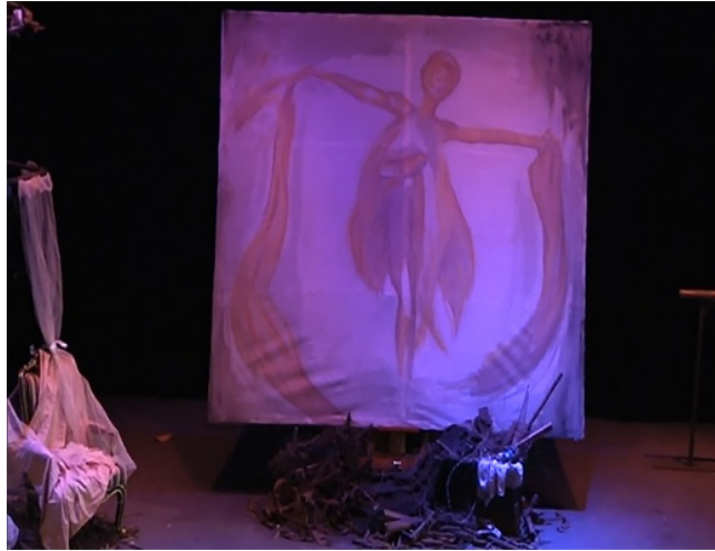
ภาพที่ 9 รูปภาพลายเส้นนางระบำ ที่มา : ผู้วิจัย

ภาพวาดนางระบำ มีขนาดใหญ่มองเห็นได้เด่นชัด รูปภาพที่ปรากฏบนผืนผ้าสีขาว เป็นการลงสีปิดแปรงให้เห็นเป็นรูปนางระบำคนหนึ่งที่ทำท่าทางแตกต่างกัน โดยภาพที่ตั้งกลางเวทีเป็นภาพนางระบำในท่ายืนและภาพที่อยู่ด้านซ้ายมือของผู้ชมเป็นท่านั่ง