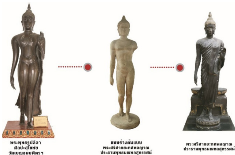
ภาพที่ 1 แผนภาพแสดงพัฒนาการทางด้านรูปแบบของพระพุทธรูปลีลา

จากการวิเคราะห์ รูปแบบศิลปกรรมของพระศรีศากยะทศพลญาณ ประธานพุทธมณฑลสุพรรณบุรี พบว่า เกิดการปรับเปลี่ยนและผสมผสานทางรูปอันเป็นอุดมคติของศิลปกรรมไทยในอดีตอย่างสุโขทัยและพระพุทธรูปมาตามแบบพระราชนิยมในพระบาทสมเด็จพระจอมเกล้าเจ้าอยู่หัว ประกอบกับรูปแบบศิลปกรรมที่เกิดการรับอิทธิพลแนวความคิดของตะวันตกในเชิง "สัจนิยม" เข้าด้วยกัน ก่อเกิดเป็นรูปแบบอย่างใหม่ขึ้นในศิลปะรัตนโกสินทร์ สมัยรัชกาลที่ 9 เป็นสำคัญ อีกทั้งปรากฏความสัมพันธ์กับการสถาปนาและสร้าง "ความเป็นชาติสยาม/ไทย" ผ่านแนวคิดชาตินิยม อันเป็นบริบททางสังคมประการหนึ่งที่เกิดขึ้นตั้งแต่รัชสมัยรัชกาลที่ 4 และสืบเนื่องต่อมาจนถึงปัจจุบัน เพื่อดึงอำนาจเข้าสู่ศูนย์กลาง การเรียกร้องให้ประวัติศาสตร์ชาติไทยเริ่มต้นที่สุโขทัย ส่งผลให้อุดมคติของคนในชาติมีประสบการณ์และความทรงจำร่วมในมิติแห่งวัฒนธรรมสุโขทัย และการนำเสนอรูปแบบอันอุดมคติในพระศรีศากยะทศพลญาณฯ คือ หมายเหตุสำคัญของการเริ่มต้นการย้อนกลับไปนำรูปแบบศิลปกรรมในอดีตมาเป็นแรงบันดาลใจสำหรับการสร้างงานศิลปะโดยเฉพาะพระพุทธรูปมาตลอดรัชสมัยรัชกาลที่ 9 และสืบเนื่องมาในรัชกาลที่ 10