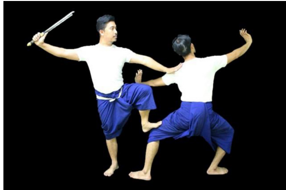
ภาพที่ 2 การสร้างสรรค์ท่ารำในกระบวนรบ

เป็นกระบวนท่ารบที่อยู่ในลักษณะของฝ่ายพระนารายณ์นั้น ยืนด้วยเท้าซ้าย เท้าขวาวางที่หน้าขาของพญาครุฑ มือซ้ายหงายมือแบ หักข้อมือลง งอแขนข้างลำตัว มือขวาถือคทาให้ท่อนแขนชิดติดกับท่อนแขนของพญาครุฑ ฝ่ายพญาครุฑนั้น หันหลัง ลงเหลื่อมขา มือทั้งสอง อยู่ในลักษณะกรงเล็บ มือซ้ายหงายวง งอแขนข้างลำตัว มือขวาให้ท่อนแขนชิดติดกับท่อนแขนของพระนารายณ์