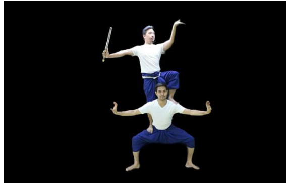
ภาพที่ 4 กระบวนท่ารำในเพลงหน้าพาทย์

เป็นกระบวนท่ารำในเพลงหน้าพาทย์กลม ที่อยู่ในลักษณะการขึ้นลอย ฝ่ายพระนารายณ์นั้น ทำขวายืนบนหน้าขาของพญาครุฑ ทำซ้ายวางบนไหล่ซ้ายของพญาครุฑ มือขวาถือคทาแขนตั้งระดับไหล่ มือซ้ายแบมือตั้งศอกขึ้น ลักษณะเดียวกับทำบัวชูฝัก ฝ่ายพญาครุฑ ลงเหยียดขา มืออยู่ในลักษณะกรงเล็บตั้งวงกลาง สื่อความหมายว่า พญาครุฑเป็นพาหนะประจำองค์พระนารายณ์ไม่ว่าจะไปที่แห่งใดพระนารายณ์จะเสด็จขึ้นจึ่งหลังพญาครุฑไป