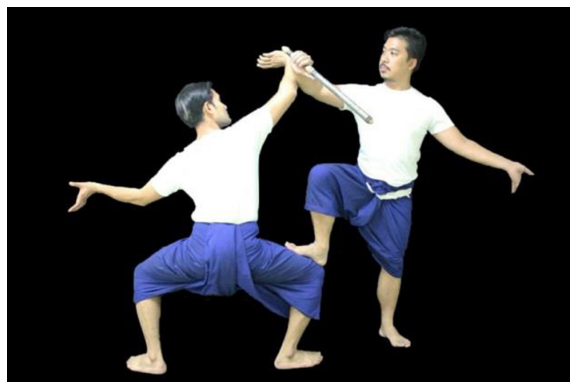
ภาพที่ 1 การสร้างสรรค์ท่ารำในกระบวนรบ