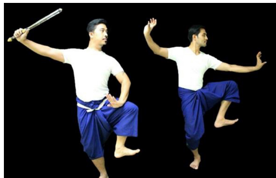
ภาพที่ 5 กระบวนท่ารำเพลงหน้าพาทย์

เป็นกระบวนท่ารำในเพลงหน้าพาทย์กลม ที่อยู่ในลักษณะการขึ้นลอย ฝ่ายพระนารายณ์นั้น ทำขวายืนบนหน้าขาของพญาครุฑ ทำซ้ายวางบนไหล่ซ้ายของพญาครุฑ มือขวาถือคทาแขนตั้งระดับไหล่ มือซ้ายแบมือตั้งศอกขึ้น ลักษณะเดียวกับทำบัวชูฝัก ฝ่ายพญาครุฑ ลงเหยียดขา มืออยู่ในลักษณะกรงเล็บตั้งวงกลาง สื่อความหมายว่า พญาครุฑเป็นพาหนะประจำองค์พระนารายณ์ไม่ว่าจะไปที่แห่งใดพระนารายณ์จะเสด็จขึ้นจึ่งหลังพญาครุฑไป