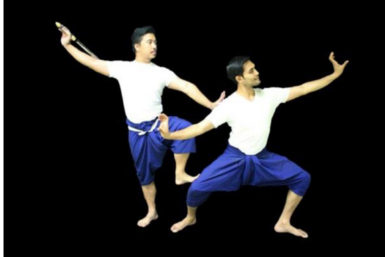
ภาพที่ 6 กระบวนท่ารำในช่วงสุดท้ายเมื่อจบเพลงหน้าพาทย์

พระนารายณ์ ยืนด้วยเท้าขวาเป็นหลัก เท้าซ้ายวางที่ระดับเข่าซ้ายของพญาครุฑ มือซ้ายวางแตะที่ไหล่ขวาของพญาครุฑ มือขวาขจัดคทาอยู่ที่ต้นแขนขวา หน้ามองไปทางซ้าย ฝ่ายพญาครุฑ ลงเสี้ยวขวา มืออยู่ในลักษณะกรงเล็บมือขวาระดับวงกลาง มือซ้ายระดับวงบน หน้ามองไปทางซ้าย