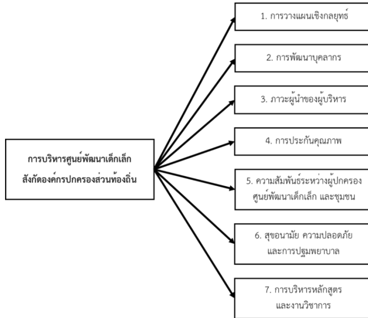
ภาพที่ 1 กรอบแนวคิดในการวิจัย