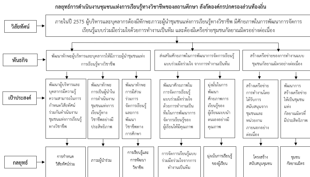
ภาพที่ 2 กลยุทธ์การดำเนินงานชุมชนแห่งการเรียนรู้ทางวิชาชีพของสถานศึกษาสังกัดองค์กรปกครองส่วนท้องถิ่น