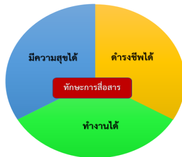
ภาพที่ 1 แผนภาพทักษะการสื่อสารและความต้องการจำเป็น 3 ได้

แคลนแรงงานอันเนื่องมาจากการขยายตัวของภาคเกษตรและอุตสาหกรรมอย่างรวดเร็วในขณะที่แรงงานไทยมีจำนวนน้อย และมีข้อจำกัดในการเลือกรับงานที่ต้องใช้แรงงานหนัก ได้รับเกียรติน้อย และอันตราย แต่อย่างไรก็ตามแรงงานที่ผู้ประกอบการต้องการจำเป็นต้องมีคุณลักษณะด้านความคิดสร้างสรรค์ ความตรงต่อเวลา ความรับผิดชอบต่องานที่ได้รับมอบหมาย และการมีทักษะทางวิชาชีพ เพื่อให้ผลการปฏิบัติงานมีคุณภาพได้มาตรฐานต่อไป ทั้งนี้คุณลักษณะดังกล่าวมีอาจเกิดขึ้นได้ หากแรงงานมีข้อจำกัดเรื่องการสื่อสาร กล่าวคือ การทำงานเกิดข้อผิดพลาดได้ง่าย การต่อยอดทักษะและความชำนาญในการทำงานเป็นไปได้ช้า เกิดความขัดแย้งกับเพื่อนร่วมงานคนไทยที่สืบเนื่องมาจากการแสดงวิธีคิด ความรู้สึกและการแสดงพฤติกรรมตามแบบวัฒนธรรมของตนทำให้เกิดความเข้าใจที่คลาดเคลื่อน รวมทั้งการเข้าไม่ถึงบริการด้านสาธารณสุขขั้นพื้นฐานด้วย ดังนั้นความต้องการจำเป็นของการพัฒนาแรงงานต่างด้าวในประเทศไทยจึงสอดคล้องกับการพัฒนาแรงงานให้เป็นทรัพยากรมนุษย์ที่มีคุณภาพของประเทศไทยซึ่งจะช่วยลดปัญหาทางด้านสังคม วัฒนธรรม และการขาดแคลนแรงงานคุณภาพในภาคธุรกิจด้วยการเตรียมความพร้อมก่อนทำงานโดยส่งเสริมทักษะการสื่อสารควบคู่กับการเรียนรู้วัฒนธรรมประเพณี เพื่อให้เกิดต้นทุนในการปรับตัวทางสังคมและวัฒนธรรมจนสามารถดำเนินชีวิตได้อย่างเป็นปกติสุข