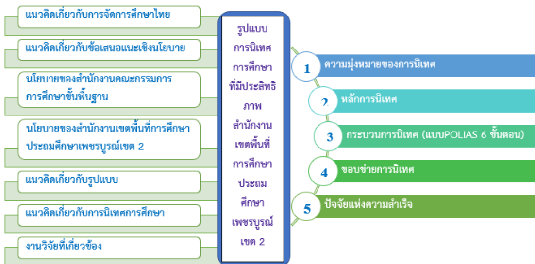
ภาพที่ 1 แสดงกรอบแนวคิดการวิจัย

การวิจัยเรื่อง รูปแบบการนิเทศการศึกษาที่มีประสิทธิภาพ สำนักงานเขตพื้นที่การศึกษาประถมศึกษาเพชรบูรณ์ เขต 2 มีกรอบแนวคิดการวิจัย แสดงดังภาพที่ 1