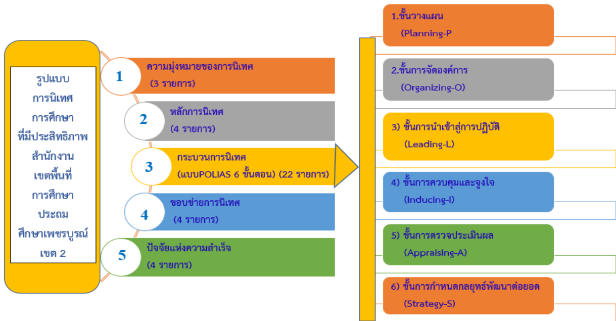
ภาพที่ 2 รูปแบบการนิเทศการศึกษาที่มีประสิทธิภาพ

การตรวจสอบรูปแบบการนิเทศการศึกษาที่มีประสิทธิภาพ สำนักงานเขตพื้นที่การศึกษาประถมศึกษาเพชรบูรณ์ เขต 2 ผู้เชี่ยวชาญมีความคิดเห็นว่ารูปแบบมีความเหมาะสมและมีความเป็นไปได้อยู่ในระดับมาก ทุกองค์ประกอบ และเป็นไปตามเกณฑ์ที่กำหนด แสดงดังตารางที่ 1