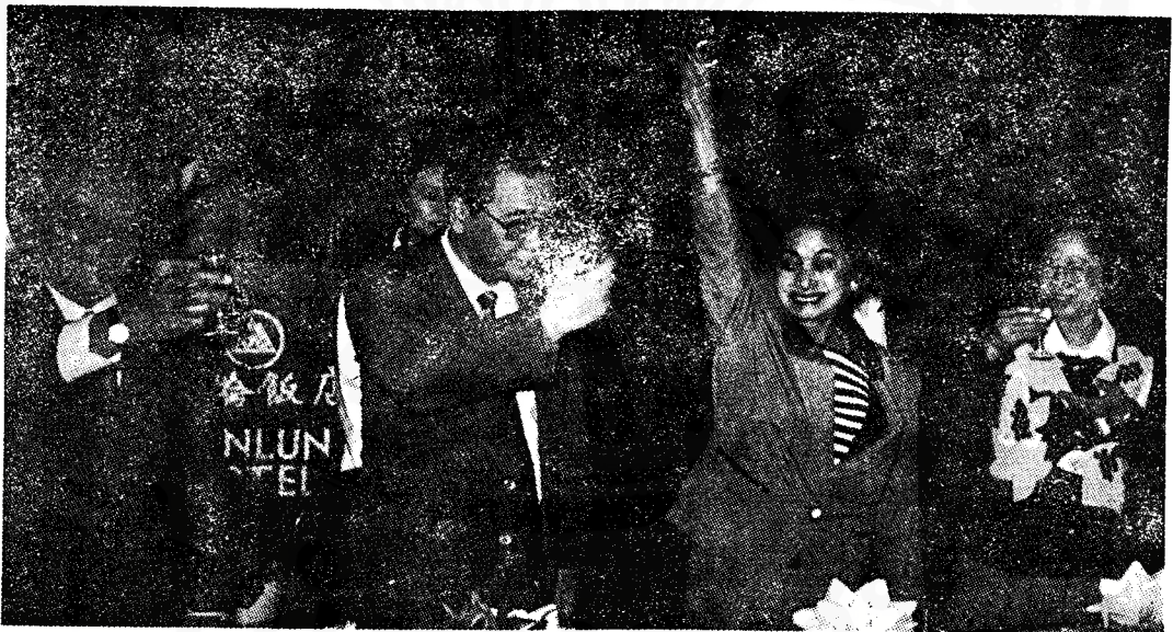
1989年3月15日，中國國務院總理李鵬（左二）和夫人朱琳（右一）在北京為 泰國總理差猜（左一）和夫人（左三）訪問中國舉行歡迎宴會。

ผลประโยชน์ที่ร่วมกันระหว่างไทยและจีน ไม่ว่าจะผ่านทางด้านการเมือง หรือเศรษฐกิจ ตลอดจนความสัมพันธ์ทางวัฒนธรรมอันยาวนานคงจะช่วยส่งเสริมให้สัมพันธ์ไมตรีระหว่าง ประเทศทั้งสองยั่งยืนสถาพร อันจะนำมาซึ่ง ความมั่งคั่งและความมั่นคงของประเทศไทยและ สันติภาพในเอเชียตะวันออกเฉียงใต้