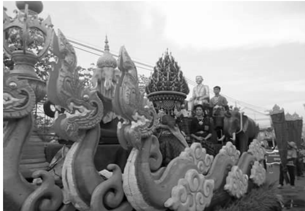
ภาพที่ 1 ขบวนแห่ในงานประเพณีบุญเดือนหก

2) ปัจจัยด้านภาวะผู้นำมีการติดต่อประสานงานและให้ความร่วมมือกับหน่วยงานภาครัฐและเอกชน โดยผู้ว่าราชการจังหวัดได้กำหนดวางแผนงานมีการจัดประชุมมอบหมายหน้าที่มีการแต่งตั้งคณะกรรมการในท้องถิ่นได้มีส่วนร่วมจัดการในประเพณีบุญเดือนหกพร้อมกัน สะท้อนให้เห็นถึงความเข้มแข็งของผู้นำและวิสัยทัศน์ในการกระจายอำนาจสู่ชุมชนให้มีส่วนร่วมพัฒนาและภาคภูมิใจร่วมกัน