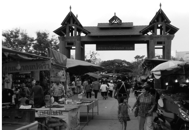
ภาพที่ 2 บรรยากาศการออกร้านค้าในงาน

2. ปัจจัยด้านภาวะผู้นำประเพณีบุญเดือนหกถือเป็นประเพณีที่ยิ่งใหญ่โดยในทุกปีท่านผู้ว่าราชการจังหวัดชัยภูมิจะเป็นประธานเปิดงานพร้อมนำชาวชัยภูมิทำพิธีถวายสักการะบวงสรวงขอพรต่อดวงวิญญาณอันศักดิ์สิทธิ์ของพระยาภักดีชุมพล หรือเจ้าพ่อพญาแลเจ้าเมืองชัยภูมิคนแรก มีการติดต่อประสานงานและให้ความร่วมมือแก่หน่วยงานภาครัฐและเอกชน โดยผู้ว่าราชการจังหวัดได้กำหนดวางแผนงานมีการจัดประชุมมอบหมายหน้าที่มีการแต่งตั้งคณะกรรมการในท้องถิ่นให้มีส่วนร่วมจัดการในประเพณีบุญเดือนหกด้วยกัน สะท้อนให้เห็นถึงความเข้มแข็งของผู้นำและวิสัยทัศน์ในการกระจายอำนาจสู่ชุมชนได้มีส่วนร่วมพัฒนาและเกิดความภาคภูมิใจที่ได้ทำงานร่วมกัน