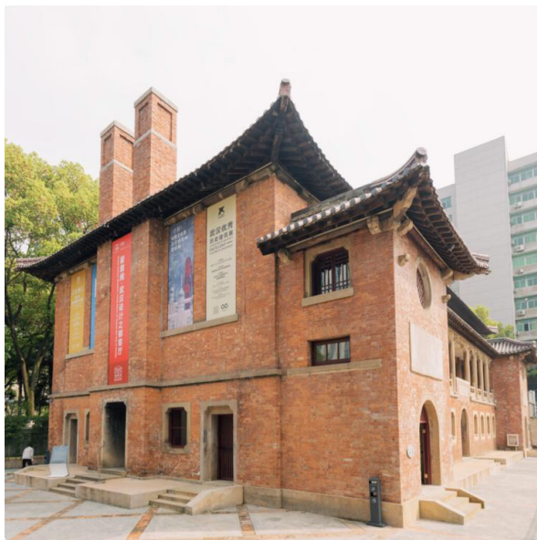
图 3. 翟雅阁健身所

二者在街区布局上形成有机穿插，如主街两侧往往一边是西式教会建筑，一边是民国别墅或老宅，既形成视觉对比，又强化了街区的文化复调。例如翟雅阁（图3）的建筑既有江南民宅的屋檐与山墙，又引入了欧式的阳台、铁艺栏杆和木格门窗，空间流线、院落层次与西式立面语言在一体化设计中自然过渡。空间谱系的交错不仅丰富了视觉体验，也让昙华林成为武汉最能代表城市开放与多元的历史街区之一。