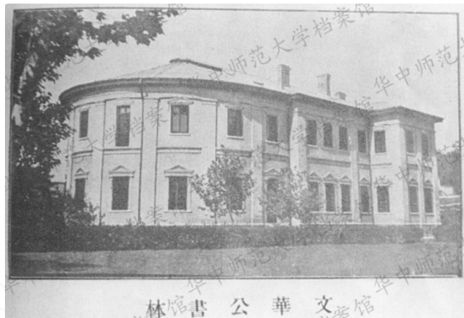
图 4. 文华公书林遗址（已拆毁）

昙华林因地处古城文化腹地，承载了大量书院与学舍的功能，不仅是地方士子研读经史、准备科举的场所，也是文人聚会、讲学论道的精神空间。1909 年，武昌文华书院发展成武汉文华大学，1910 年，文华书院扩大馆舍后命名为文华公书林（图 4），于 5 月 16 日举行了开放典礼，标志着中国近代第一个真正意义上的公共图书馆诞生，虽然这栋建筑目前已经拆毁，我们只能通过当年的照片得到文化记忆，这种以教育为核心的公共文化实践，使街区弥漫出独特的书卷气息。