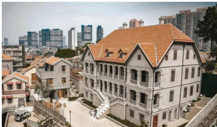
图 2. 瑞典教区旧址

昙华林街区的历史建筑在整体风格和工艺表达上极具辨识度。建筑风貌是两条强烈的空间谱系级“民国住宅/公馆”与“西式教会建筑”交织而成。民国时期别墅和里弄住宅在街区内分布广泛，造型上多用中式坡屋顶、红砖墙体、拱形阳台和镂空砖窗。主街沿线的老房子，墙体多为青砖、红砖、抹灰以及石材饰面，体现出民国时期和传教士机构对材料耐久性与表现力的双重追求。例如，瑞典教区旧址（图 2）外立面采用厚重抹灰搭配石材基座，墙面因年代久远显现出层次分明的色差与风化纹理，门窗部分则用精致的木作、铁艺作装饰。圣诞堂和真理堂等宗教建筑则普遍采用西式拱券和高大门廊，檐口雕饰、彩色玻璃、石材饰带处理得极为讲究。