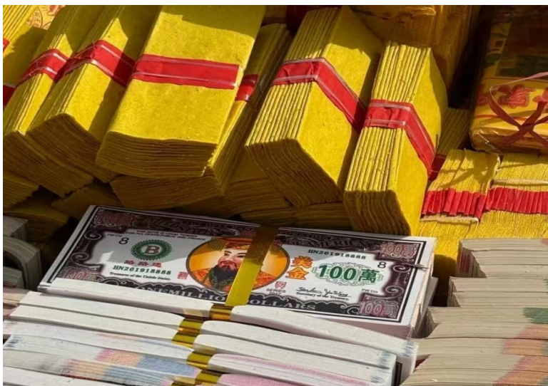
图 5-2 各式的纸钱

由于竹纤维较长，使纸张具有一定的韧性，便于折叠、裁剪和制作成各种形式的假纸币和元宝纸，在搬运和摆放过程中不易破损。而当今的纸钱早已超越了简单的“仿钞功能，其形式和种类的多样性，恰恰成为了一种独特的、充满民间智慧的审美载体。它的审美价值并非来自高雅的艺术，而是植根于民俗文化、象征主义和社会心理。