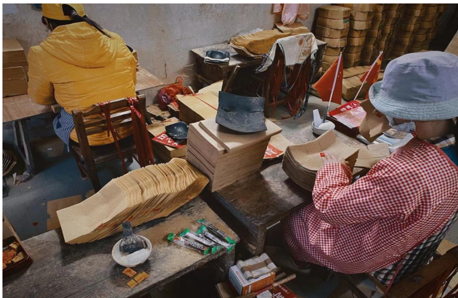
图 5-2 黄纸制作（纸钱类型中的一种）

总的来说，邓村“会纸”的审美特征不仅体现在“功能导向”的民间实用美学，而且在“文化记忆”的层面上更加显现出它的审美价值维度。下面是以邓村手工造纸最主要的祭祀产品——纸钱为例进行审美特征的分析。