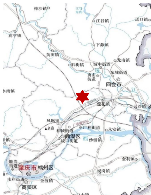
图 4-1 四会市区位地图（作者绘制）